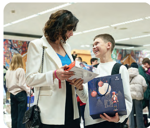
▲ Каждый ребёнок получил в подарок большую коробку с конфетами и наушники