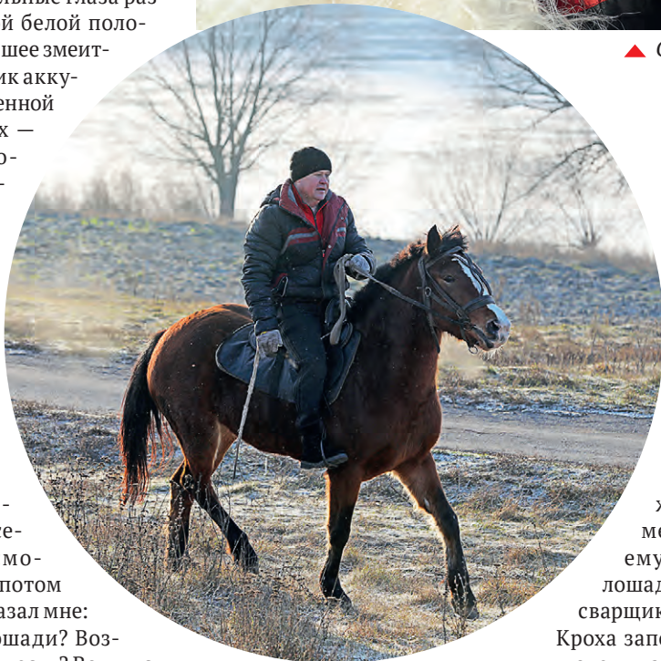
▲ Каждый день лебединец выезжает на конную прогулку