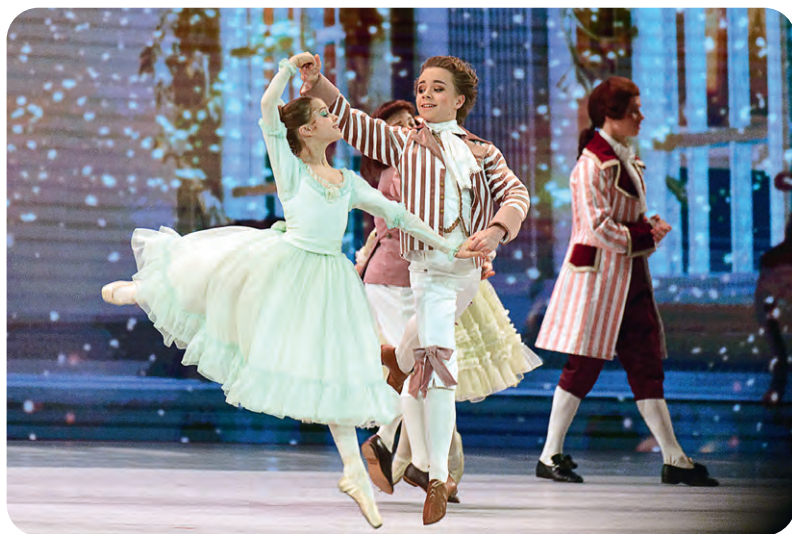
▲ На сцене — юные воспитанники Академии русского балета имени А. Я. Вагановой