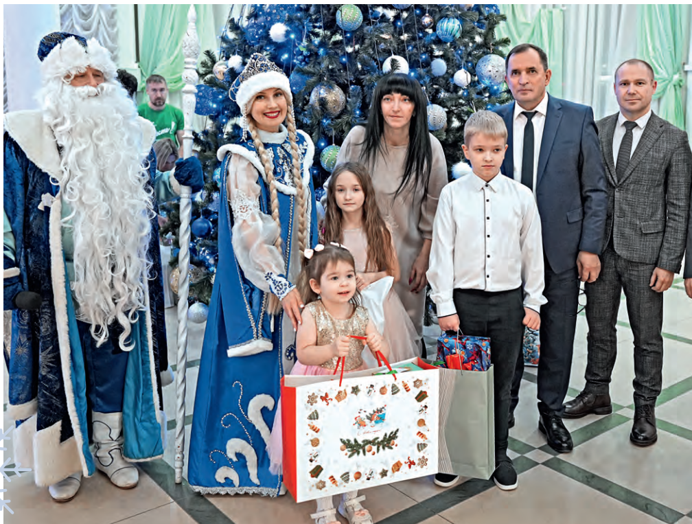
▲ В преддверии Нового года лебединцы стали добрыми волшебниками для малышей

Губкинские ребята просят у новогодних волшебников игрушки и музыкальные инструменты, наборы для лепки и рукоделия, одежду и обувь. А ещё — оптические приборы (бинокль и микроскоп), самокаты, велотренажёр и даже Библию в кожаном переплёте с золотым тиснением.