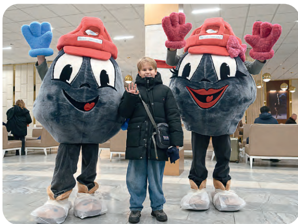
▲ В фойе гостиницы гостей встречают Окатыши. Праздник начинается!