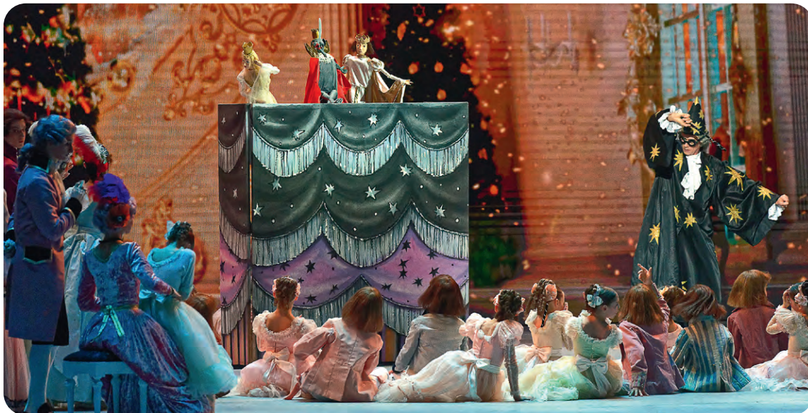
▲ Начало спектакля. Скоро куклы оживут под Рождественской ёлкой, и начнётся главное действо