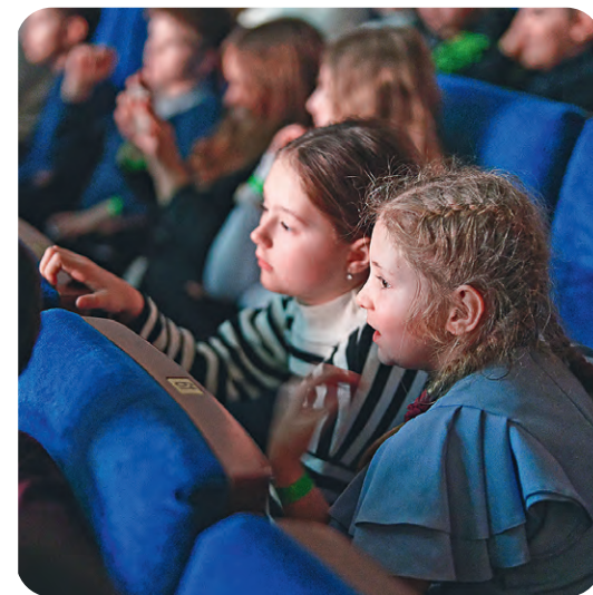
▲ В зрительном зале — искреннее сопереживание героям и ожидание чуда