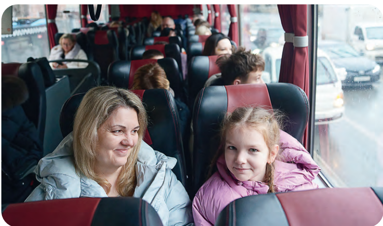
▲ Компания оплатила комфортабельные автобусы для перемещения по столице. Участников сопровождали сотрудники ГИБДД, так что движение по дорогам Москвы было максимально безопасным