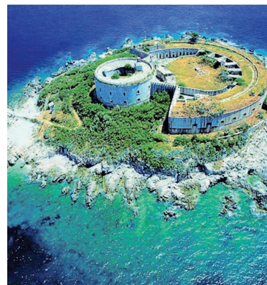
Крепость Мамула. И никаких русалок!