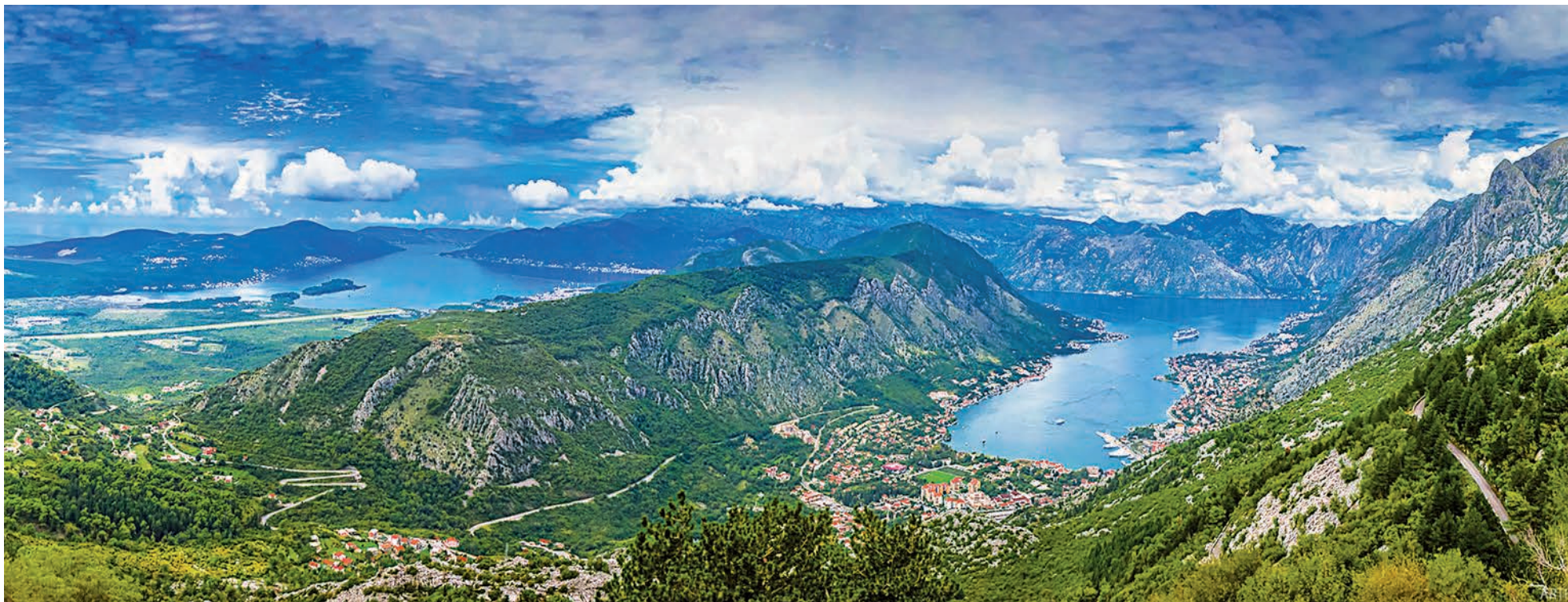
Города на берегах Бока-Которского залива с древних времён были пристанищем мореплавателей. Здесь они чинили корабли, собирали новые команды, сюда свозили со всего мира добытые сокровища.

Над Адриатическим морем солнце? Самое время для поездки по Бока-Которскому заливу на корабле! Это вторая по популярности в Черногории экскурсия.