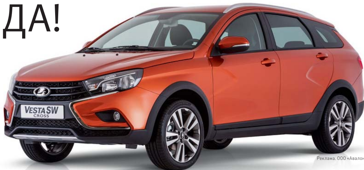
Реклама. 000 «Авалон»

Автомобиль создан для активного отдыха и длительных путешествий. Именно поэтому увеличено пространство для пассажиров заднего ряда. Климат-контроль, обогрев лобового стекла, а также подогрев всех сидений, обеспечивают комфортность поездки при любой погоде. Дополнительный бонус — подлокотник заднего сиденья с парой подстаканников, разъёмом USB, розеткой на 12 вольт. Особое внимание — водителю. Его кресло имеет комфортную посадку с регулировкой поясничного упора и высоты сиденья. Чтобы приободрить водителя Vesta SW и Vesta Cross получили стильную оранжевую подсветку шкал панели приборов. Рулевое колесо оборудовано кнопками управления мультимедиа и круиз-контролем. Противотуманные фары позволяют видеть в непростых погодных условиях, а датчики парковки придадут уверенность манёврам в ограниченном пространстве. Лючок бензобака теперь запирается центральным замком. Автомобили имеют довольно вместительный грузовой отсек с возможностью трансформации про-