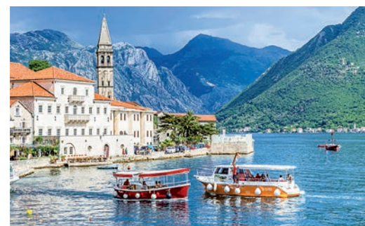
Город Пераст — колыбель мореплавания.