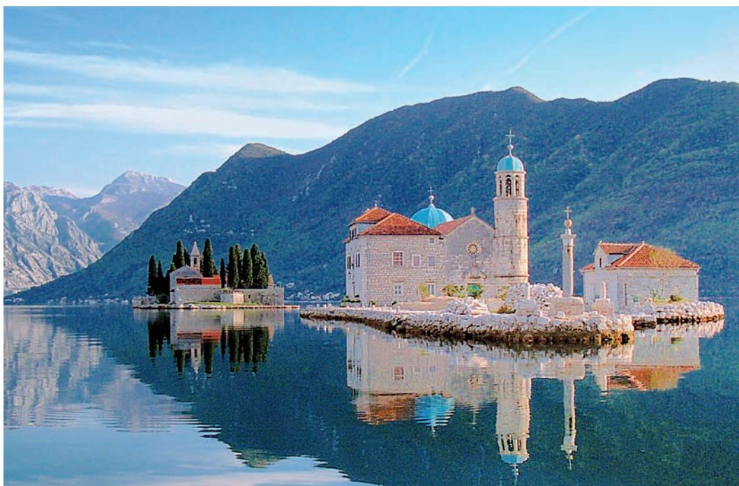
На первом плане — Госпа од Шкрпела, за ней — католический монастырь.