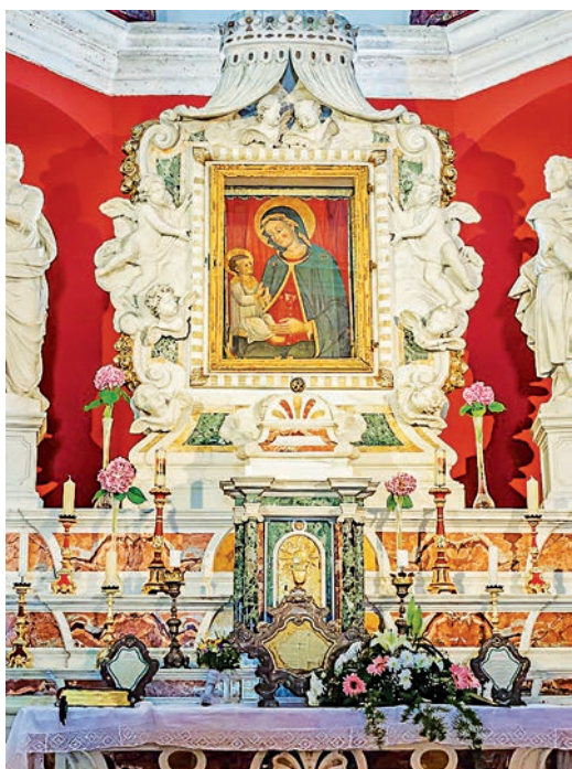
В алтаре та самая, найденная на рифе, икона.