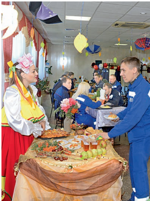
Работники обогатительной фабрики рады празднику.