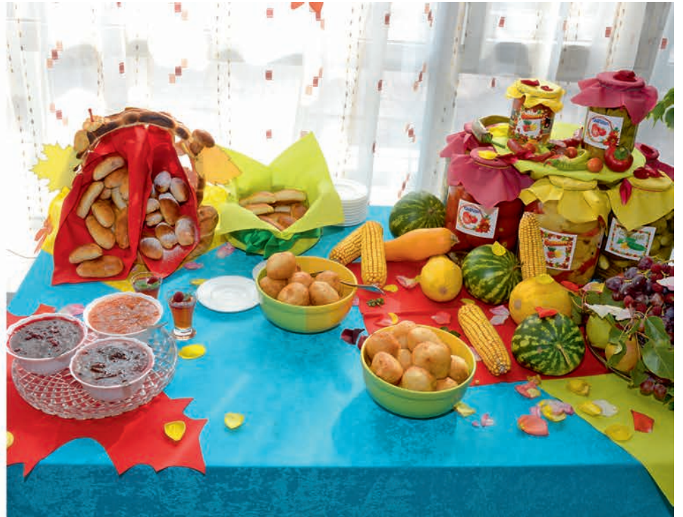
Угощайтесь, гости дорогие!

К расные, жёлтые, оранжевые листья украшают обеденные залы. Тут же разноцветные зонты. Как же без них в дождливую погоду? Не обходится осень и без вкусных даров — тыквы, яблоки, кабачки, патиссоны, баклажаны, перцы. Здесь же, словно в вазах, в ярких резиновых сапожках пристроились хризантемы и яркие грозди рябины. А какой запах! Слюнки текут, как только открываешь дверь во владения лебединских кулинаров.