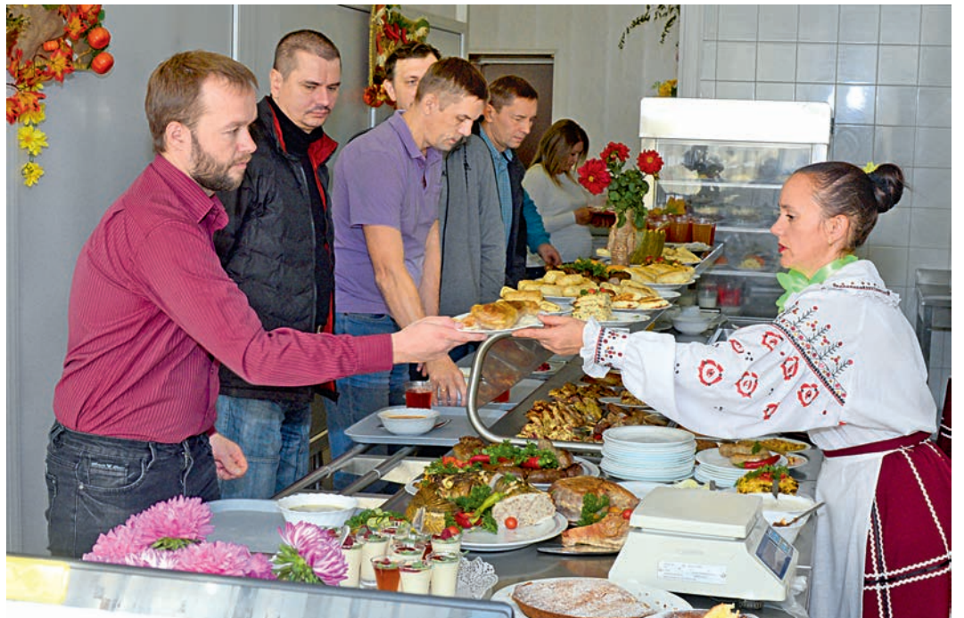
Салаты, первые и вторые блюда из овощей, а сколько выпечки! Глаза разбегаются!

Какой же праздник без угощений? Так считают и лебединские кулинары. Поэтому в каждом общепите был особый стол, где желающие могли угощаться пирогом с яблоками, тыквой, капустой или отведать оладьи с вареньем. Угощения везде разные.