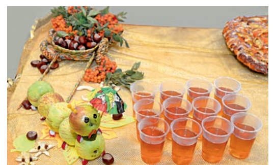
Фруктовое чудо. Вкусно и полезно.

Наталья Хаустова