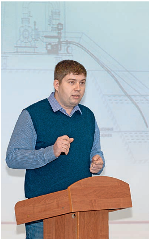
Продолжение. Начало на стр. 1,2

К слову, зарубежные компании производят подобные резцедержатели, вот только их стоимость достаточно высока. Лебединские умельцы, проанализировав заграничные образцы, разработали свой. Его использование позволит снизить время замены режущего инструмента с 20 минут до 30 секунд, увеличить класс точности изготовления изделий с пятого до четвёртого и обеспечить повторяемость установки режущего инструмента с точностью не ниже 0,02 мм. А ещё он позволяет фиксировать кассеты с усилием в 1000 кг при прикладываемом усилии в 15 кг, не склонен к самораспуску при вибрации. Кстати, разница в цене лебединской разработки и заграничной колоссальная — вместо 280 тысяч всего 8,5 тысячи рублей. Производить резцедержатели можно из металлолома. При переоснащении всего станочного парка комбината совокупная экономия при внедрении кассетных резцедержателей собственного производства, по под-