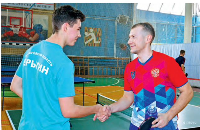
▲ За теннисным столом — соперники, после поединка — товарищи

Около 70 лебединских теннисистов сразились на звание чемпионов спартакиады комбината.