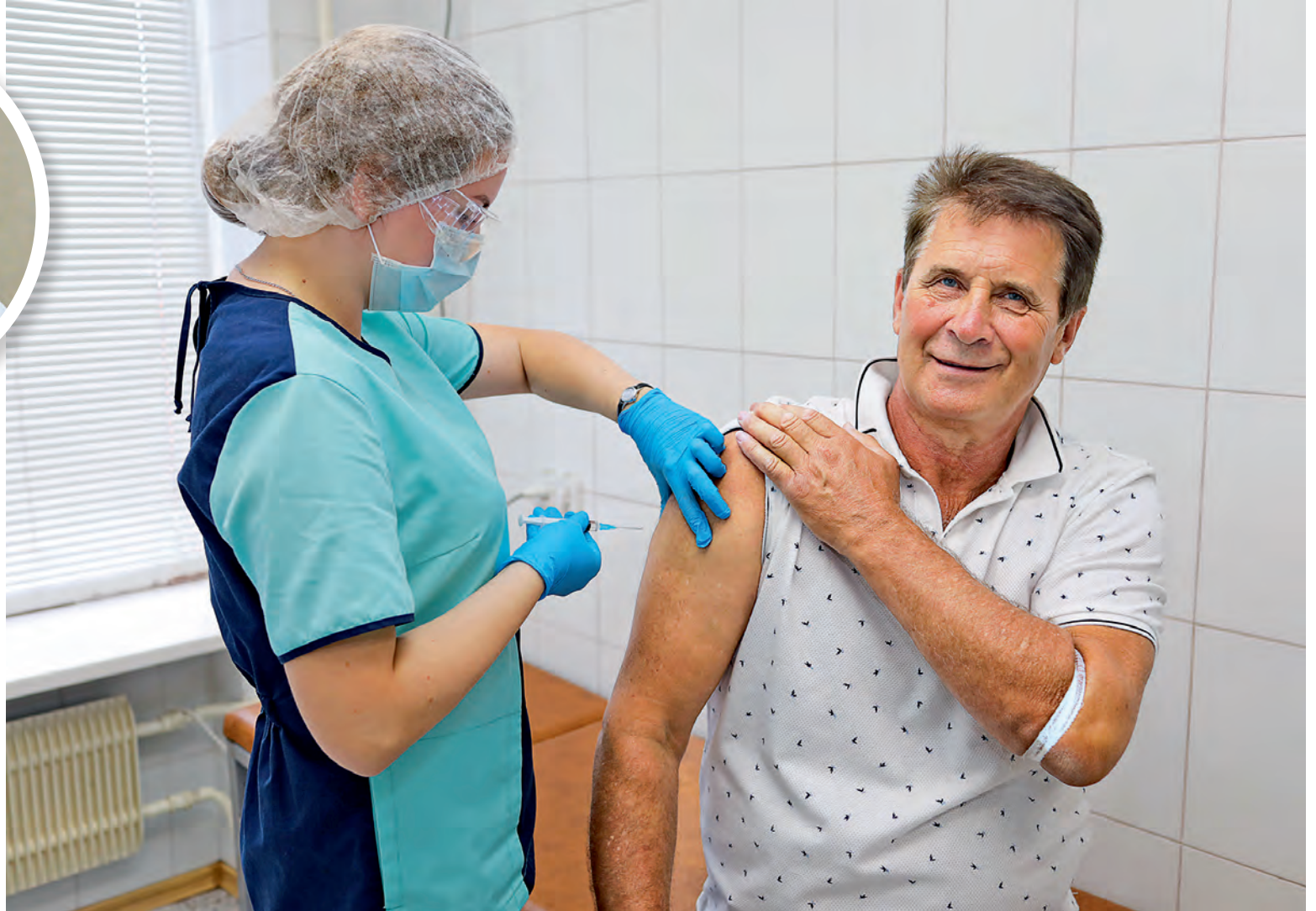
▲ Заботясь о своём здоровье, вы снижаете риск распространения инфекций в коллективе и вносите вклад в защиту здоровья близких

Грипп характеризуется высокой заразностью и тяжёлыми осложнениями. По данным ВОЗ, ежегодно им болеют около одного миллиарда человек в мире. И от 300 до 600 тысяч — это случаи с летальным исходом.