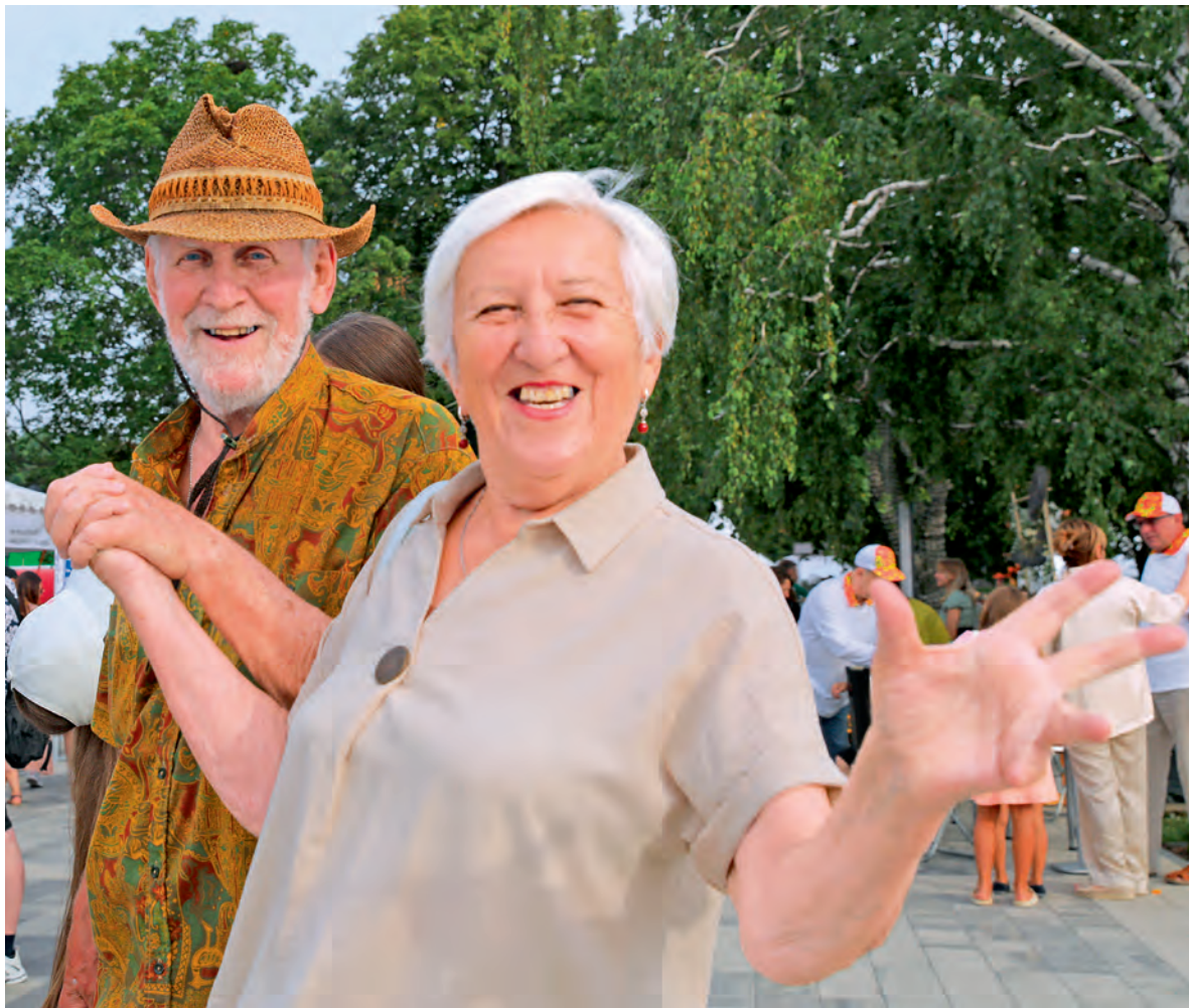
▲ Чтобы пенсия была достойной, позаботиться о ней нужно заранее

А вот урезать пенсию совершенно точно смогут перерывы в официальной работе по найму. Чем они чаще и продолжительнее — тем меньше человек будет получать на заслуженном отдыхе!