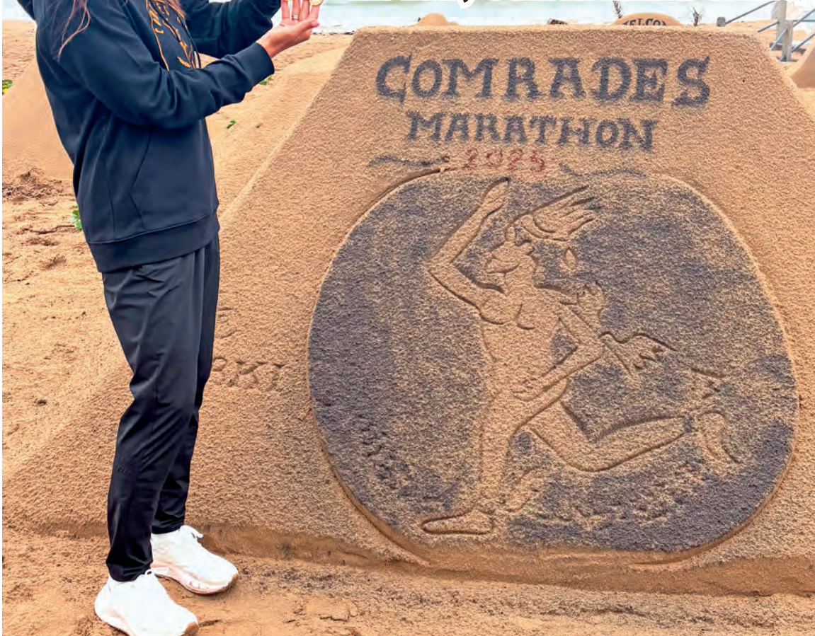
▲ В прошлом году за 10-е место оскольчанке вручили медаль из чистого золота

Почему оскольчанка ежегодно ездит на сверхмарафон в ЮАР