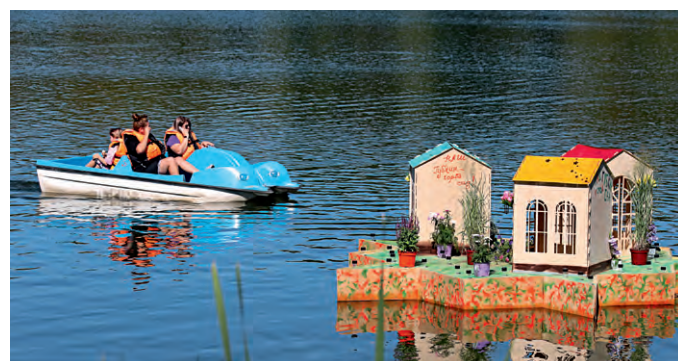
▲ Плавающими инсталляциями любовались не только с берега, но и пересекая воду на катамаранах