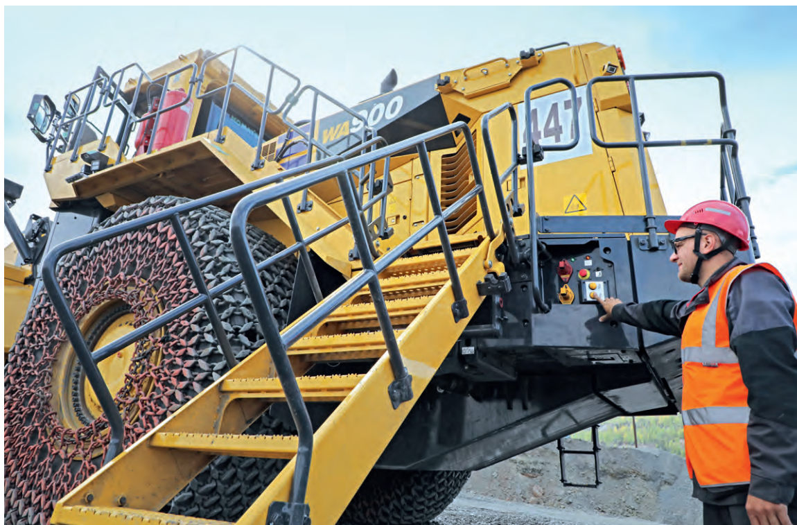
▼ Удобное нововведение — автоматическая лестница, управляемая одной кнопкой