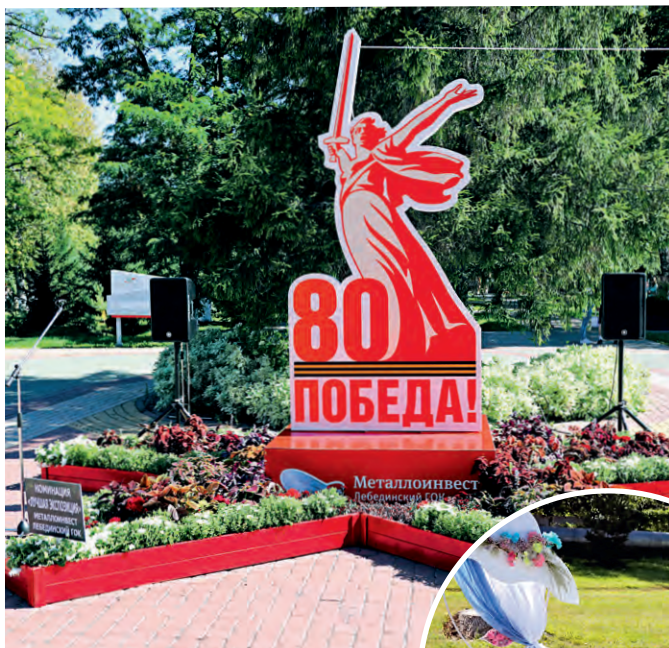
▲ Инсталляция Лебединского ГОКа первой встречала гостей выставки. Комбинат принял участие в номинации «Лучшая экспозиция» и занял первое место

— Выставка цветов — это возможность для трудовых коллективов внести вклад в украшение и создание позитивной атмосферы города. Мы отдали предпочтение многолетним растениям, чтобы в дальнейшем можно было пересадить их в клумбы. Тогда