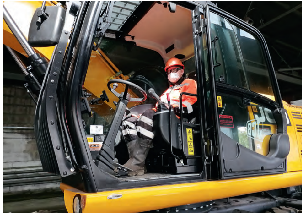
▲ Машинист многофункционального агрегата должен быть универсалом и уметь управлять железнодорожным транспортом, экскаватором и трактором

Агрегат английского производства поступил в распоряжение службы подъёмно-транспортного