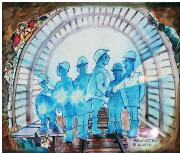
▲ «Почему бы не нарисовать наш коллектив? Только как-то необычно, чтобы всем интересно было»

— Привычные вещи со временем кажутся неинтересными, блёклыми, а что-то мы и вовсе не замечаем. Но стоит посмотреть с другого ракурса и подключить фантазию, как проявляется нечто неожиданное, притягательное в каждом предмете. Возникают совсем другие эмоции, и это делает нашу жизнь ярче и глубже, — поясняет автор. — Бывало, когда ещё работал проходчиком,