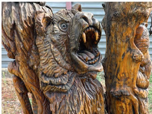
◀ Скульптуры с медведями возле АБК дренажной шахты

рисовал мелком небольшие весёлые картинки на стенах тоннелей. Ребята, проходя мимо, улыбались, смеялись. Совсем другое настроение, и труд под землёй кажется легче!