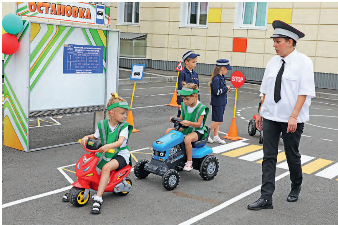
▲ В игровой форме дети «отработывали» все возможные ситуации на дороге, чтобы в будущем исключить несчастные случаи

Мальчишкам и девочкам из губкинского детского сада № 12 «Светлячок» повезло — у них появился мобильный автогородок «5Д». За названием скрыто пять слов — дороги, дети, движение, доступно, доходчиво — и особенность проекта: детсадовцы попробуют себя в роли водителей, пассажиров и пешеходов. В игровой форме они «отработают» все воз-