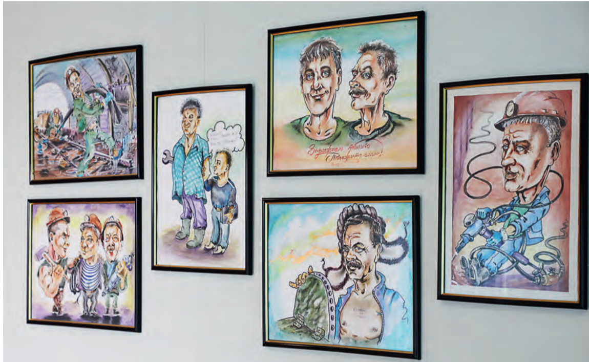
▲ Галерея шаржей Василия Лёксина — это своего рода «альтернативная доска почёта». Автор высоко ценит труд тех, кто посвятил себя шахтёрской профессии.

Евгения Шехирева