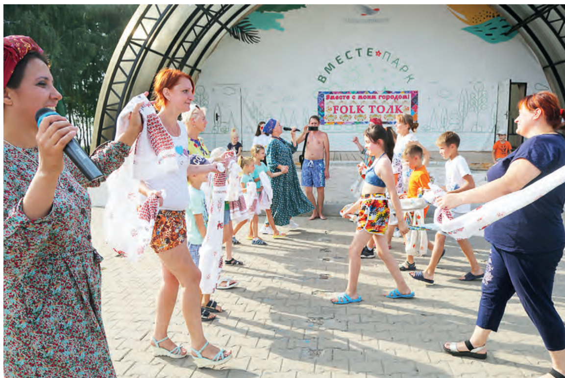
▲ Гостям предлагали послушать народные песни, пойти в пляс под фольклорные мелодии

Военная техника тут ни при чём: на этно-дискотеке гости «Вместе Парка» водили белгородские хороводы