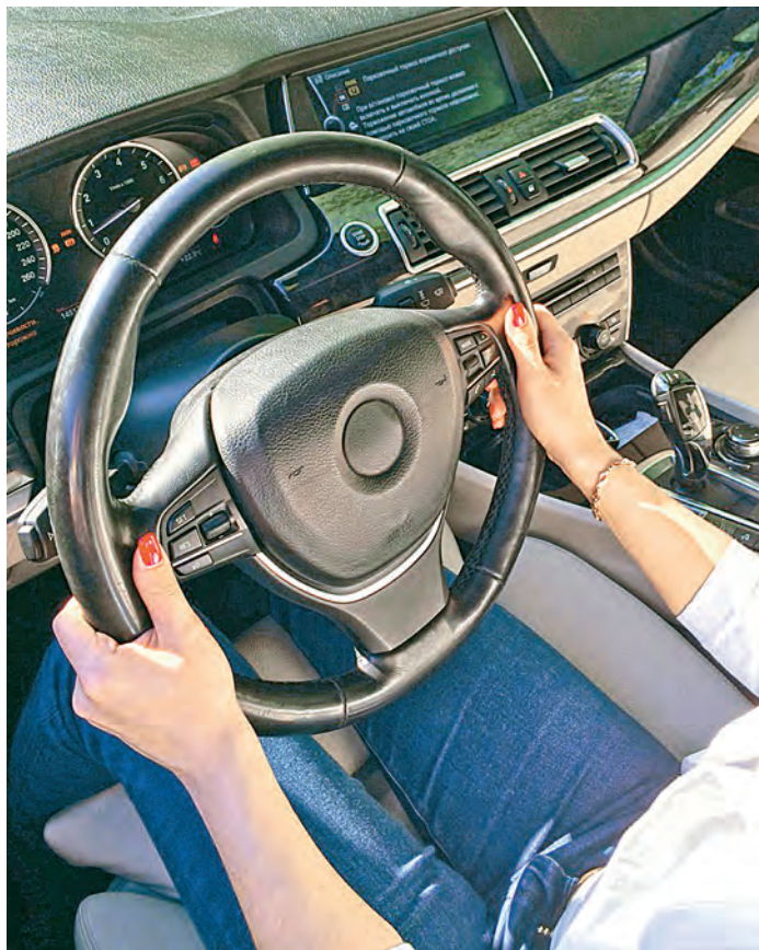
Российские водительские удостоверения нового образца несколько отличаются от тех, что были ранее.