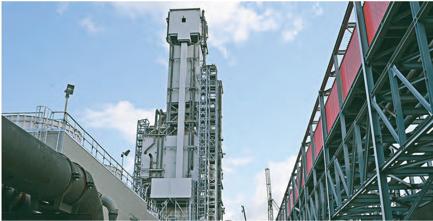
Новый объект – это новые рабочие места.