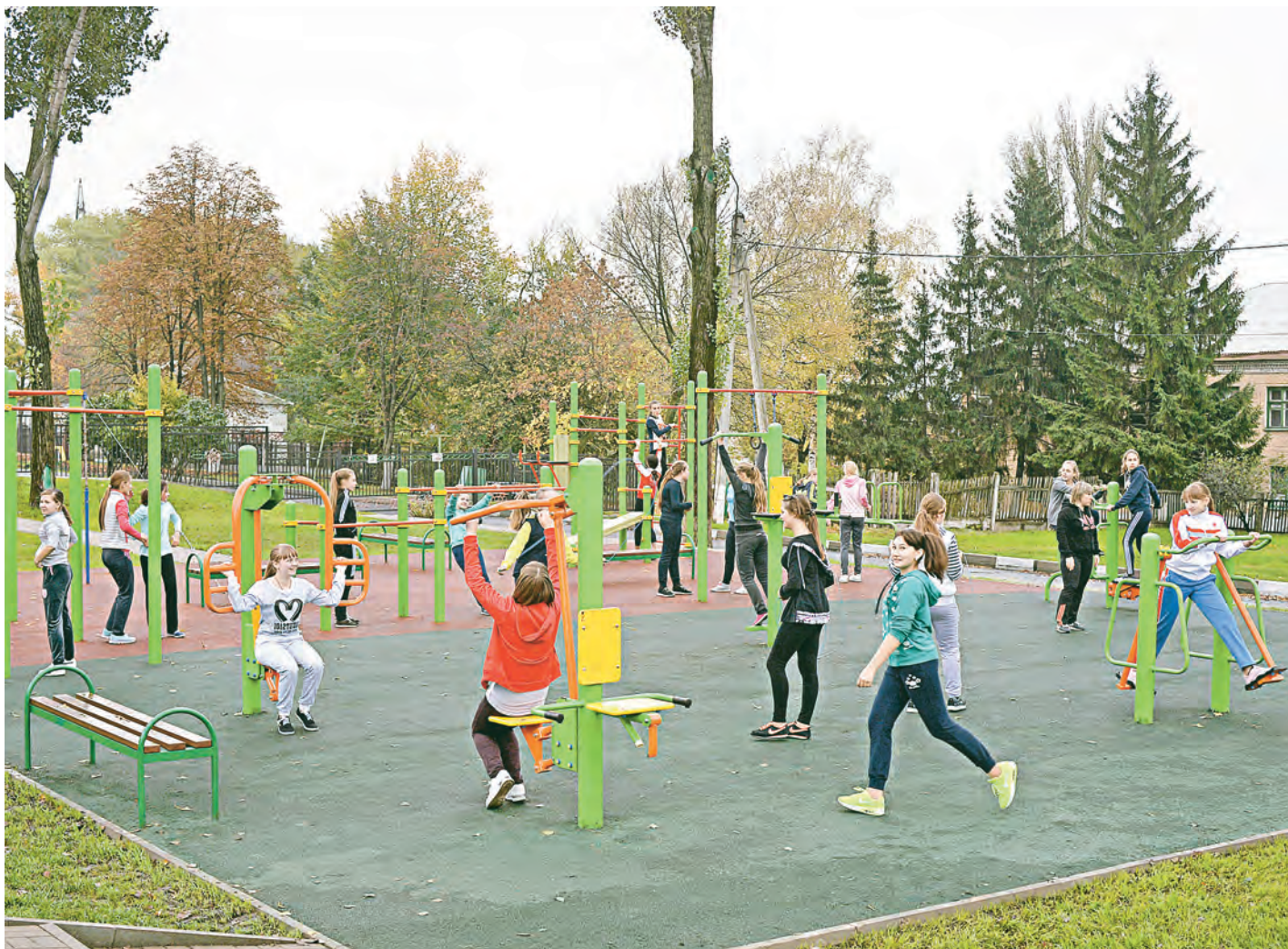
Новые спортивные площадки очень радуют и ребят, и взрослых.

10 октября компания «Металлоинвест» преподнесла жителям Губкина сразу несколько замечательных подарков в нескольких микрорайонах и центральной части города.