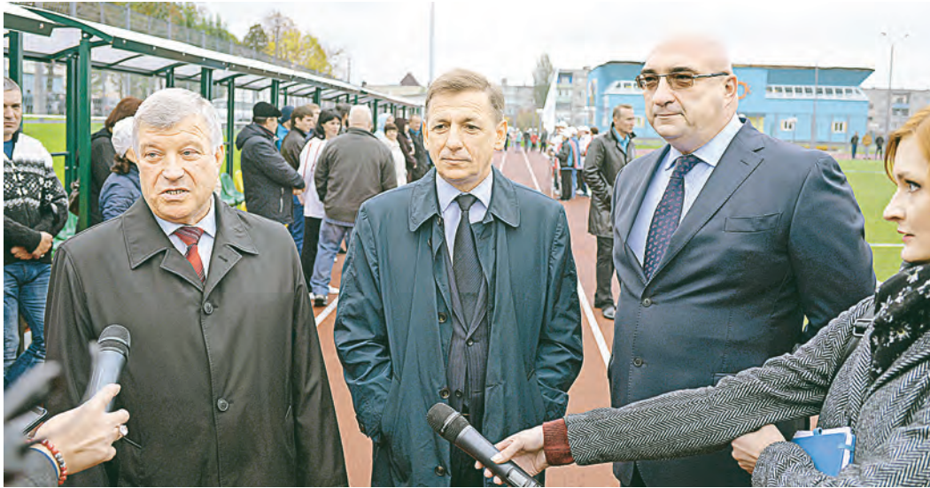
Новый стадион нравится и гостям, и жителям микрорайона.

Реконструкция, проведённая в рамках трёхстороннего Соглашения между компанией «Металлоинвест», правительством Белгородской области и администрацией Губкинского городского округа, дала стадиону вторую жизнь. Теперь это не просто арена для занятий физкультурой, это полноценный современный комплекс. Здесь оборудован сектор для прыжков в длину, возведён каскад гимнастических турников, есть площадка для уличной гимнастики (воркаута), построены крытые трибуны и комментаторская будка. На самом футбольном поле