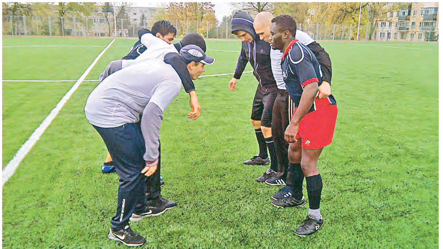
На губкинское поле вышли и наши, и регбисты из жаркой Африки.