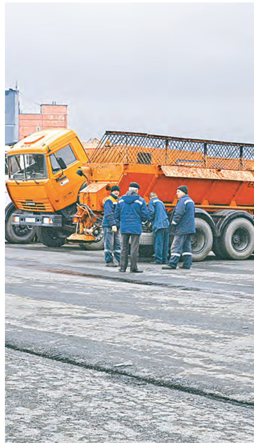
Лебединские дорожники уже вовсю готовятся к зиме.

данный момент также ведутся работы. Всего же за летний период 2016 года тружениками цеха по благоустройству было уложено около 13,5 тысяч квадратных метров дорожного полотна, на что ушло четыре тысячи тонн асфальтобетонной смеси. Кстати, необходимым качественным материалом для магистралей специалисты дорожного хозяйства обеспечивают Лебединский ГОК самостоятельно, благодаря имеющейся асфальтобетонной установке. Но укладка дорожного полотна – не единственная обязанность работников подразделения. В летний сезон также были обновлены и покрашены бордюры и стойки, разметка пешеходных переходов, установлены новые дорожные знаки. В общем, список мероприятий обширен. Теперь лебединские дорожники вовсю готовятся к зиме, ведь похолодание уже не за