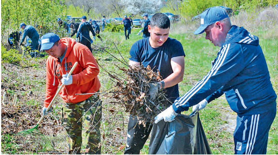
▲ Субботник объединил губкинцев, стремящихся сделать любимый город ещё краше и комфортнее

Территория у ручья, расположенная между улицами Логовая и Иноходцева, последние три десятка лет предоставлена сама себе. Но жители города помнят, что раньше это место, как и стадион «Труд» поблизости, было уютным уголком для отдыха и занятий спортом людей всех возрастов. И сегодня ему намерены вернуть ухоженный вид.