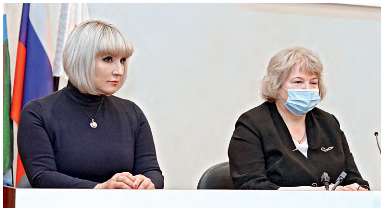
▲ Узнать о вакцинации от специалистов — разумный подход при принятии решения о прививке от коронавируса

Евгения Шехирева