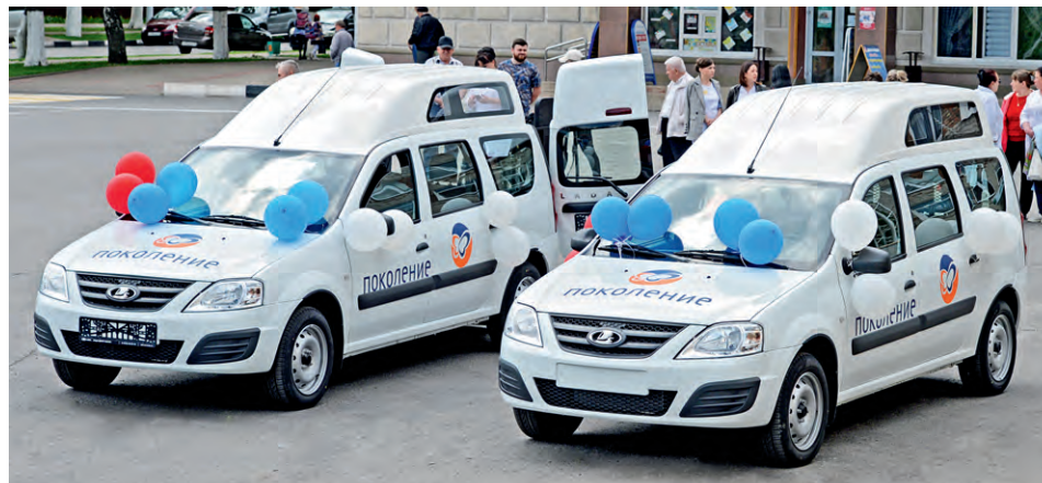
▲ Специализированные автомобили — полезное приобретение для медиков и социальных работников

Евгения Шехирева