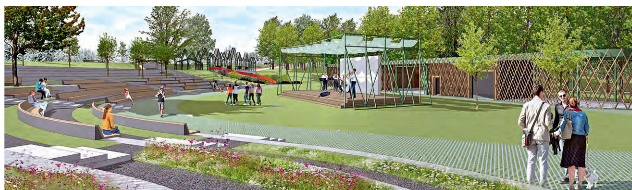
▲ Долина ручья Тёплый Колодезь может стать любимым местом отдыха губкинцев — проект предусматривает много интересных ландшафтных решений