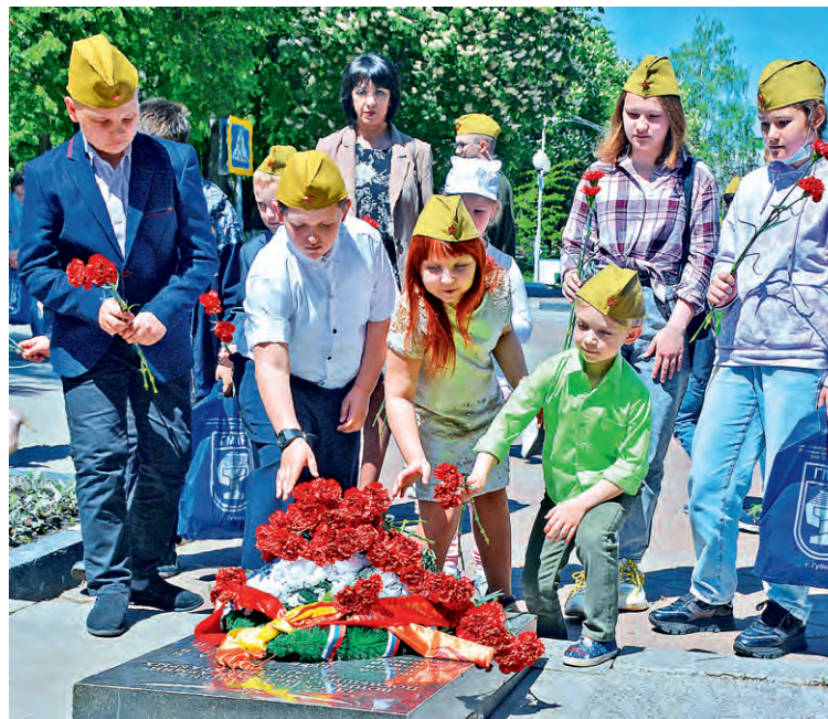
▲ Память о героизме участников Великой Отечественной войны — бесценное наследие, передаваемое от поколения к поколению

— Важно, чтобы дети знали, какой ценой досталась Победа. Такие конкурсы помогают не только сохранить память, но и систематизировать домашние архивы. Спасибо за это профкому: вы делаете очень значимое и важное дело, — высказала мнение мама