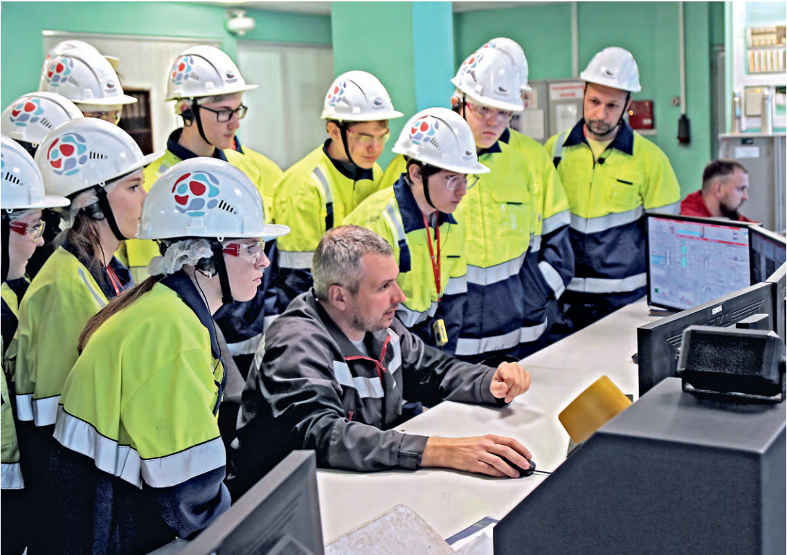
▲ На центральном пульте управления ЦГБЖ-3 школьникам рассказали о том, как ведут технологический процесс

Ребятам объяснили: у каждого сотрудника не только свои