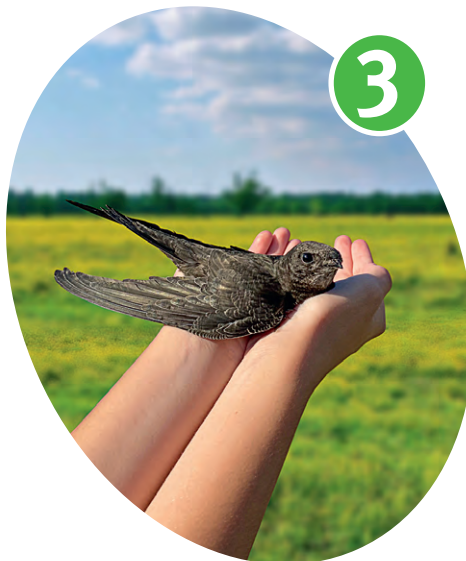
▲ В конце лета Юпитер отправился в полёт