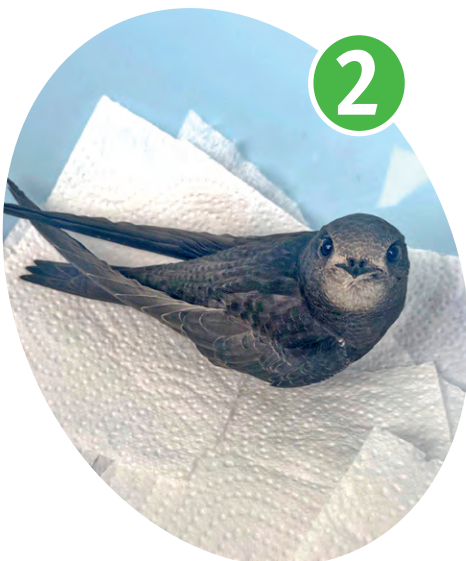
▲ ...но за считанные недели его вес вырос в несколько раз!