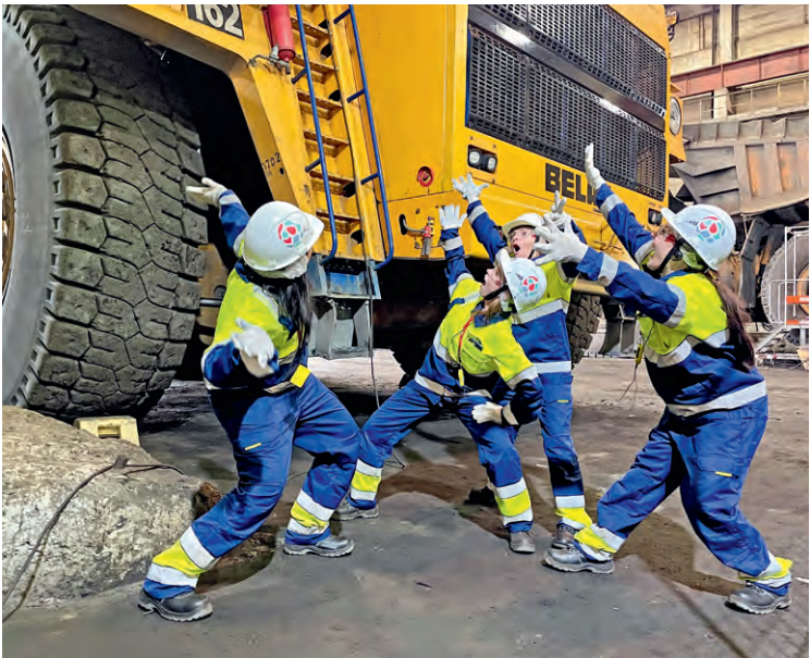
► Уровень восхищения гигантскими большегрузами ребята отобрали в забавных фотосессиях и селфи

обязанности, но и определённый уровень подготовки. Например, стать газовщиком шахтной печи на заводе ГБЖ не так просто: нужно несколько лет работать на производстве и получить высокий разряд.