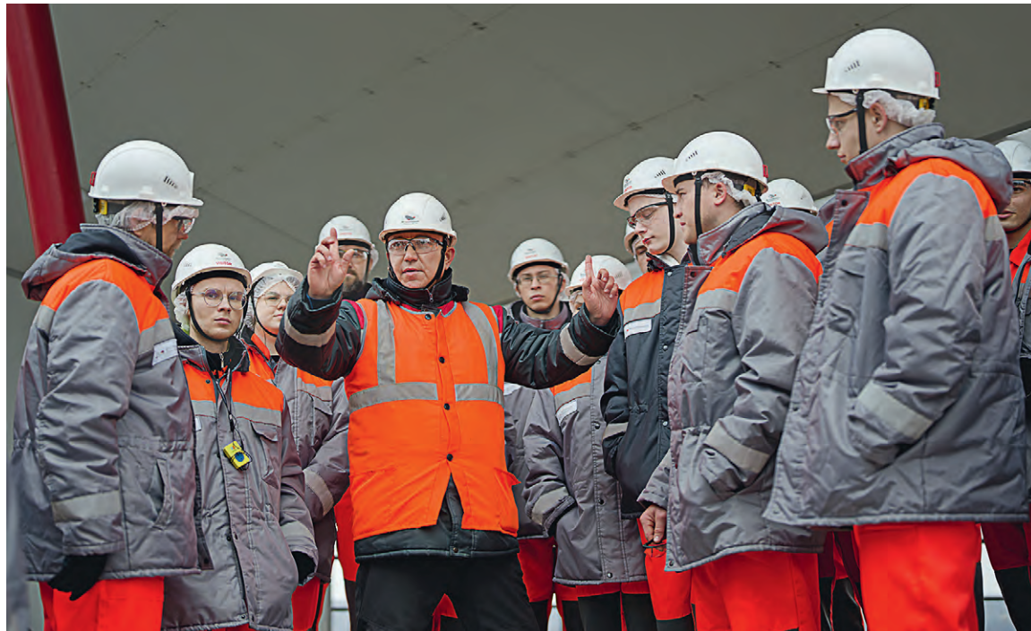
▲ На предприятиях Металлоинвеста студентам всегда рады. Они приезжают сюда на экскурсии, проходят стажировки и проводят исследования при подготовке дипломных работ