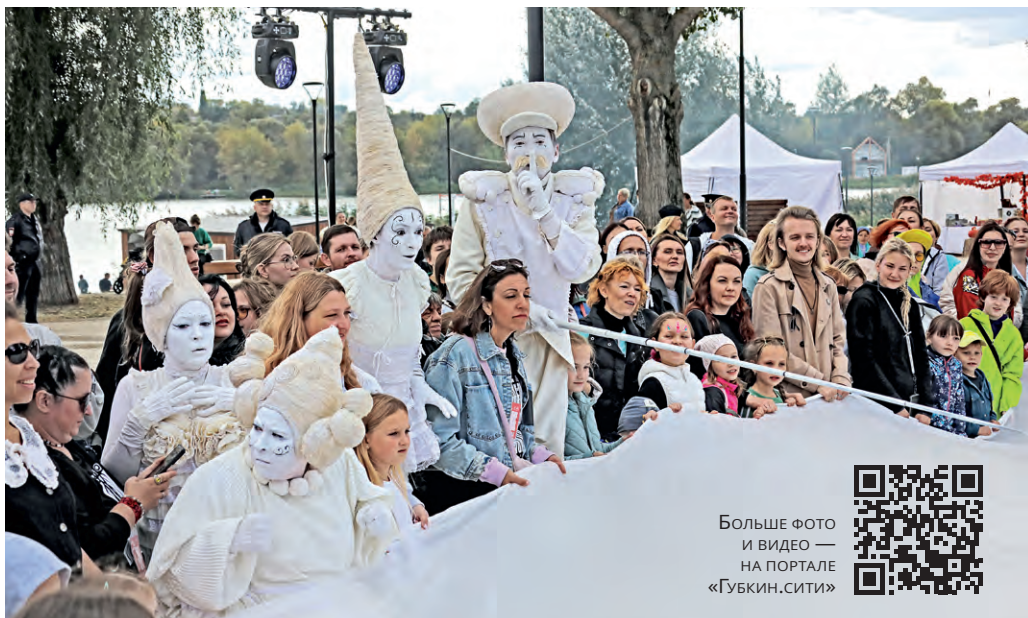
▲ С полудня и до позднего вечера юных и взрослых зрителей развлекали театральные коллективы со всей страны

— Мы хотим показать зрителям, что детские страхи нужно отпускать и жить без них, — рассказывает о задумке режиссёр Александр Лончаков. — Уличный спектакль — это свобода действий, свобода