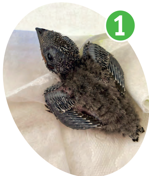
▲ Найденный птенец весил всего 15 граммов...

Если выкормленный в неволе стриж смог взлететь и улететь, скорее всего, он выживет в природе. У этой птицы, как и у большинства пернатых, сильно развиты инстинкты. Первое, что она сделает, — найдёт стаю себе подобных и прильёт к сородичам. Несмотря на то, что стрижа выкормили люди, в природе он разберётся, какой корм ему подходит и как его добывать. В этом смысле птицам проще, чем млекопитающим, у которых есть период одичания. Стриж — интересная птица: в полёте она проводит всю жизнь, даже спит на лету. Стрижи не умеют ходить, а могут лишь повиснуть на некоторое время, зацепившись коготками. Живут в среднем 7-8 лет.