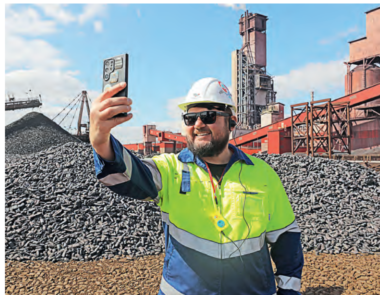
▲ Для сотрудников комбината брикеты ГБЖ — привычная картинка. Для блогеров из столицы — настоящая экзотика