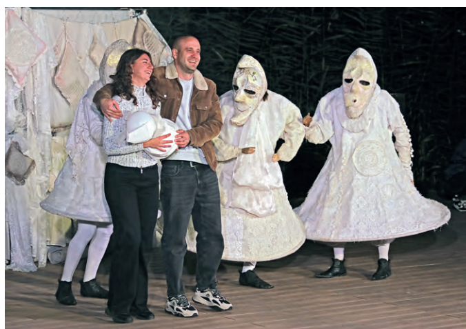
▲ «Странствующие куклы господина Пэжо» подарили зрителям невероятные эмоции. Спектакль без слов заставил публику хохотать до слёз

творчества. Во время выступлений мы импровизируем.