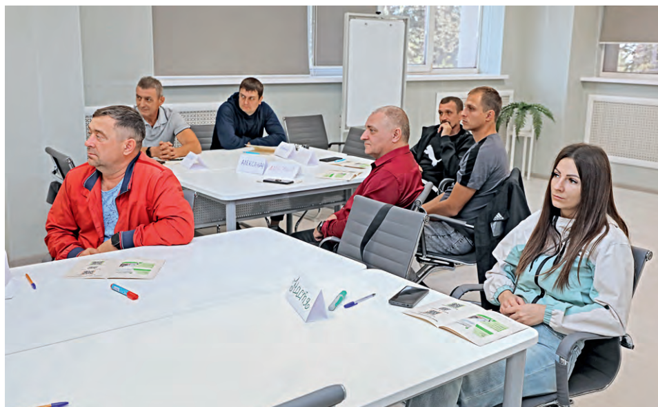
▲ Теоретическую часть курса работники проходят в группах от 10 человек в учебном центре комбината

“При обучении дополнительным профессиям мы исходим из экономической целесообразности. От цеха поступает заявка на определённые специальности — мы предлагаем рабочим пройти подготовку в отделе обучения, оценки и развития персонала комбината или сторонней организации. Сейчас, например, переучиваем путейцев на осматривателей-ремонтников вагонов: эти знания пригодятся зимой. Также есть потребность в стропальщиках, электрогазосварщиках, токарях.