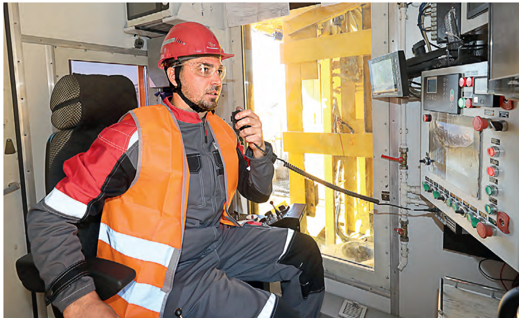
▲ Машинисты довольны: не кабина, а оборудованная маленькая комната!

буровых станков различного типа и производительности включает парк техники буровзрывного управления.