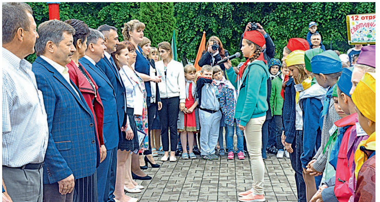
Поздравить девочек и мальчишек с открытием смены собралось множество гостей.