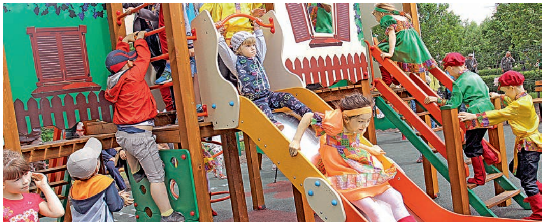
Новая площадка — новые впечатления.