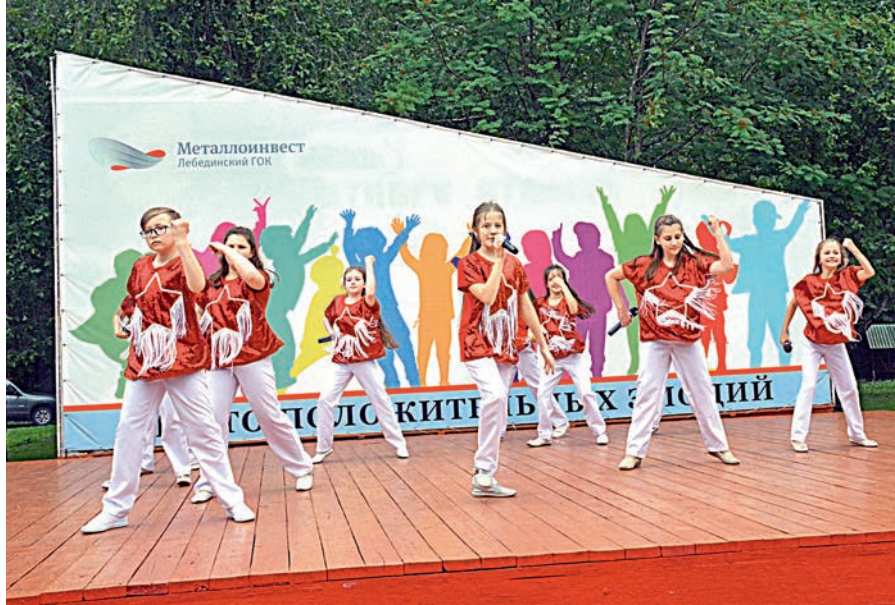
Вместе здорово шагать, веселиться, петь, плясать!