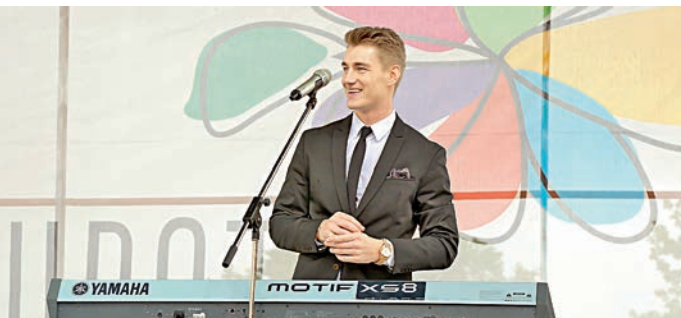
Звёздные гости от души пели для зрителей.

10 июня Старый Оскол встречал музыкальный фестиваль «Раз, два, цвет!», организованный Благотворительным фондом Алишера Усманова «Искусство, наука и спорт».