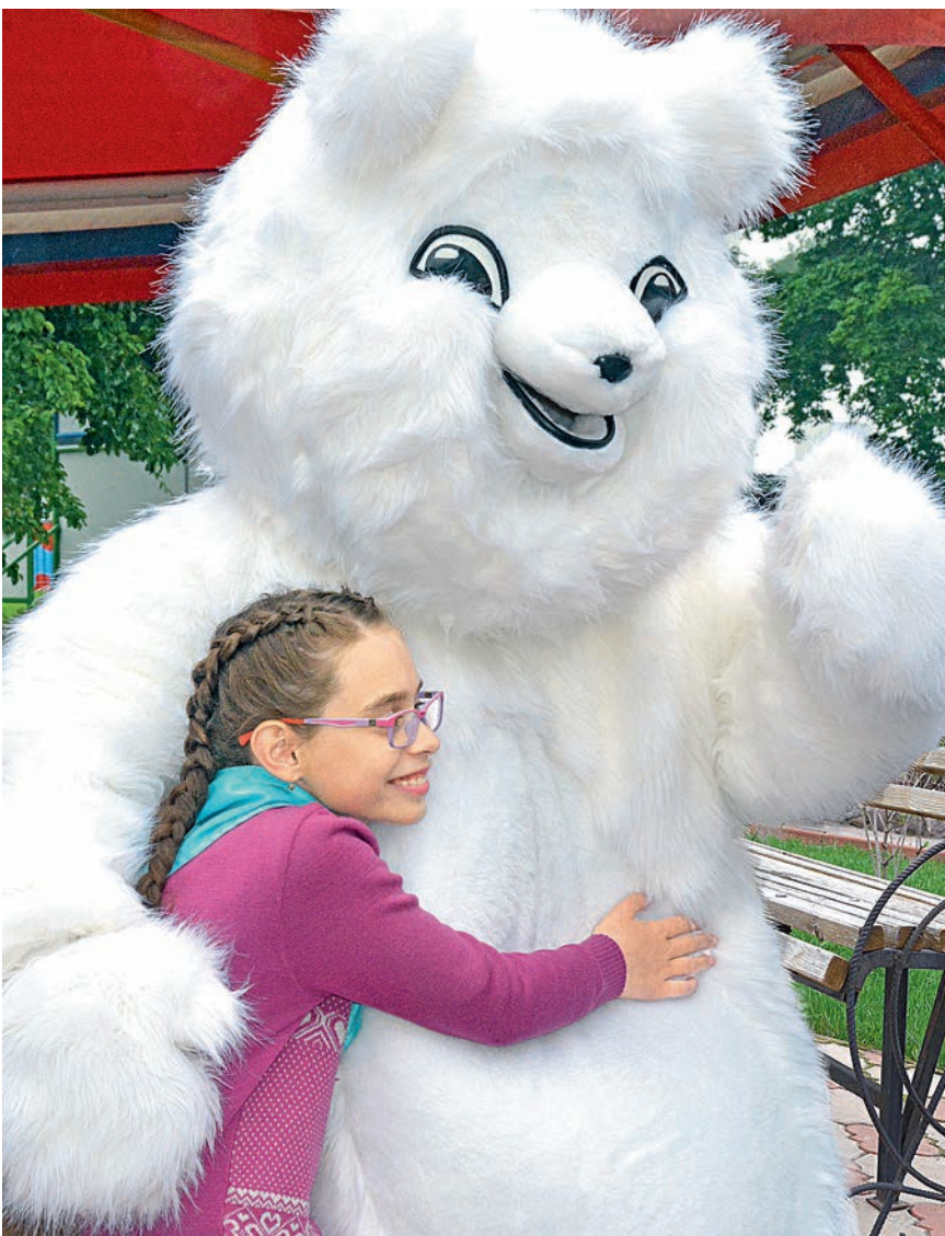
Словно из сказки на праздник прибыли большие сказочные герои.

В первую смену «сказочниками» стали 350 ребят, а всего за лето в оздоровительном комплексе проведут каникулы порядка полутора тысяч девочек и мальчишек от семи до четырнадцати лет.