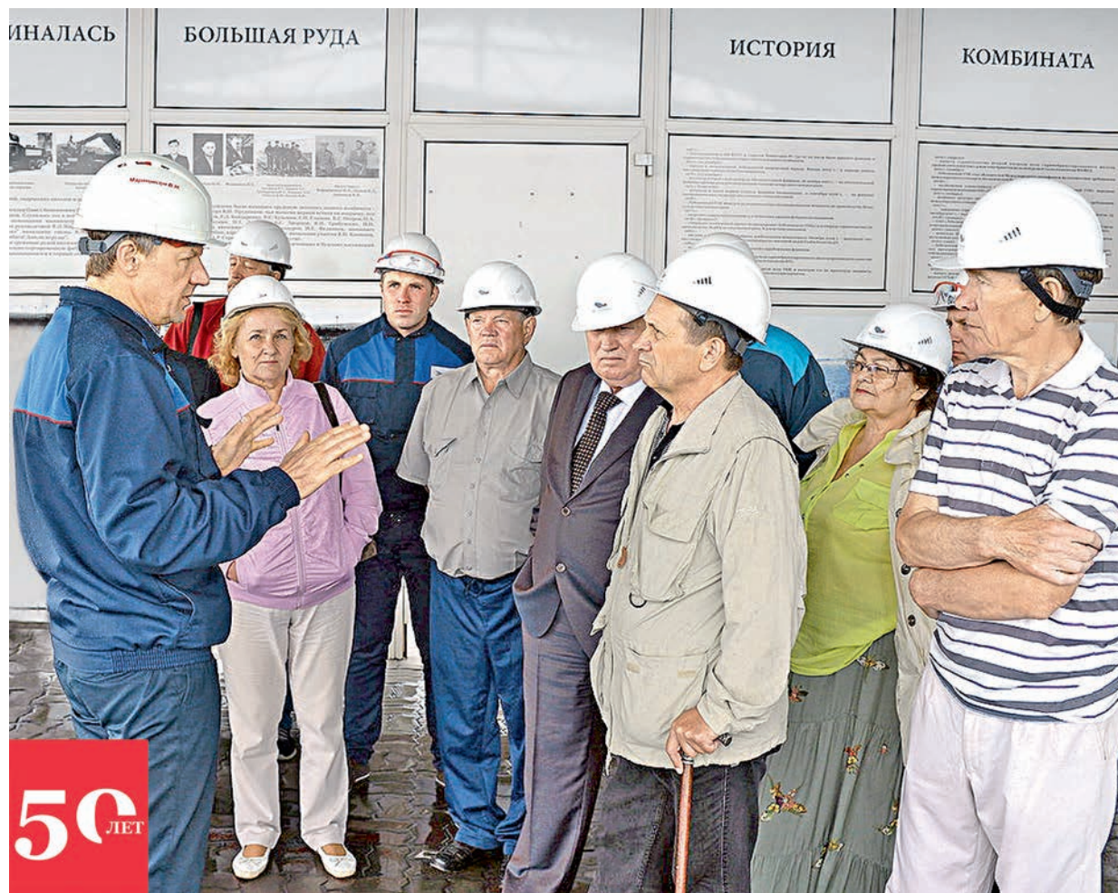
Экскурсия стала замечательным воспоминанием о молодости.

Для тех, кто полвека назад стоял у истоков Лебединского горно-обогатительного комбината, на прошлой неделе была организована экскурсия по комбинату и Губкину.