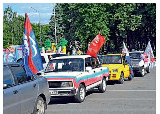
Флешмоб стал настоящей патриотической акцией.

Ульяна Савельева, Екатерина Тюпина