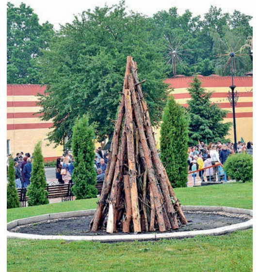
А вечером — костёр «до неба».