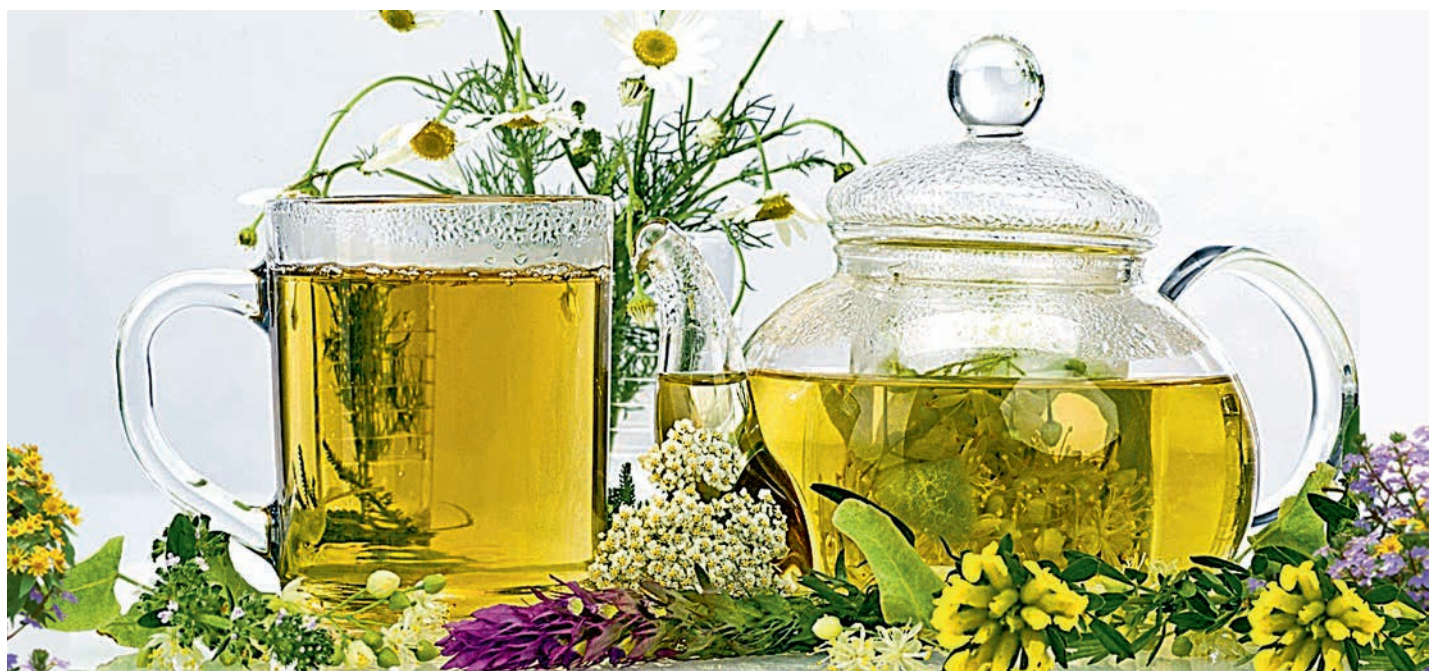
Хорошо заваренный травяной чай необычайно полезен при погодной неустойчивости.