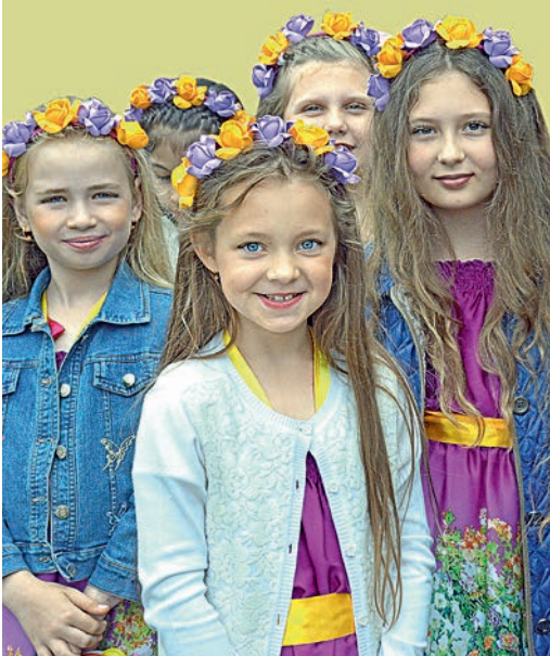
И снова в гостях у «Сказки»!

10 июня в лебединском оздоровительном комплексе «Лесная сказка» состоялось торжественное открытие первой смены детского сезона.