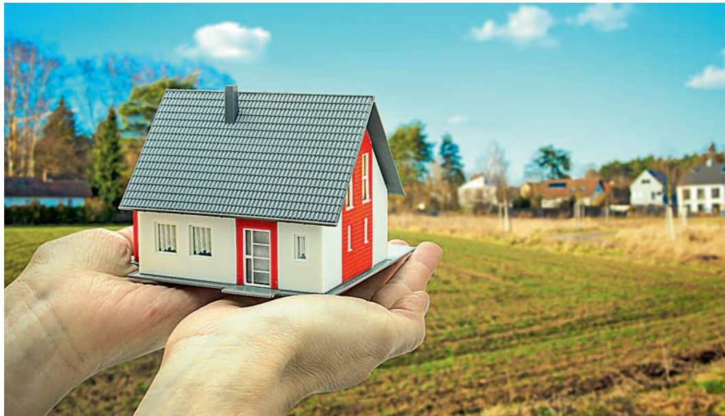
Многие мечтают о собственном доме. Теперь мечта осуществится.

Но это — не единственное приятное новшество. В ближайшие годы, обещает глава региона, в районах ИЖС начнут строить детсады, школы и офисы семейных врачей. А в облдуму будет внесён законопроект о снижении земельного налога в 1,5-2 раза под усадебными домами, владельцы которых — пенсионеры. А в сёлах с населением до 200 человек планируют сдавать в аренду до 1 га земли для усадебной застройки. Причём арендная плата не превысит земельный налог. Ну а после того, как люди возведут дом, участок в собственность им передадут безвозмездно. Более взвешенного и