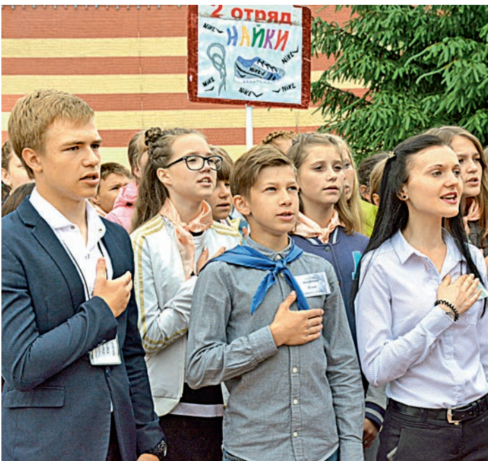
Ребята пели гимн, приложив руки к сердцам.