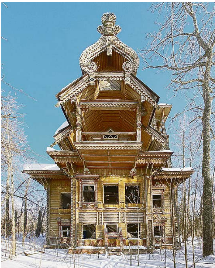
Вот какие «кружевные» чудо-дома делают в Костроме из дерева!

крыше, большое крыльцо — в общем, всё, как полагается, чтобы душа развернулась. Тут бы самобытное название придумать, чтобы всё было органично, но на заведении красуется вывеска «Инь и Янь» с соответствующей китайской символикой. Вот уж и в самом деле и смех, и грех. Тамошние церкви отличаются от привычных нам. Они больше похожи на терема. Такие же расписные, с растительным орнаментом по широченным, но не слишком высоким сводам. Самые известные храмы, символы города — Ипатьевский и Богоявленско-Анастасьинский монастыри. Недаром их посещение входит в программу туров по «Золотому кольцу». Кстати, в Кострому приезжает до полумиллиона туристов ежегодно!