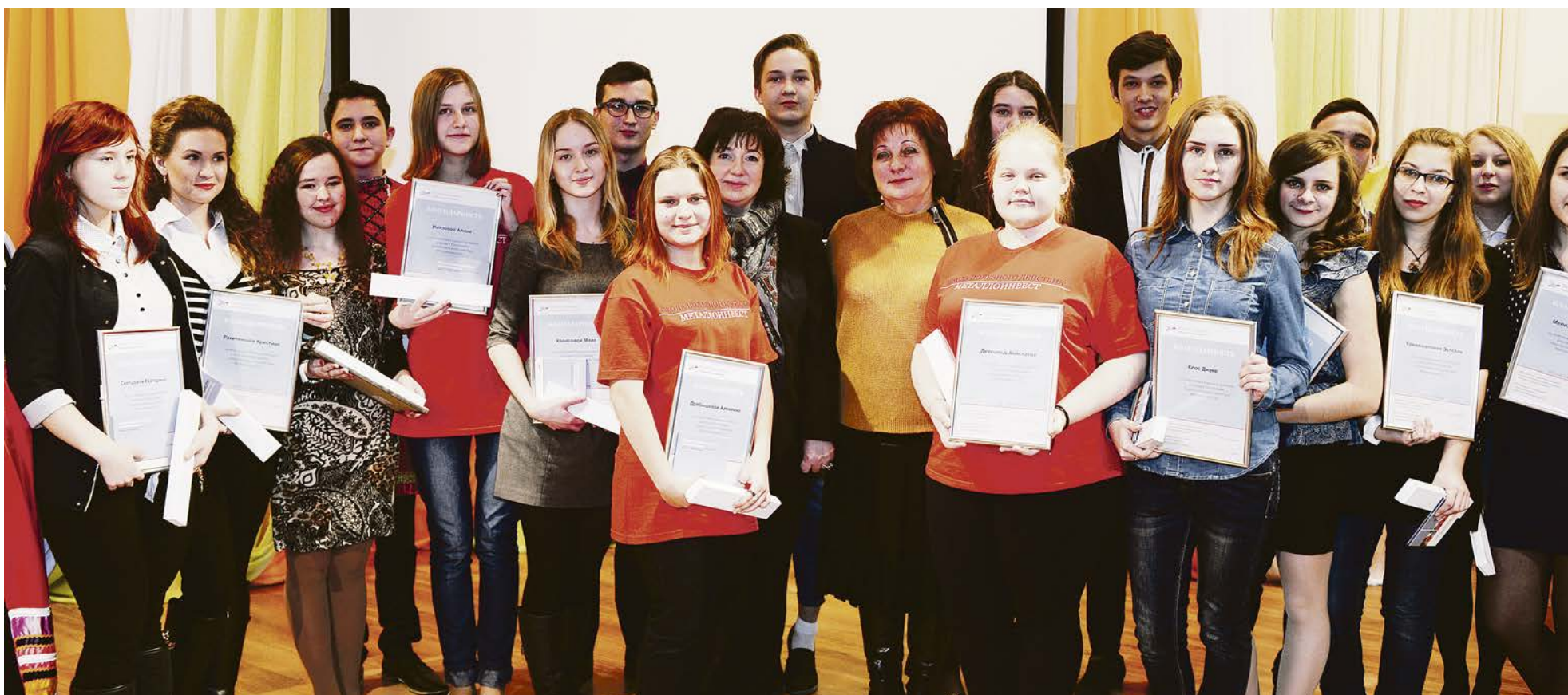
Участники и организаторы проекта настроены на дальнейшие полезные и добрые дела.