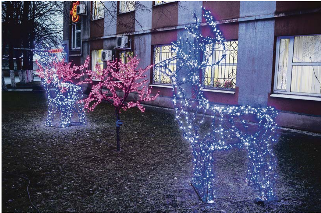
Такую красоту не в каждом городе можно увидеть.