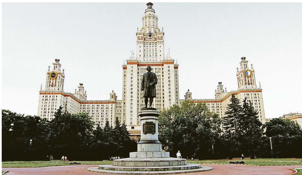
Поступить на бюджет в МГУ можно. Но сложно.

А через год запланировано и стотысячное сокращение бюджетных мест в вузах. В Минобрнауки определили, что в 2017-ом на бюджет смогут попасть 575 тысяч абитуриентов (ежегодно в стране выпускается около 700 тыс. одиннадцатиклассников). Но эти 575 тысяч мест поделат между бакалавриатом, специалитетом, магистратурой, аспирантурой, ординатурой, очным и заочным отделениями. В настоящий же момент на каждые 100 выпускников школ в вузах открыто 56 мест. То есть шансы поступить имеет почти каждый второй. Вообще за 2,5 года сеть