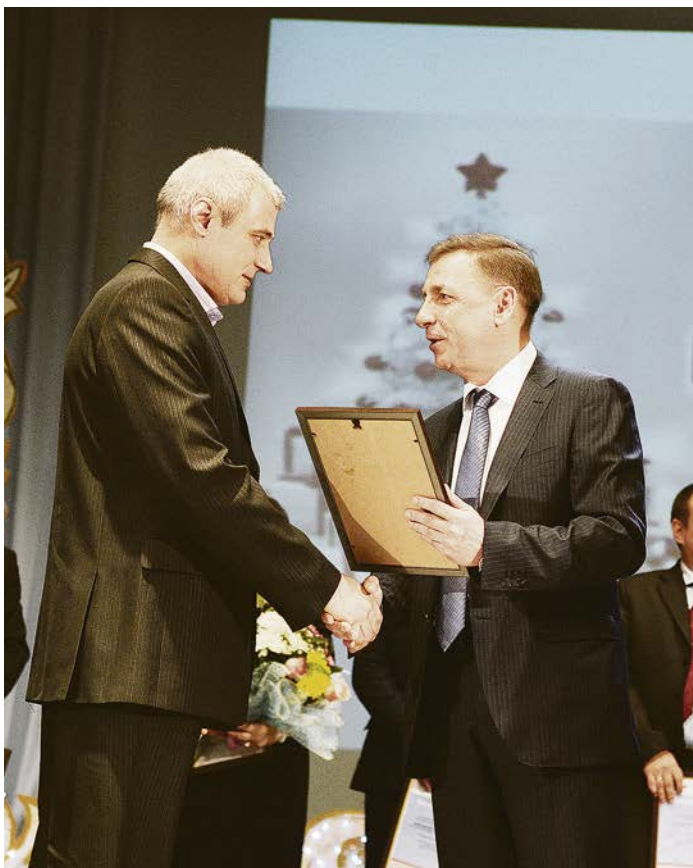
Спасибо за труд!