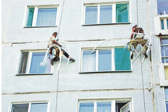
Подрядчикам выгодно ремонтировать наши дома дешево и сердито, а жильцы хотят, чтобы было надёжно.

За капремонтами следят не только энтузиасты-жильцы, но и профессионалы – группа общественного контроля. В неё входят представители Центра общественного контроля в сфере ЖКХ, департамента ЖКХ, местного Фонда содействия реформированию ЖКХ, общественного совета при департаменте ЖКХ, представители муниципалитетов, собственники квартир. Члены группы дважды в неделю выезжают на «место событий». Общие планёрки проводятся