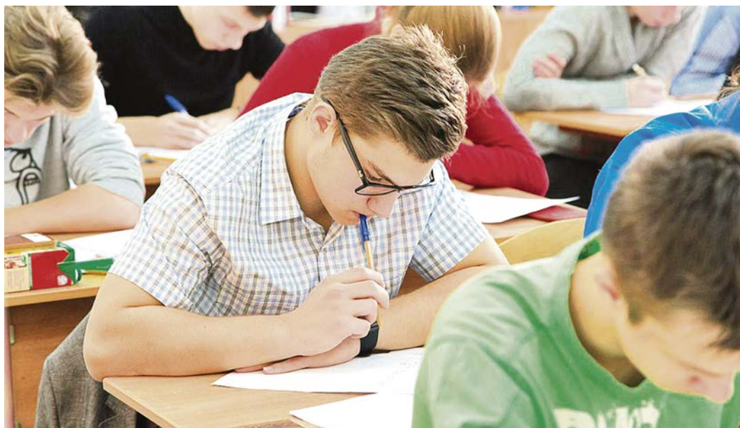
Гранит науки нынче не всем по зубам. То баллов по ЕГЭ не хватает, то денег за обучение.

В этом году профильную математику сдавали 439 тысяч человек. «Профиль» необходим, чтобы поступить на инженерные, математические и экономические факультеты. По данным Рособрнадзора, 15% одиннадцатиклассников не преодолели минимальный порог (27 баллов). Но 128 тысяч выпускников получили 60 баллов и выше. Кстати, высокобалльников на профильной математике в этом году стало больше на 5%. Минимальный порог по русскому языку — 36 баллов. На 80 баллов и выше написали 25% выпускников. В 2015 году таких было 20%. С одной стороны радуется, что умников и умниц стало больше. Но с другой, проходной балл в вузы может вырасти. Впрочем, у многих престижных вузов планка и так выше уровня, определённого