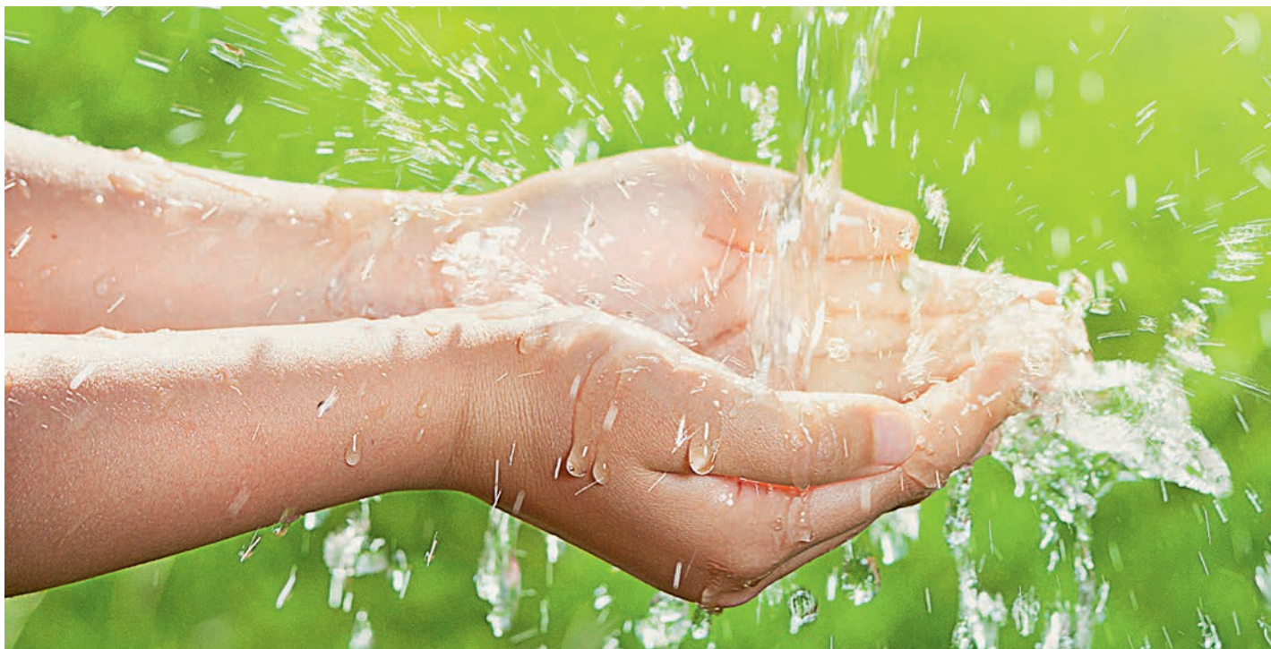
Как копейка рубль бережёт, так и капля воды сохраняет море и финансы пользователей.