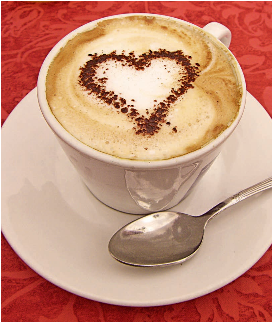
Раньше искусством считалось умение варить кофе, теперь — и украшать.

Известно, что русский царь-реформатор Пётр Первый был большим охотником «кофею откусать». Хотя в отечестве нашем долгое время питьё из молотых зёрен считали лекарством от мигрени и ряда других заболеваний. Действительно, кофеин, содержащийся в зёрнах, усиливает влияние некоторых болеутоляющих, особенно — аспирина и парацетамола. А первое кофейное заведение на Руси открылось в 1703 году. Но предлагаемый там ассортимент несколько отличался. Судите сами: вот рецепт тех дней (из кулинарной книги 1844 года): для приготовления кофе необходимо взять столовую ложку порошка, добавить в пол-литра кипятка, кипятить 20-25 минут. Оставить настояться 4-5 минут. Стандартно?