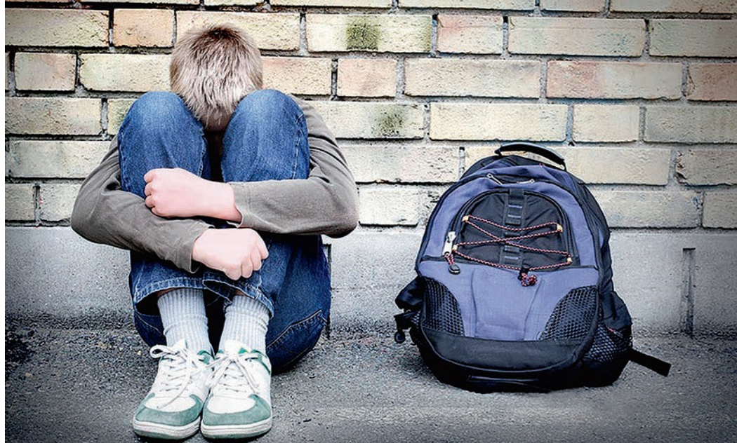
«Близкие, семья, друзья — это те люди, которые первыми должны бить тревогу, заметив в поведении подростка суицидальные наклонности, — уверяют психологи. — На практике бывает как раз наоборот: именно для родителей и ближайшего окружения попытка ребёнка наложить на себя руки становится неожиданным потрясением. А ведь в подавляющем числе случаев подросток так или иначе заявляет о своих намерениях».

— Безусловно. Когда семья для ребёнка — крепость, в которой он может пересидеть кризисную ситуацию, получить эмоциональный ресурс, то мысли о суициде, если даже и возникнут, быстро уйдут. Если же такого ресурса в семье нет, может запуститься негативный механизм: ребёнок