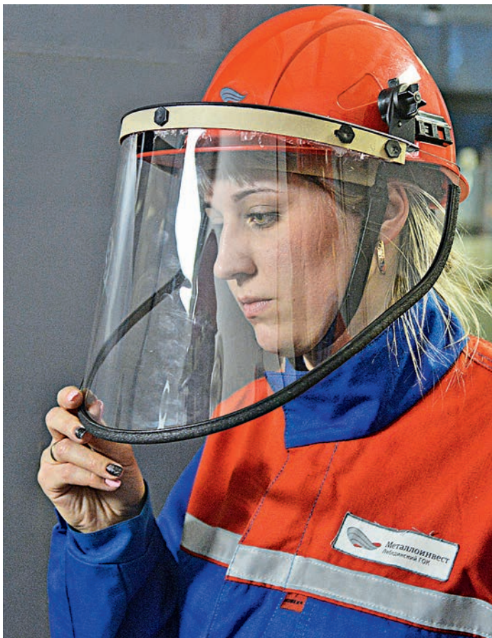
Так сложилось, что в дружном коллективе «подстанционных смотрителей» больше женщин.

Во внутреннем этапе корпоративного конкурса профессионального мастерства звание лучшего электромонтёра по обслуживанию подстанций Лебединского ГОКа отстаивали десять человек. Те, кто по праву считается лучшими по профессии, кто ежедневно и ежечасно помогает «светить всегда, светить везде», кто одинаково хорошо справляется с теоретическими вопросами и практическими задачами. Так сложилось, что в дружном коллективе лебединских «подстанционных смотрителей» больше женщин. Поэтому и участниц внутреннего отборочного этапа было больше, чем участников. Сначала конкурсанты продемонстрировали профессиональные знания в теории. После перешли к