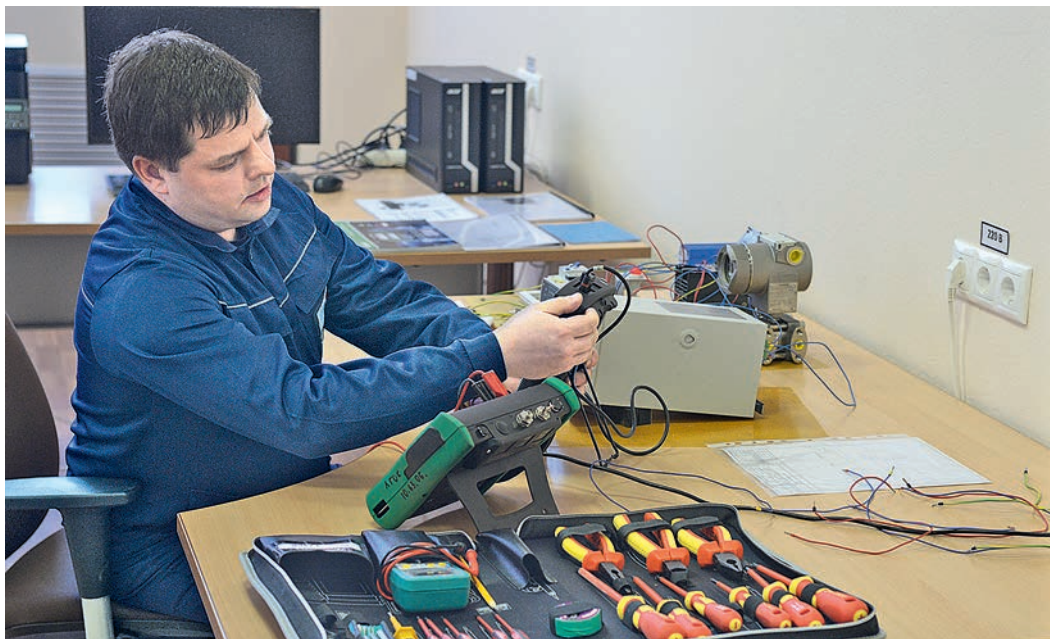
При сборке схемы и наладке приборов учитывались скорость и точность действий каждого участника конкурса.

В практической части конкурса, которая прошла в учебном классе ДИТ, слесарям предстояло за отведённое время собрать схему измерения, отображения и сигнализации технологических параметров — температуры и давления.