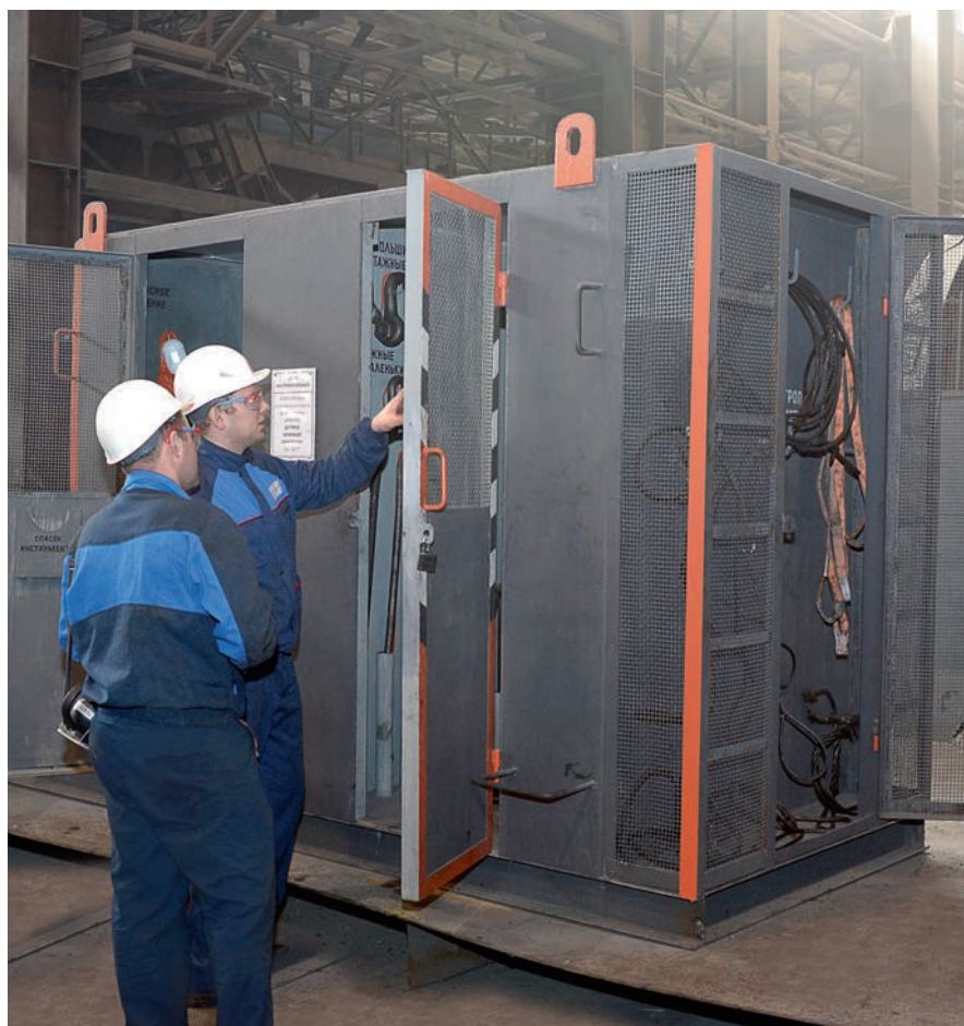
При проведении картографирования учитываются все детали.

Используя лучший мировой опыт в области бережливого производства, компания «Металлоинвест» активно внедряет Производственную Систему.