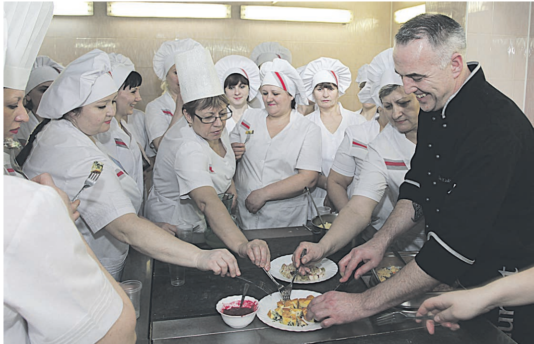
Девиз шеф-повара: «Ну кухне кричать возбраняется!».

– Это просто энергетический толчок, – улыбается шеф-повар, – ведь в грибах содержится в два раза больше белка, чем в мясе, и в три