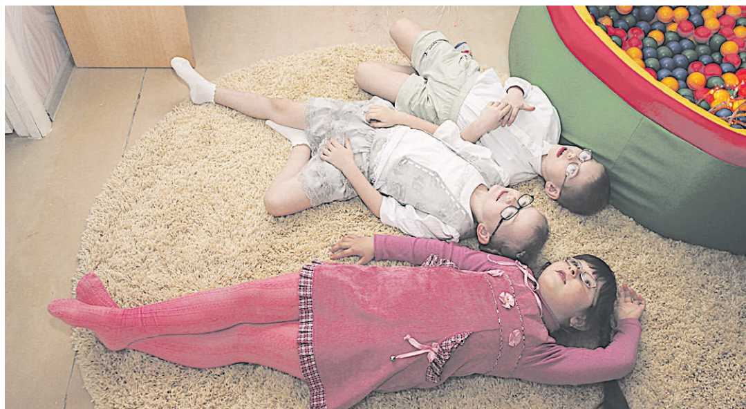
Когда здоровье в порядке, хорошо и детям, и родителям.

Говоря о проблемах детства, взрослые участники круглого