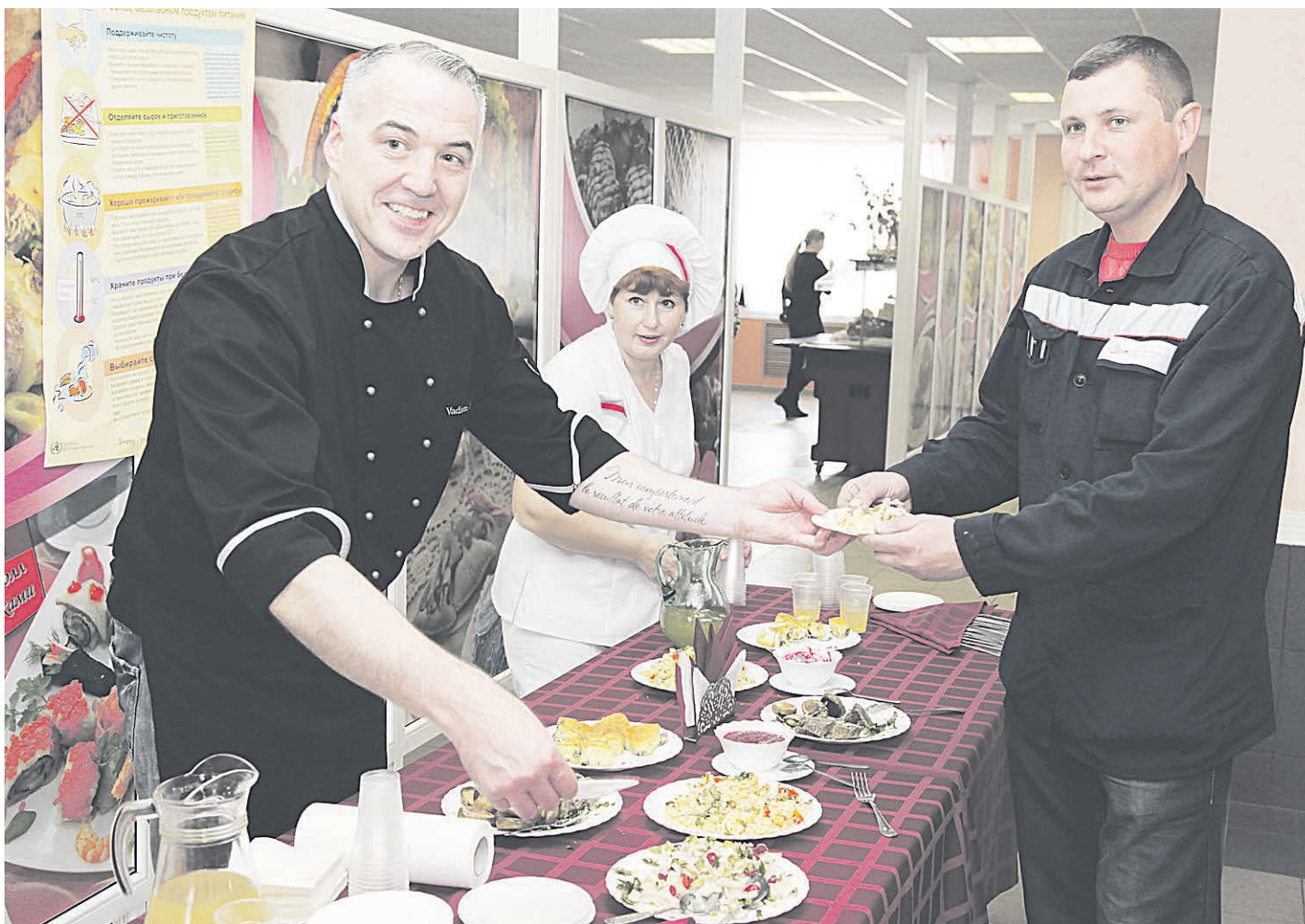
Лебединцы пробовали с удовольствием, расспрашивали – с интересом.

В рамках Всемирного дня здоровья 7 апреля на всех предприятиях компании «Металлоинвест» прошли народные дегустации блюд, соответствующих принципам здоровой кухни, и мастер-классы для поваров и технологов пищевого производства.