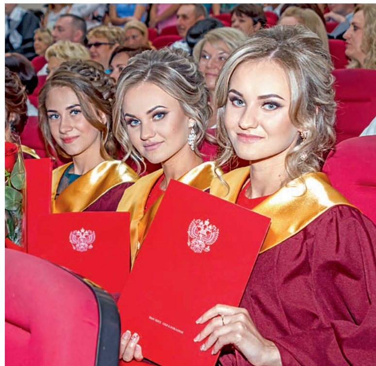
Выпускницы инженерно-экономического факультета.

В этот же день дипломы о высшем образовании получили 218 выпускников заочной формы обучения, 69 их них окончили горный факультет. Как правило, заочное образование получают люди уже работающие на предприятиях. Так и есть: большинство заочников СТИ НИТУ «МИСиС» — жители Губкинского городского округа и работники крупнейших в регионе горнодо-