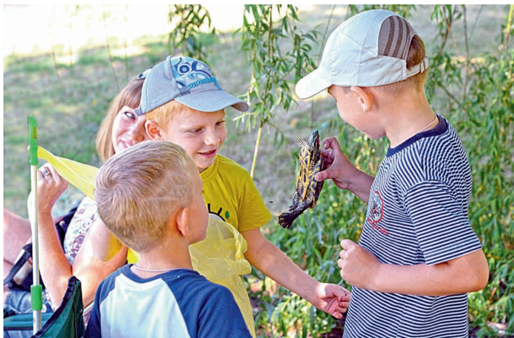
Подфартило: на крючке... черепаха Тортила!

Елизавета Шатохина