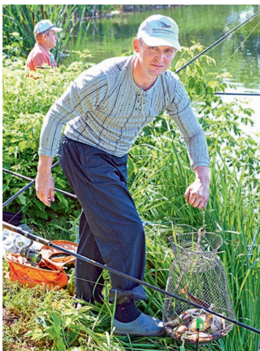
Не место красит рыбака, а рыбак место!

— Ловится двумя удильниками: неважно, фидерная или поплавочная снасть. На каждом удильнике может быть три крючка. Наживка любая, приманка любая: искусственная или натуральная. Запрещается только блеснение, — пояснил главный судья соревнований Юрий Романов. Места, на которых рыбаки