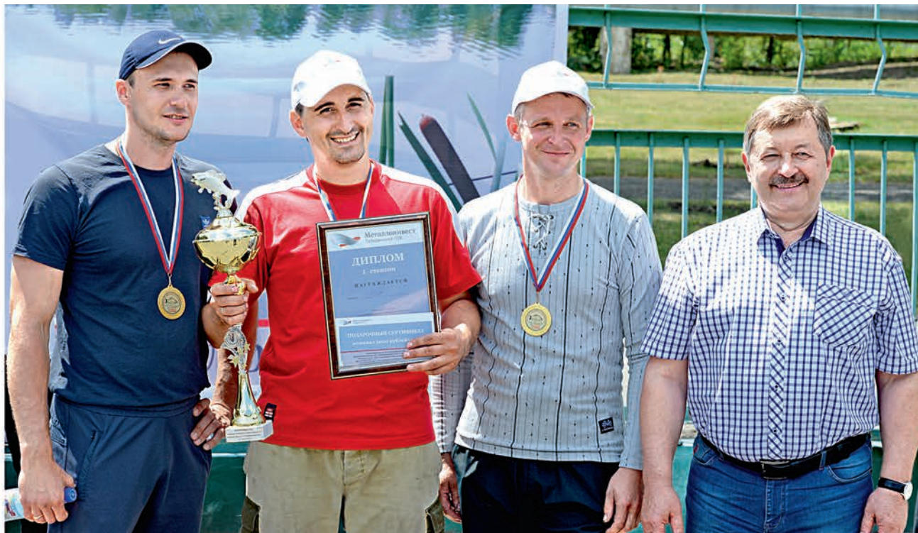
Богатый улов у чемпионов — обогатителей.

У миротворённая тишина и спокойствие водной глади... Это только на первый взгляд кажется, что спортивная рыбалка — занятие не для азартных. На деле это не так: начиная с семи утра, лебединцы стояли с удочками без перерыва в течение четырёх часов. Цель — обойти соперников и наполнить свой садок до краёв, выудить самую большую рыбку.