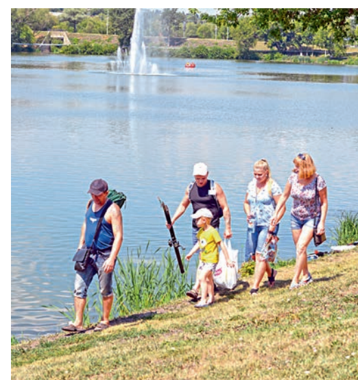
Рыбалка — дело клёвое.