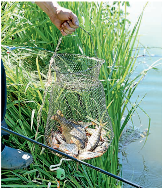
Мал плавничок, да дорог.

В День рыбака, 7 июля, на центральном водоёме Губкина в шестой раз прошёл турнир по летней рыбной ловле среди работников Лебединского ГОКа и дочерних обществ.