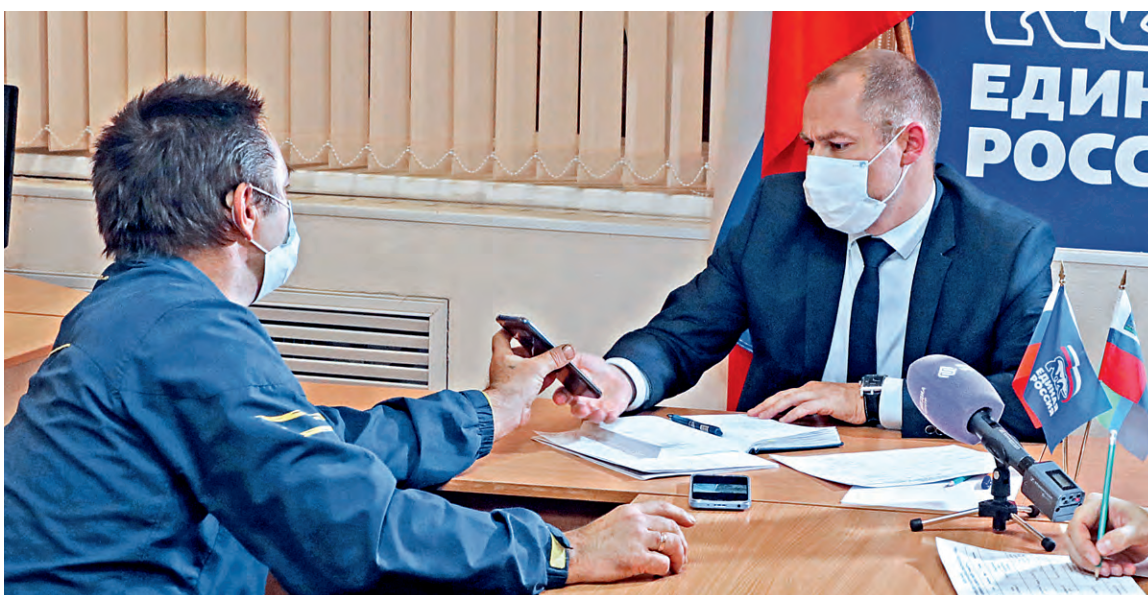
▲ Горожане не только рассказывают, но и показывают депутату «болевы точки» территории, например, некачественное благоустройство

— Первая наша проблема в том, что в месте, где улицы Бубнова и Революционная примыкают к микрорайону Лебеди, проложили тротуарную дорожку, но, как говорится, «не довели до ума». Пешеходную зону не отгородили. Вокруг оставили большие насыпи земли, которые при первом силь-