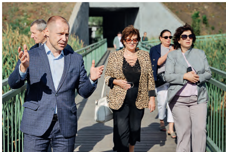
▲ В Губкине эксперты прогулялись по территории долины ручья Тёплый Колодезь и Парку Детства

Оба города гармонично развиты по всем сферам качества жизни и по различным категориям получили оценки выше среднего.