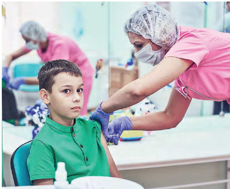
▲ Медики рекомендуют прививать детей: для них грипп наиболее опасен

Вакцинацией мы победили оспу и чуму. Сто лет назад на мир обрушилась разновидность гриппа — «испанка». Заразила 40 % населения планеты, выкосила 100 миллионов человек! Затем изобрели вакцину, и уже в конце 1950-х, когда бушевал гонконгский грипп, смертность снизилась до миллиона. Птичий грипп унёс жизни полумиллиона человек. Это огромная цифра, но в двести раз меньше, чем последствия «испанки». Сегодня