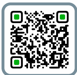
RuStore для Android