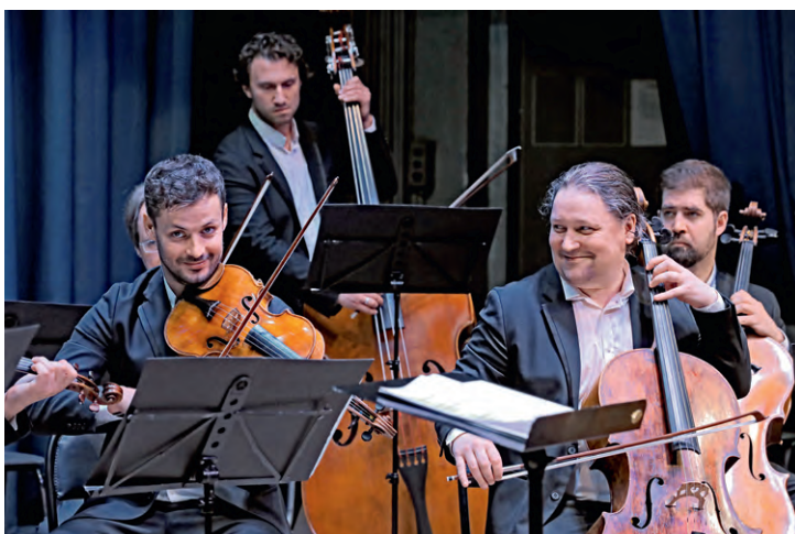
▲ Московские артисты сыграли как широко известные, так и забытые произведения мировых классиков

кестровой музыки и её исполнения они оказали решающее влияние на становление классицизма. Поэтому я включил их произведения в программу, —