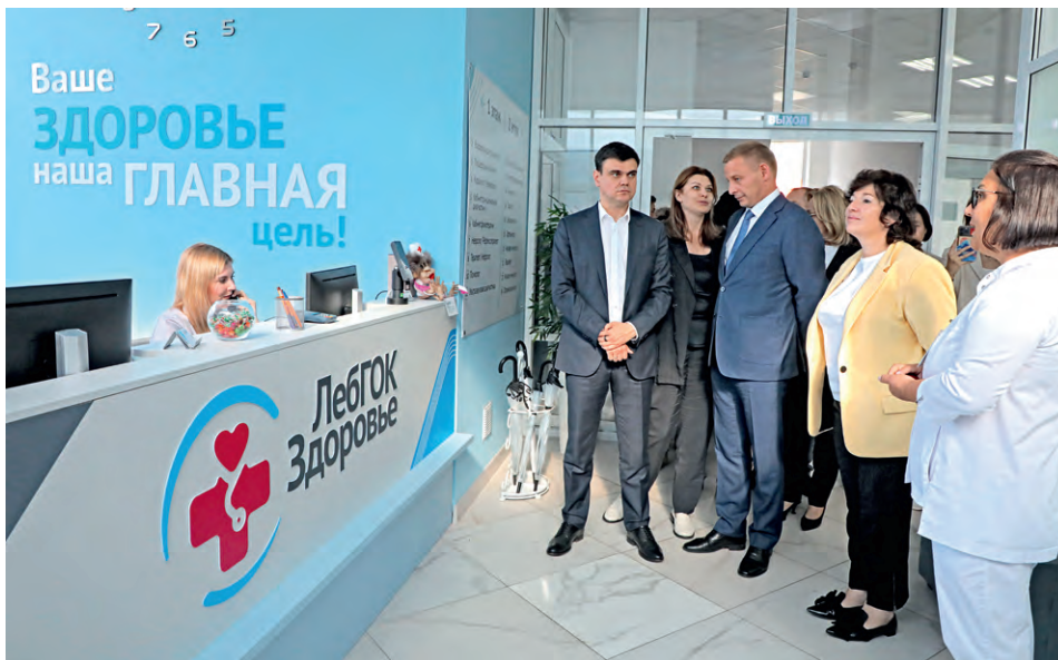
▲ Новый центр уже работает