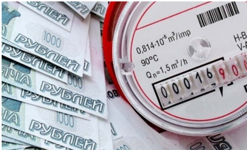
Коммуналка в новом году снова подорожает, зато можно сэкономить на штрафах ГИБДД.

Э мбарго на товары из Турции и Украины, запрет на наёмный труд, «замороженная» накопительная часть пенсии — какие ещё новшества ждут россиян в наступившем году? — 29 февраля 2016 года заканчивается бесплатная приватизация жилья. — К весне в 23 регионах собственники жилья получат квитанции об уплате налога на недвижимость, исходя из кадастровой, то есть рыночной, стоимости. А к 2020 году на новые правила перейдёт вся страна. — С нового года для тех, кто не платит за коммуналку больше трёх месяцев, пени вырастут более чем вдвое. С 31 по 90 дней просрочки пеня составит примерно 10% к сумме долга в годовом исчислении, а с 91-го дня просрочки — 23%. — С 2016 года в квитанции за ЖКХ появится строчка «Плата за обращение с твёрдыми коммунальными отходами». — С 1 января при отсутствии индивидуальных или общедомовых счётчиков нормативы потребления коммунальных услуг будут определяться с учётом повышающего коэффициента 1,4. — С 1 января регионы, если захотят, могут компенсировать расходы по оплате капремонта одиноко проживающим неработающим пенсионерам-собственникам старше 80 лет (100%) и старше 70 лет (50%). Размер компенсации будут рассчитывать по формуле «минимальный взнос за 1 кв.м площади, установленный в регионе, помноженный на региональный стандарт нормативной площади жилого помещения». К примеру, в Москве на