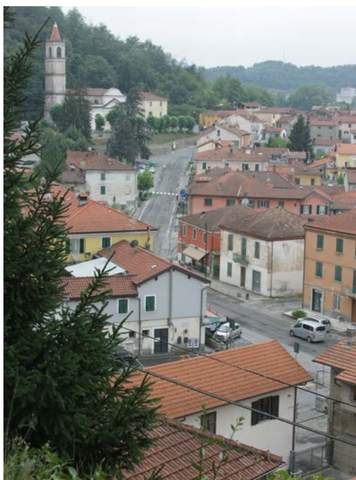
Дего - город из табакерки.