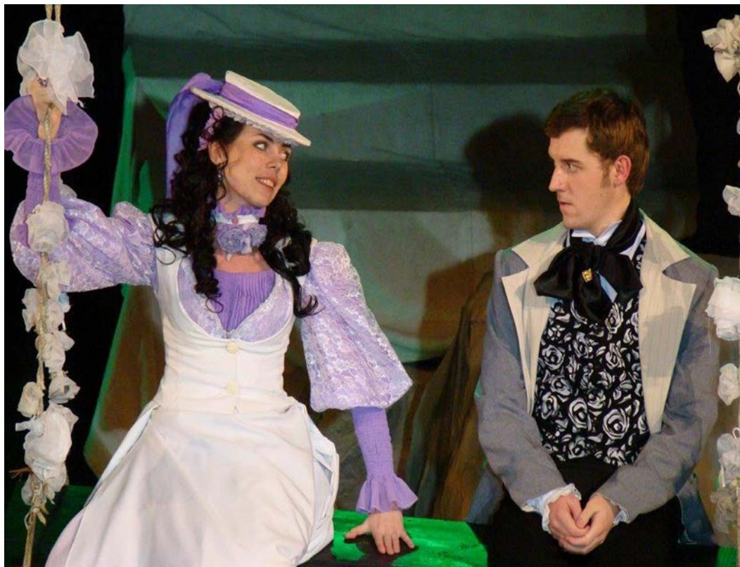
Каждой премьеры СТДиМ старооскольские театралы ждут с нетерпением.