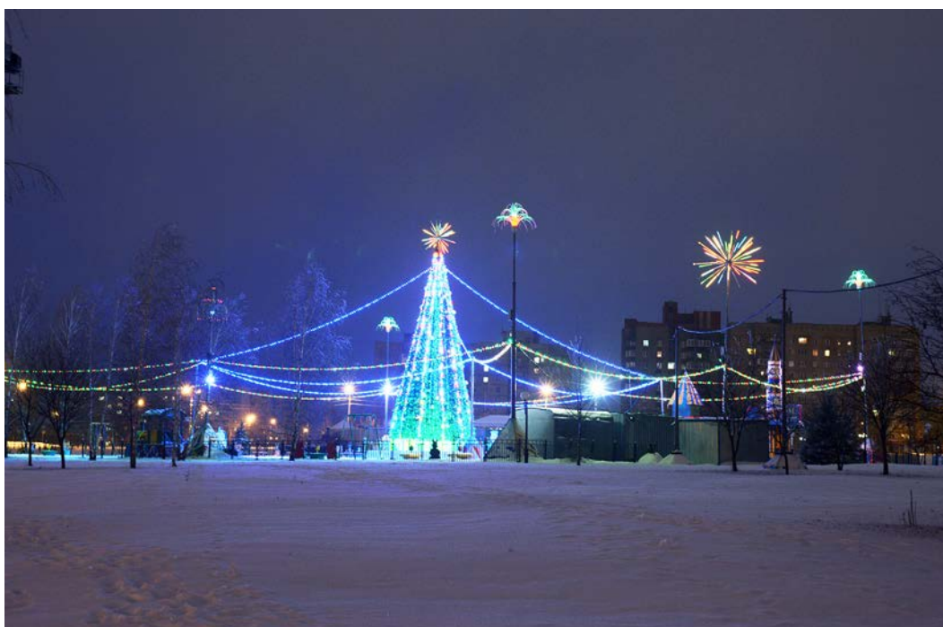
Яркие огни города.