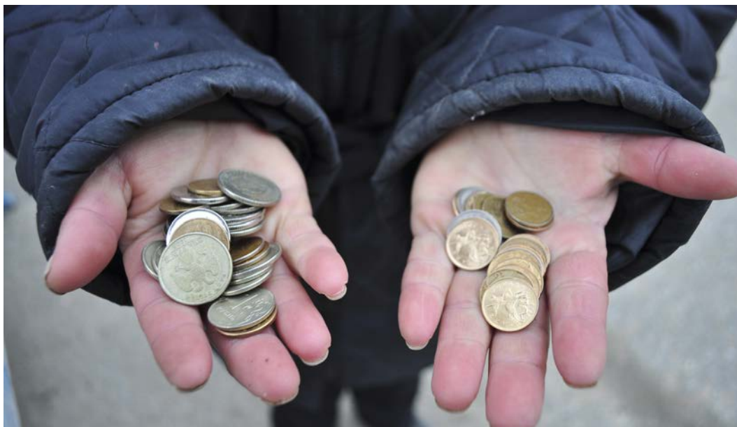
Затянуть пояса в наступившем году придётся многим россиянам