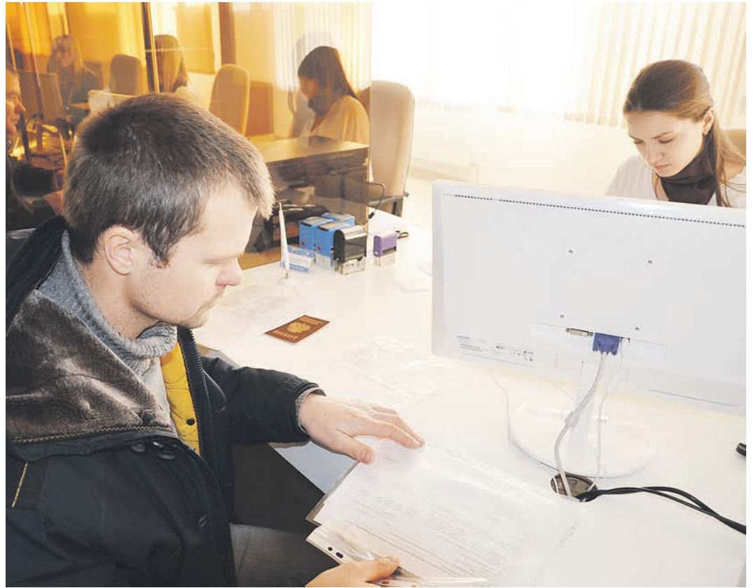
Новый МФЦ готов принять всех.

Под МФЦ в Старом Осколе было выбрано здание по адресу: мкр. Жукова, д. 37. В течение нескольких месяцев там шла реконструкция, на которую ушло 40 миллионов рублей из фонда «Любимый город». Необходимое оборудование и мебель приобрели за счет федерального и областного бюджетов. На это затрачено ещё 25 миллиона рублей. В МФЦ созданы два больших зала, в которых оказывают 82 услуги населению в 52 окнах. — 52 окна — это немало. По сути, у нас будет один из самых крупных МФЦ в Белгородской области. Помимо окон созданы комфортные залы информирования и ожидания, — прокомментировал директор МУЧ «Старооскольский центр «Одно