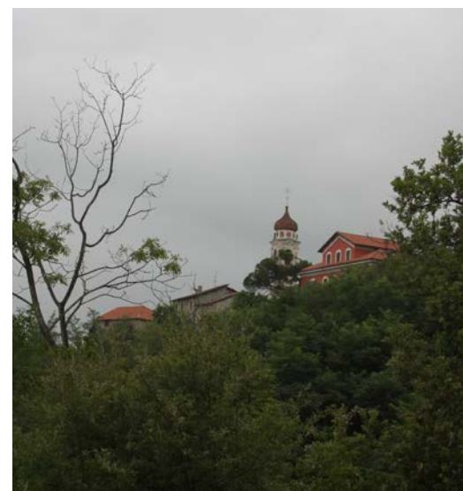
Бьют часы на старой башне...