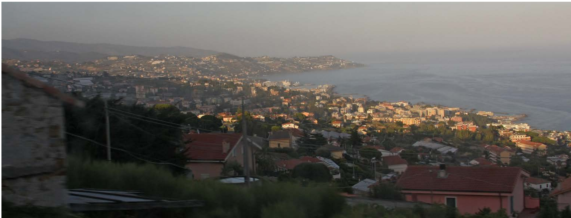
Сан-Ремо. Лигурийское море.

Все дороги ведут в Рим - гласит старая итальянская поговорка. А вот моё знакомство с туристической меккой началось с миниатюрного городка Дего на севере страны.