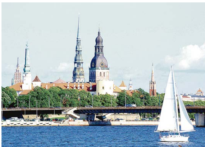
...и днём. И на суше, и на воде.

Здесь, как в другом мире: сделал шаг – «споткнулся» о легенду. Само возникновение города овеяно сказом о Большом Кристопе. Дескать, жил в незапамятные времена богатырь, что людей на себе через реку переплавлял и лодки, опрокинувшиеся в шторм, вручную обратно переворачивал. И в одно из таких ненастий подобрал силач младенца и пригрел. А наутро вместо спасённого малыша обнаружил большой сундук с монетами. На них и была построена Рига. Точнее, строительство было начато, ведь (по другой легенде) существует древнее пророчество: как только рижане свой город достроят полностью и объявят об этом, он тотчас же уйдёт под воду... Потому на вопрос: «Достроена ли уже столица?» – латыши решительно отвечают: «Нет!»