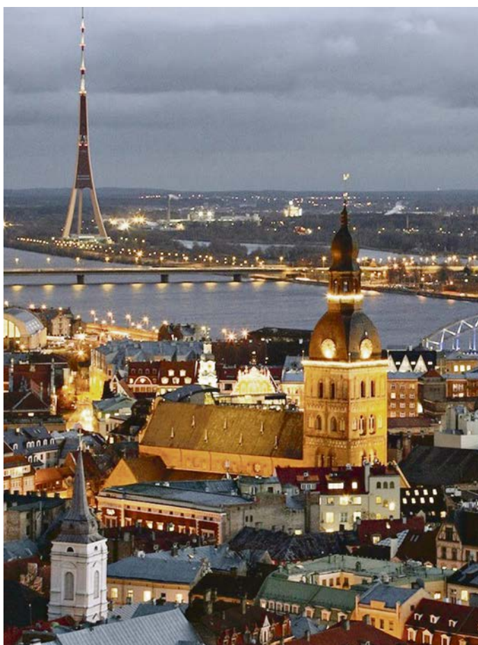
Столица Латвии сияет и ночью...