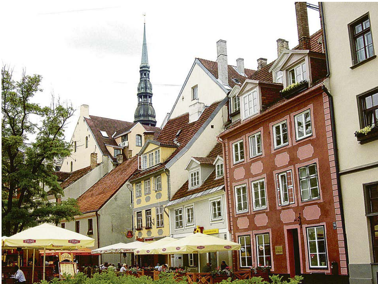
Каждая из улочек и площадей манит и тех, кто здесь живёт, и тех, кто путешествует.

По легенде, этот город никогда не достроится: с последним уложенным кирпичиком он просто уйдёт под воду. В реальности этот мегаполис является самым большим городом на Балтийском побережье. И сказочно красивым. Конечно, речь идёт о Риге.