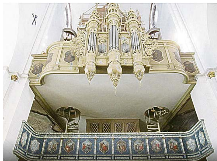
Орган Домского собора приезжают послушать со всего света.