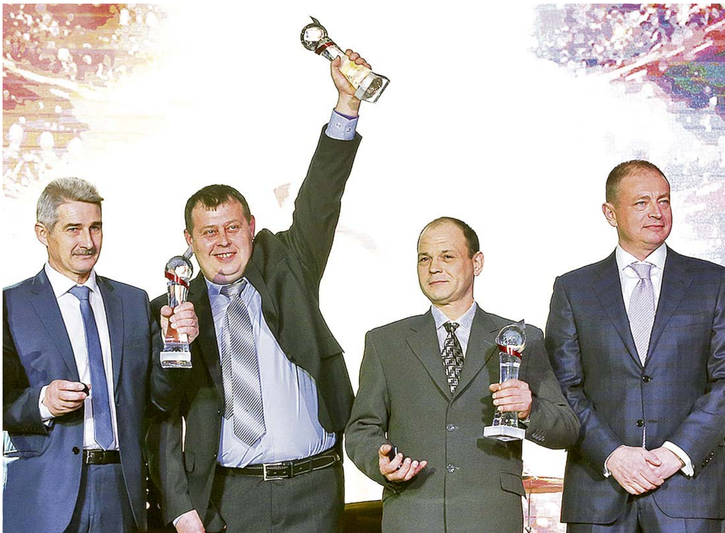
Вручение награды «Человек года Металлоинвест» в 2015 году.

С 15 августа на всех предприятиях компании «Металлоинвест» введено в действие новое Положение о наградной деятельности.