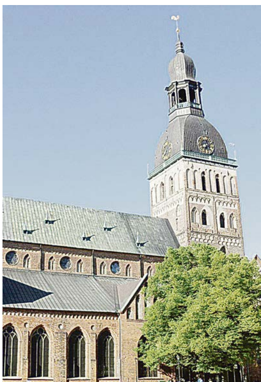
Домский собор латыши считают сердцем старой Риги.