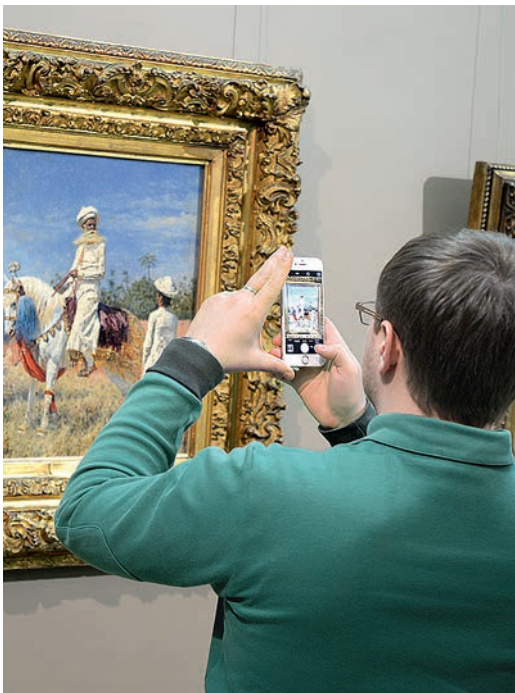
Такая красота, что хочется запечатлеть!

— Выставка из Государственной Третьяковской галереи «От реализма — к импрессионизму» — четвёртый проект,