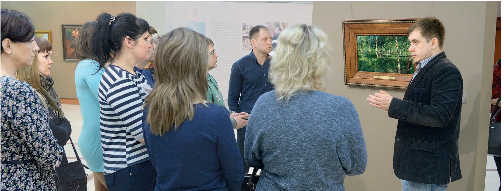
Экскурсовод подробно рассказал об истории создания каждого шедевра.

Благодаря Металлоинвесту губкинцы побывали в Белгородском художественном музее на выставке шедевров русской живописи из Третьяковской галереи.