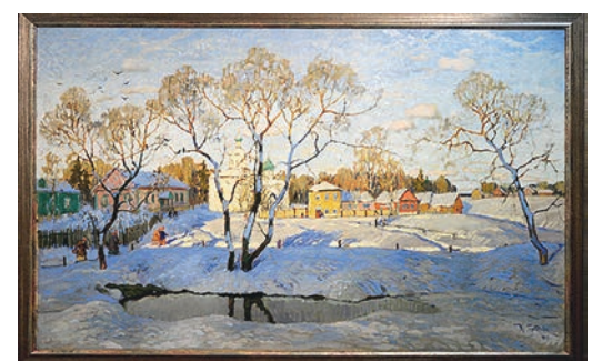
Картины напоминают о чём-то душевном, близком...