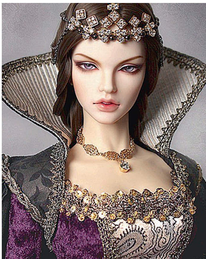
Тематика образов и нарядов кукол БЖД весьма обширна.

первые ящики, в которых паяцы жили и из которых выглядывали во время представлений. Впоследствии бродячие артисты вплоть до XIX века, пока не появились специальные помещения для спектаклей, ходили с этими ящиками по городским площадям и улицам, развлекавая народ. Они создавали импровизированную сцену и рассказывали людям захватывающие истории о борьбе добра со злом, используя сказочные и религиозные сюжеты.