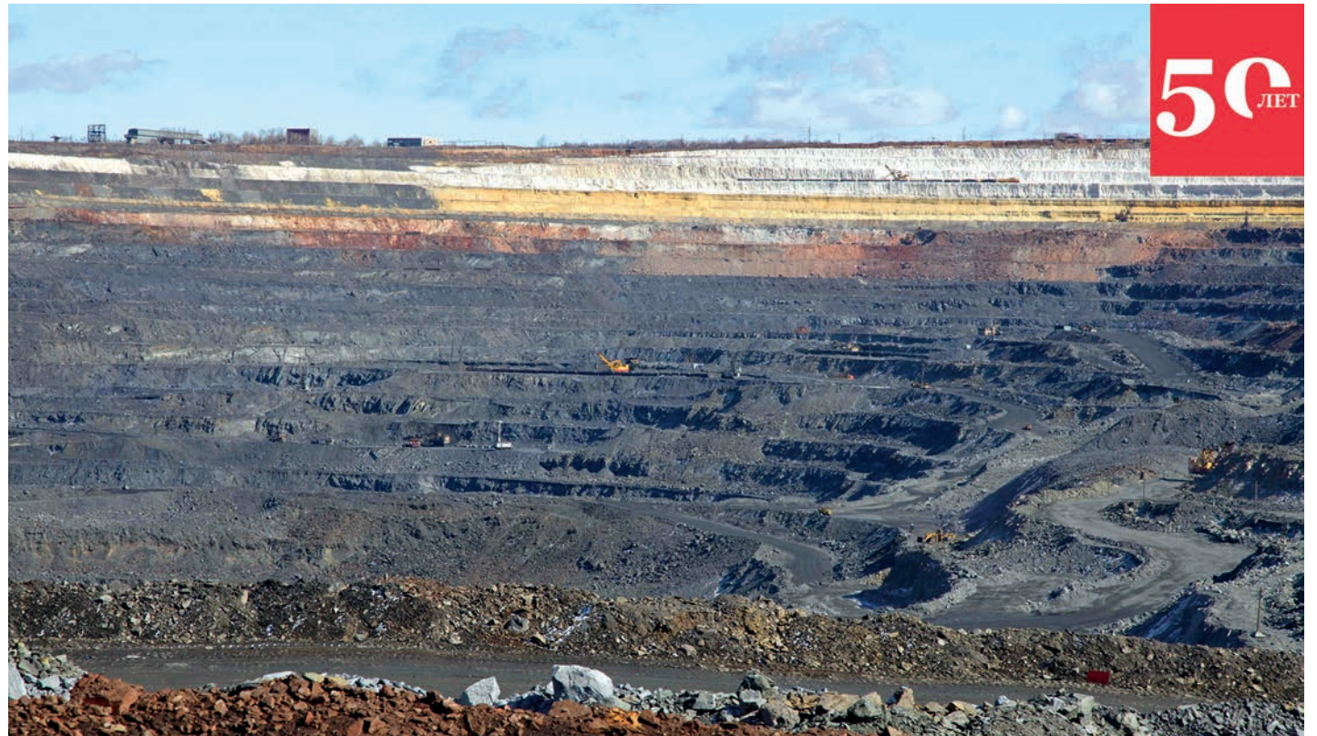
Лебединский карьер сегодня — один из самых масштабных в мире.