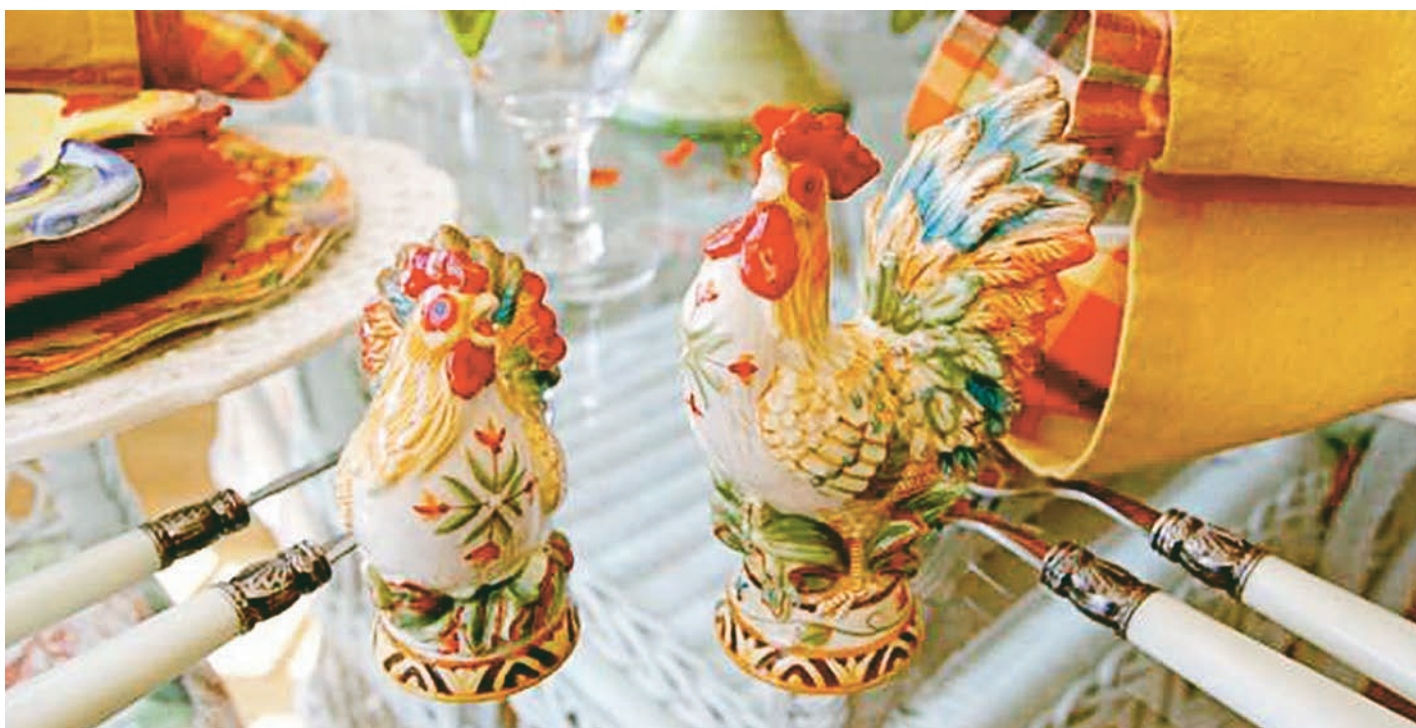
У символа года своё место на столе – в центре или рядом с главным блюдом.