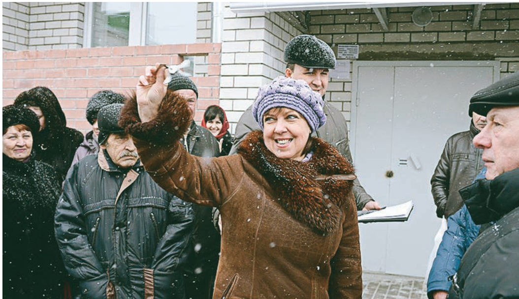
105 губкинцев положительно решили такой важный вопрос, как квартирный.