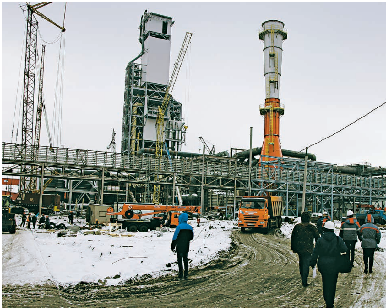
В целом готовность объектов третьей очереди завода горячебрикетированного железа достаточно велика.

Передовые технологии, высокие темпы, первоклассное качество — на стройплощадке главного инвестиционного проекта компании «Металлоинвест» — ЦГБЖ-3 Лебединского ГОКа ведутся работы по наладке основного технологического оборудования.