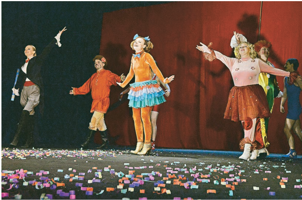
История Каштанки на новый лад всё равно осталась такой же доброй и весёлой.