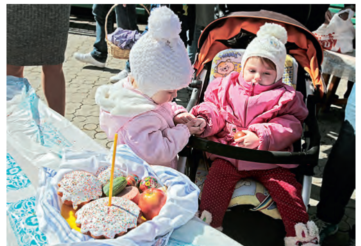
Праздник встречали и стар, и млад.