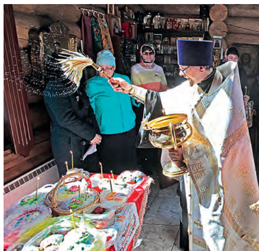
Служба в храме-часовне на Лебединском ГОКе.