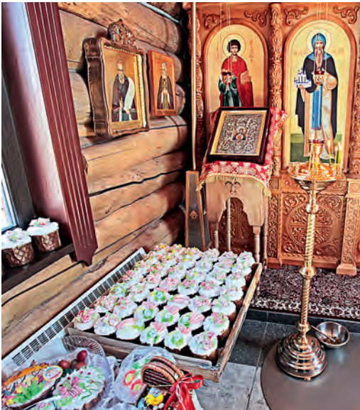
Приготовление к главному празднику года.

Православные жители города горняков встретили Светлую Пасху. Тысячи губкинцев пришли в храмы, чтобы разделить друг с другом радость Христова Воскресения.