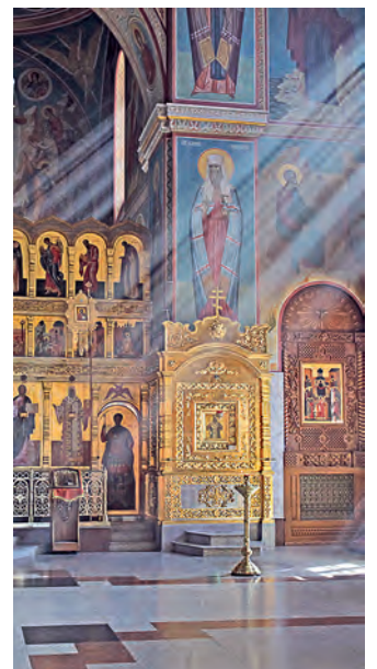
В храме — особый свет.