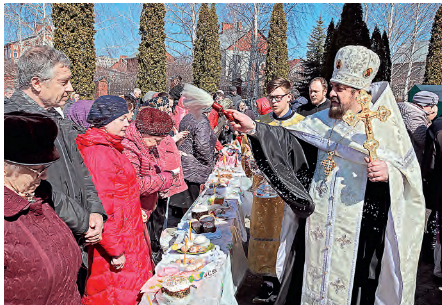
Освящение пасхальной снеди у Спасо-Преображенского собора.

Ирина Васильева