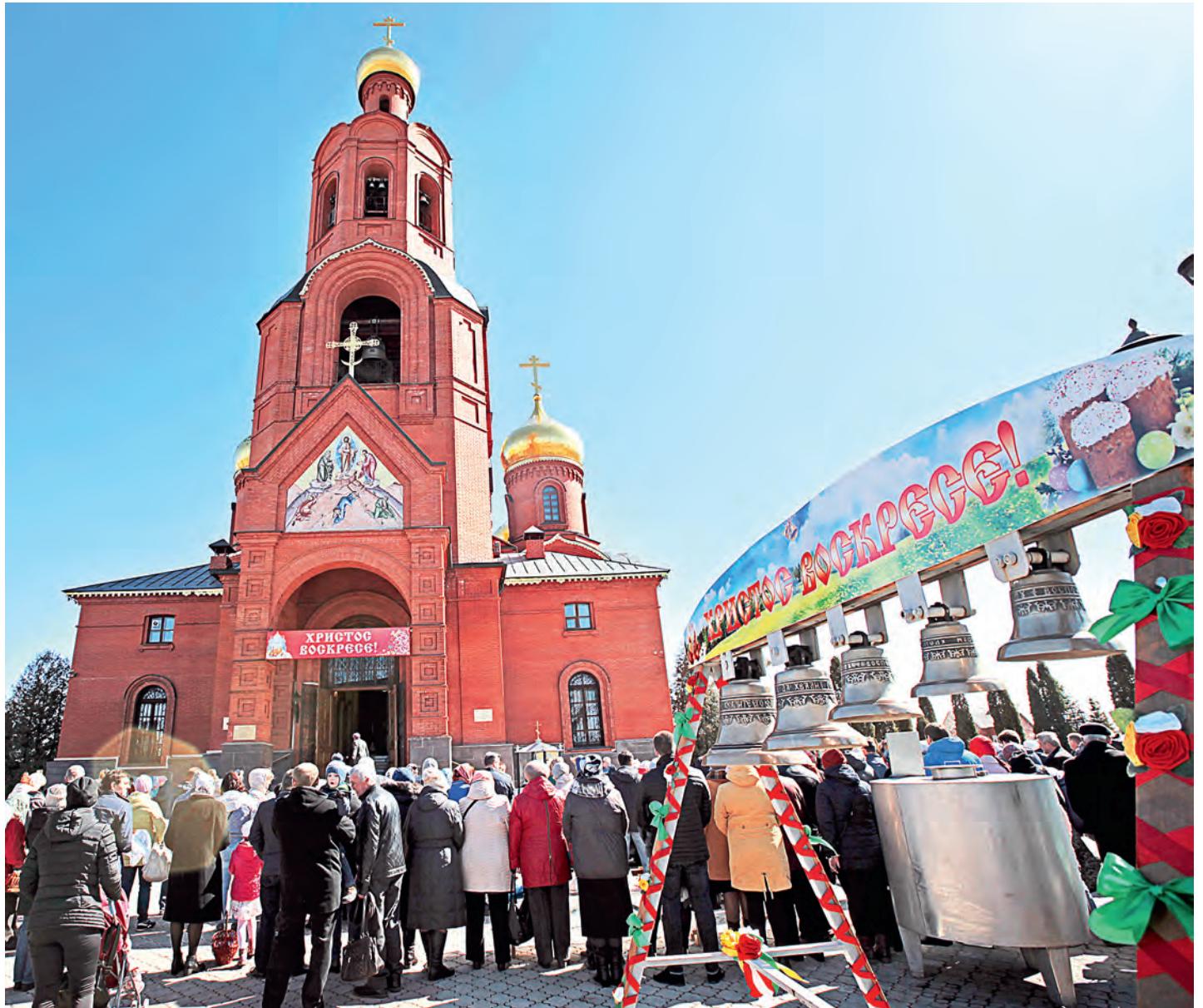
Горожане шли и шли в храм.