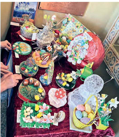
Подарки и поделки к Светлому дню.