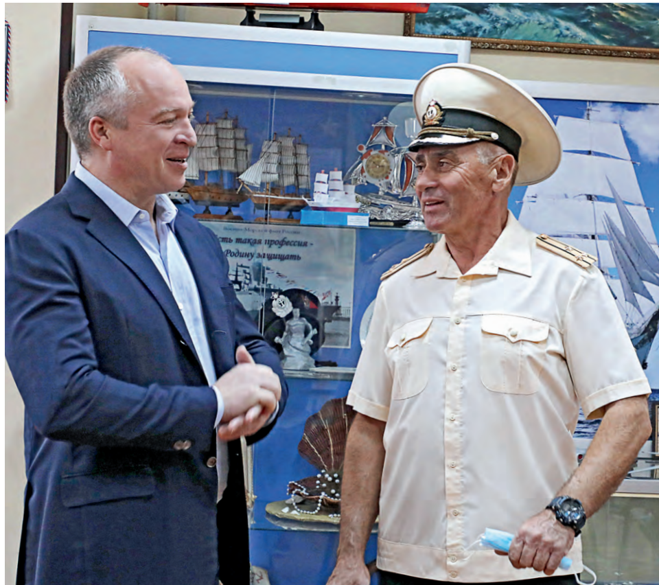
▲ Андрей Скоч всегда с радостью встречается с ветеранами

В ходе рабочей поездки депутат Госдумы Андрей Скоч осмотрел социальные объекты в Шебекине и провёл приём граждан в областном центре.