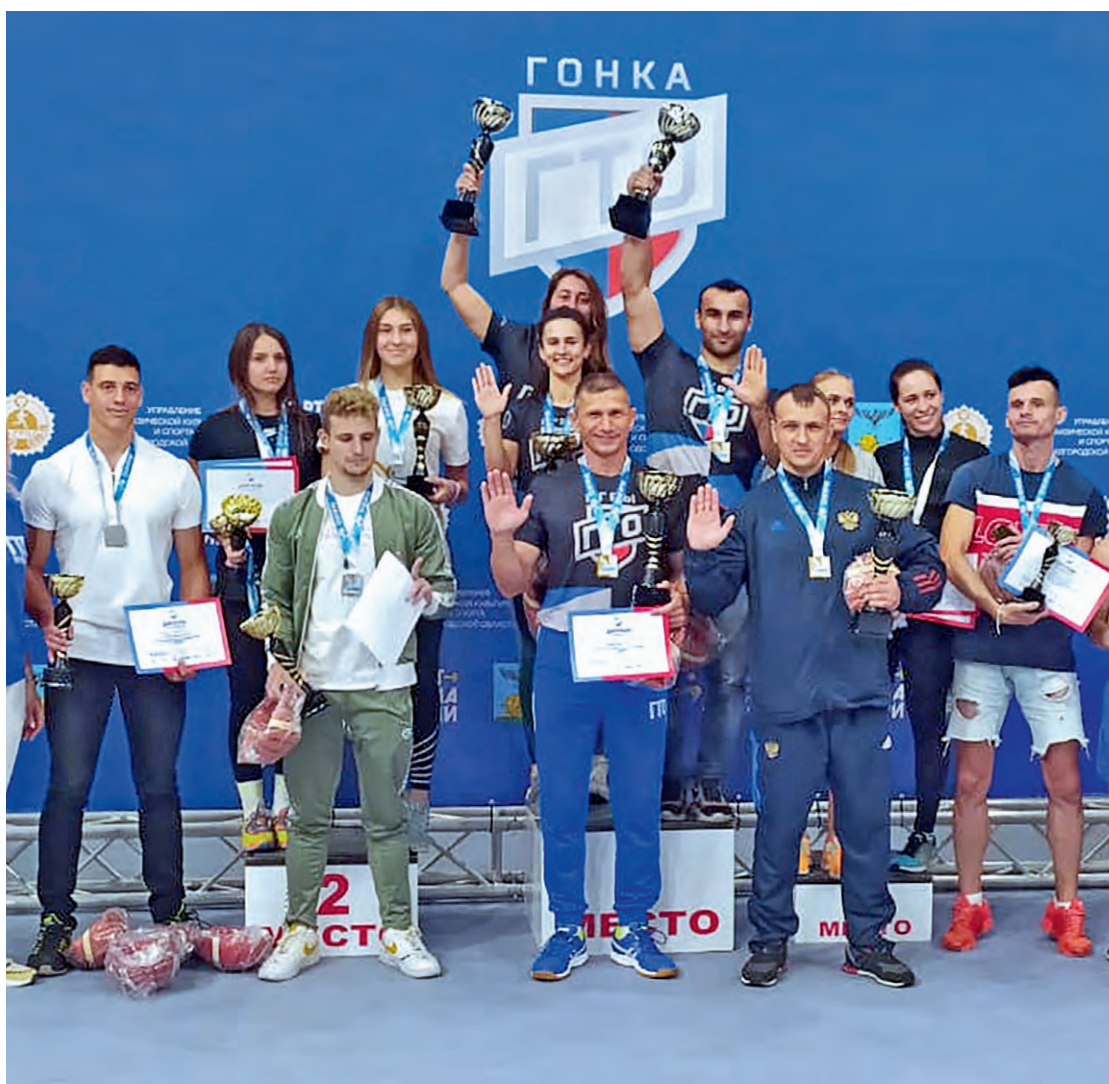
▲ Призёры «Гонки ГТО»