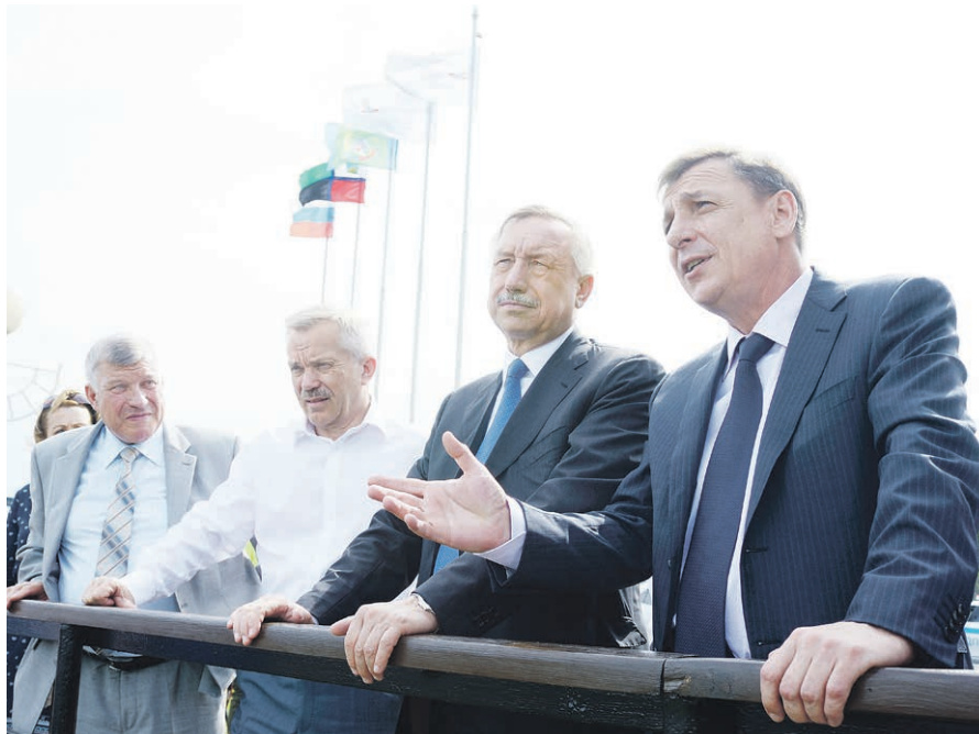
Гости побывали на борту карьера.

– Лебединское месторождение – крупнейшее в западном полушарии. Замечательно, что при его разработке используются передовые и экологически чистые технологии, а для работников