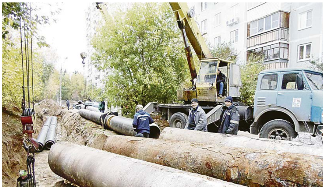
Старые трубы ведут к новым проблемам.

— Госдума затягивает принятие поправок в законопроекты, регулирующие применение б/у трубной продукции в ходе ремонта и реконструкции сетей тепло- и водоснабжения, несмотря на то, что они прошли первое чтение. Кроме того, Вы ещё в 2013 году поручили разработать нормативно-правовой акт, запрещающий применять старую металлопродукцию, но воз и ныне там, — говорится в обращении к Дмитрию Медведеву. Проблема не ограничивается применением старых труб во время опрессовки. Некондиционная продукция, по мнению общественников, неправильно используется также при ремонтах и реконструкциях теплосетей и магистральных водопроводов. Масштабы впечатляют: более