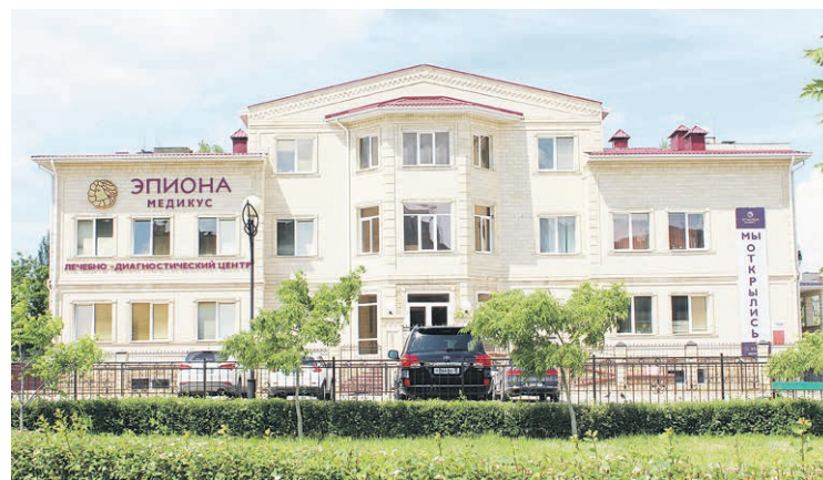
Старый Оскол, мкр. Королева, 12В. Тел. (4725) 39-05-35

В январе в Старом Осколе открылось уникальное для Белгородской области медицинское учреждение, в котором оказывают услуги по пластической хирургии, врачебной и эстетической косметологии, гинекологии и другие.