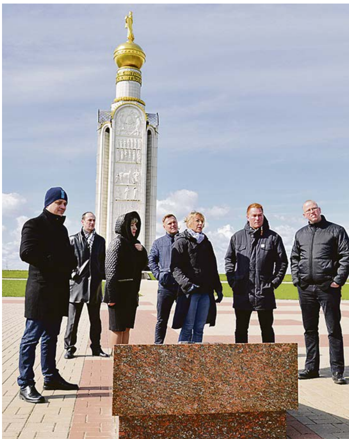
Экскурсия на Прохоровское поле и посещение музейного комплекса.

профессиональных учебных заведений, специально подготовленные агитаторы ездят по стране, занимаясь даже со школьниками. Создан молодежный сайт. По данным исследований, за несколько лет численность молодых членов профсоюза значительно возросла. Нашим соотечественникам было интересно узнать и о знаменитой датской социальной модели с бесплатным образованием и медицинским обслуживанием. При этом 50% зарплаты граждане Дании отчисляют на уплату налогов. По покупательной способности страна занимает шестое место в мире. Датские пенсионеры - достаточно обеспеченные люди, в этом и собственная их заслуга: в трудоспособном возрасте они регулярно отчисляли в накопительный пенсионный фонд 9% зарплаты. Пенсионеры имеют значительные льготы по оплате коммунальных услуг. Безработицы в стране практически нет. На встрече с представителями профсоюза Лебединского ГОКа поднимались вопросы