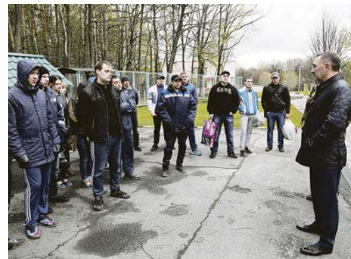
Слесари, инженеры, машинисты...