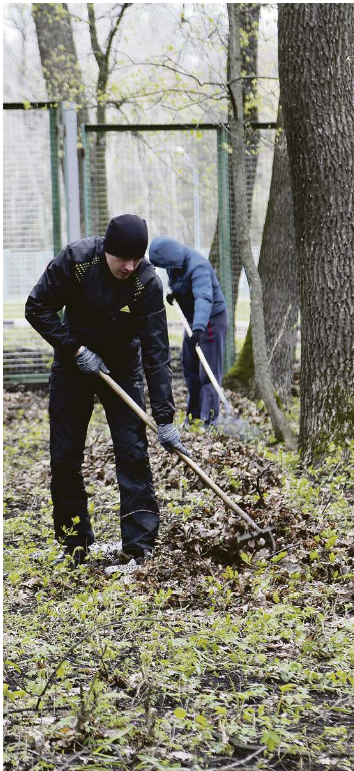
Уборка - дело важное!

23 апреля по всей стране люди вышли на субботники. Лебединская молодёжь, разделяя всеобщий порыв быть полезными, отправилась на уборку территории оздоровительного комплекса «Лесная сказка».