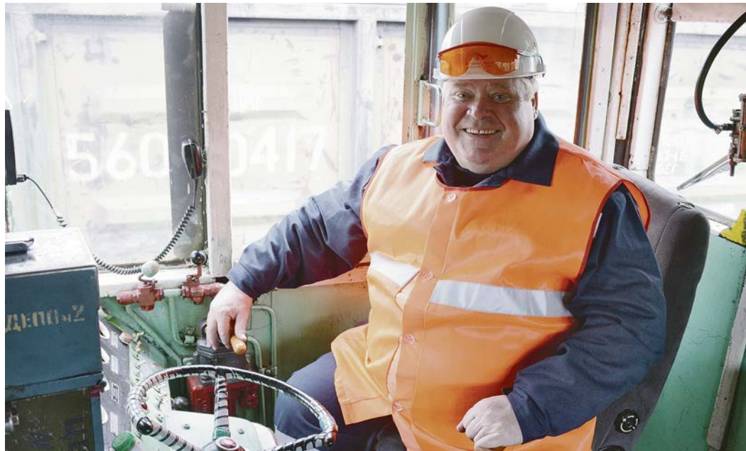
Я не считаю, что это проигрыш. Просто кто-то был более удачлив в этот день, ведь борьба за призовые места была упорной, соперников разделяли считанные баллы. Я очень обрадовался, когда понял, что попал во второй тур. Это ещё один шанс доказать своё мастерство.

Действительно, подтвердить эти слова может любой железнодорожник, ведь они как никто знают, что малейший недочёт в работе, упущение могут обернуться бедой. Все действия машиниста и его помощника прописаны в многочисленных инструкциях, следовать которым нужно неукоснительно.