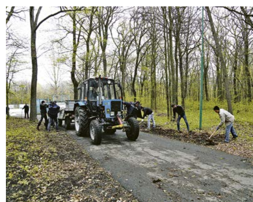
«Арсенал» для уборки листвы.