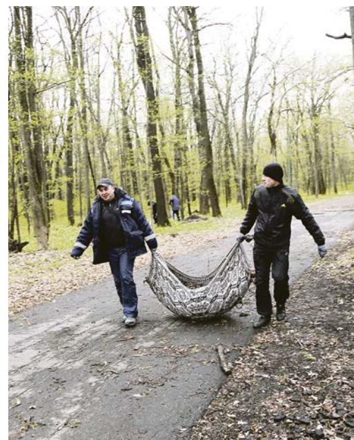
Руки грязи не боятся!