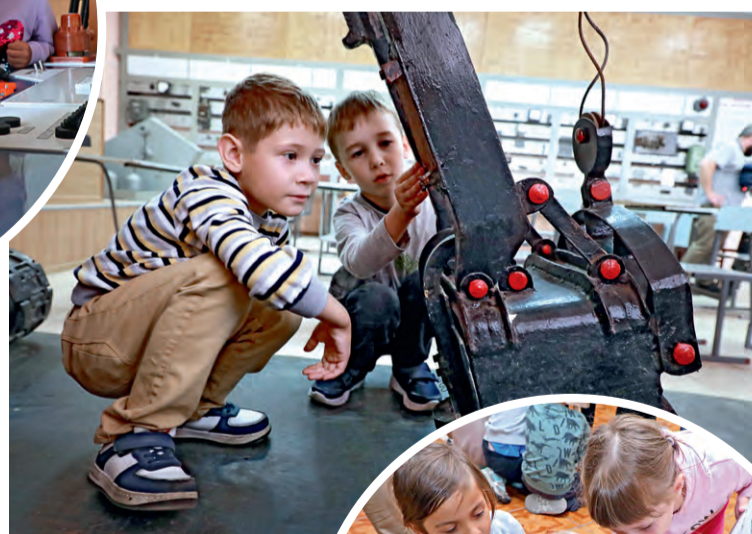
▲ Ещё одна удивительная часть экскурсии — возможность всё изучить и потрогать руками

уникального проекта «Шаг за шагом в мир профессий». Его авторы — педагоги детского сада «Светлячок» — стали победителями конкурса Металлоинвеста «Вместе! С моим городом» и получили грант.