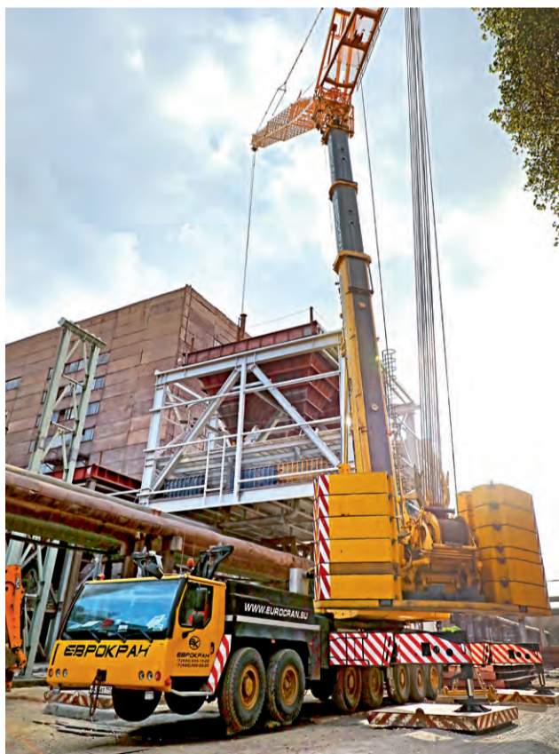
▲ Специалисты монтируют корпуса электрофильтров

Ещё одно преимущество новой технологии газоочистки — экономичность обслуживания. Как отмечает главный инженер проекта проектного офиса дирекции по ин-