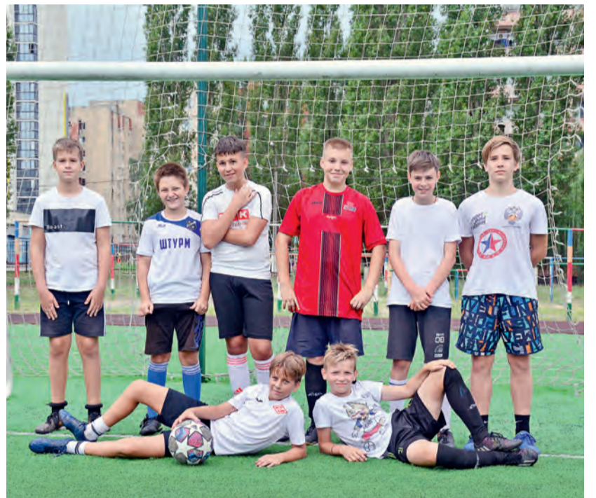
▲ Мальчишки из «Добрыни» взяли серебро детского футбольного турнира

Детский футбольный турнир «Кубок Металлоинвеста – 2023» проходил в Губкине, Железногорске и Старом Осколе с июля по сентябрь. Его участниками стали больше тысячи ребят от 8 до 17 лет, объединившихся в 90 команд по четырём возрастным категориям. За два турнирных месяца юные футболисты отыграли больше 250 матчей. Лучших спортсменов ждали кубки, медали и призы от Металлоинвеста. Чтобы сделать закрытие первенства торжественным и ярким, на всех трёх площадках его провели в день города.