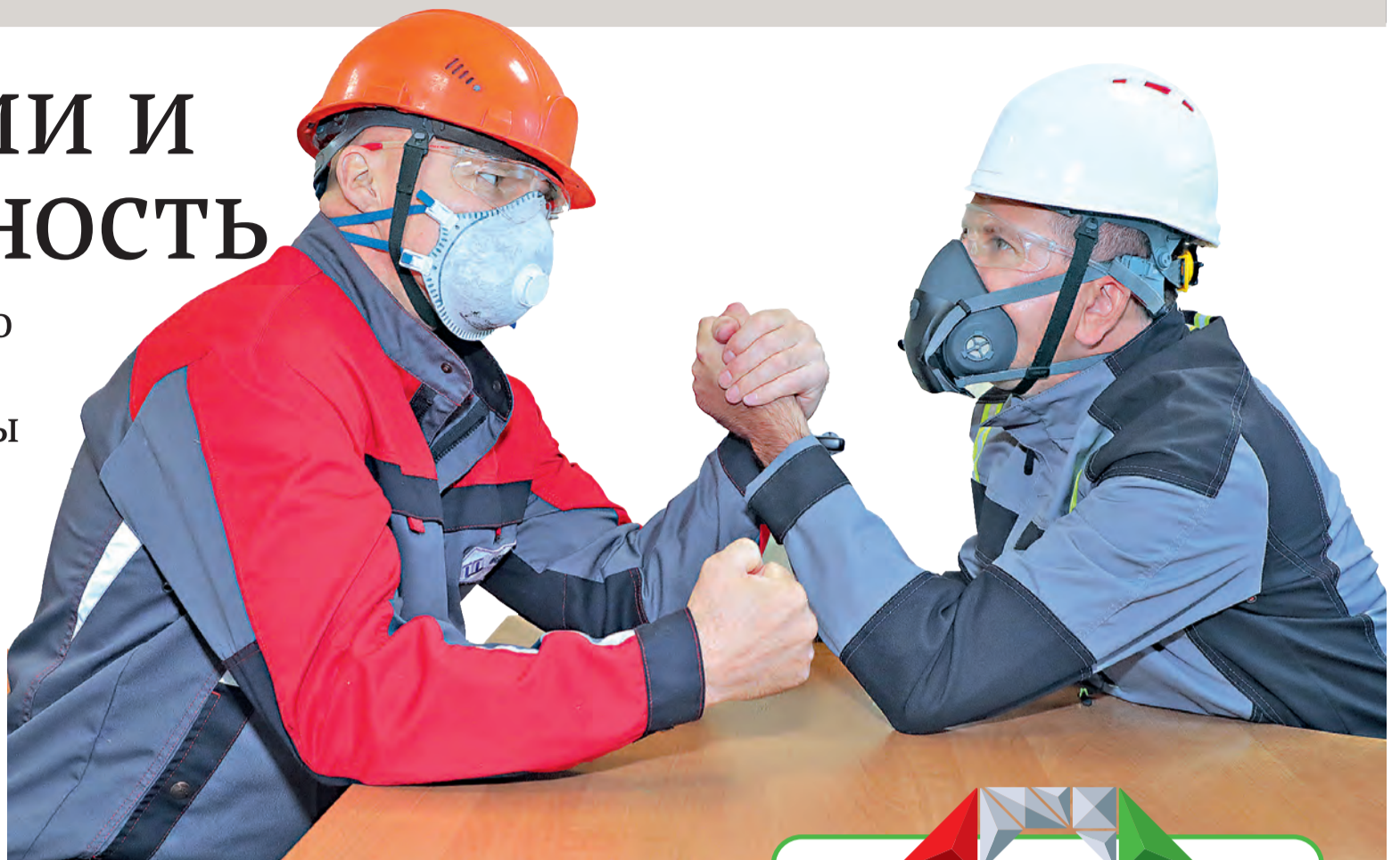
▲ Нередко участники конфликта не в состоянии разрешить его самостоятельно. В таком случае на помощь может прийти уполномоченный по правам человека и корпоративной этике

Чтобы понять причину конфликта, уполномоченный встре-