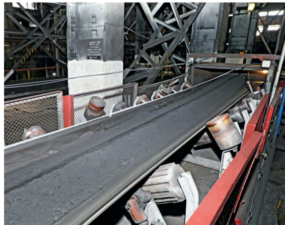
▲ После сушки высококачественное сырьё по конвейерной ленте отправляется в вагоны

Сейчас на участке одновременно работают три сушильных барабана, каждый длиной 27 метров и диаметром 3,5 метра. По конвейерной ленте железорудный концентрат поступает в такой агрегат, где перемешивается при помощи лопастей. Одна «порция» сушится примерно 20 минут, и на выходе обогатителя получают концентрат необходимой влажности.