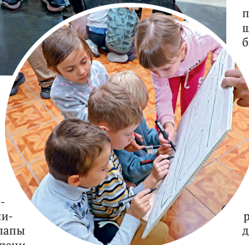
▲ Педагоги и студенты колледжа подготовили для маленьких гостей познавательно-игровую программу: ребятки разгадывали ребусы, называли виды транспорта, рисовали машины...

ботаю на градообразующих предприятиях. И наш проект как раз позволит интересно рассказать, чем занимаются на комбинатах их папы и мамы, в чём изюминки специальностей, для чего они нужны. Возможно, кто-то из детей захочет стать водителем БелАЗа или машинистом электровоза.