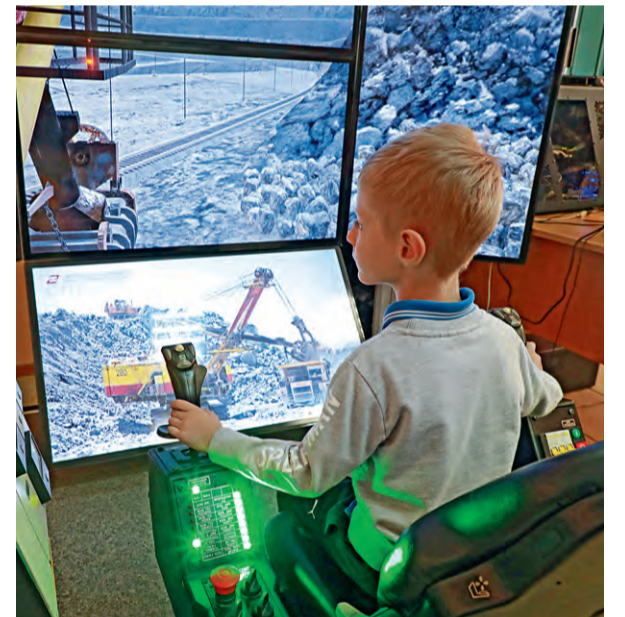
▲ Тренажёр даёт полное представление о процессе погрузки руды с помощью экскаватора