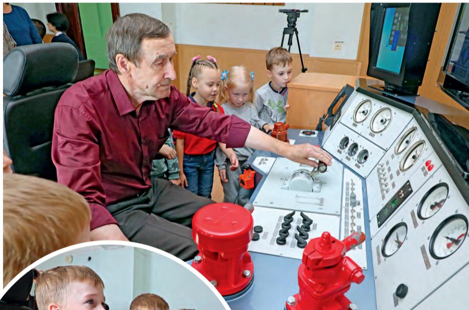
▲ Преподаватели колледжа подробно рассказали и показали ребятам, как управлять той или иной техникой

Экскурсия для дошколят в лаборатории колледжа — часть