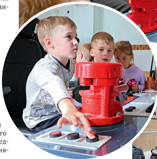
▲ Какой мальчишка не мечтает попасть в кабину машиниста электровоза и дать приветственный гудок?!