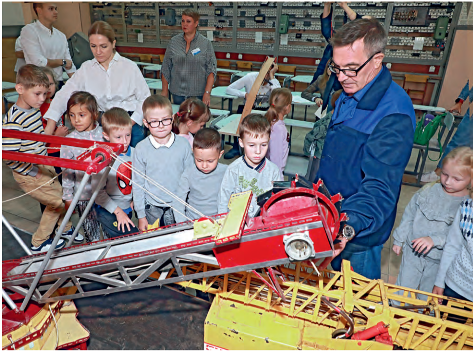
▲ Мальчишек и девочек впечатлили большие модели агрегатов — экскаваторов, буровых установок и кранов различных моделей

Как губкинских дошколят знакомят с особенностями горняцких специальностей