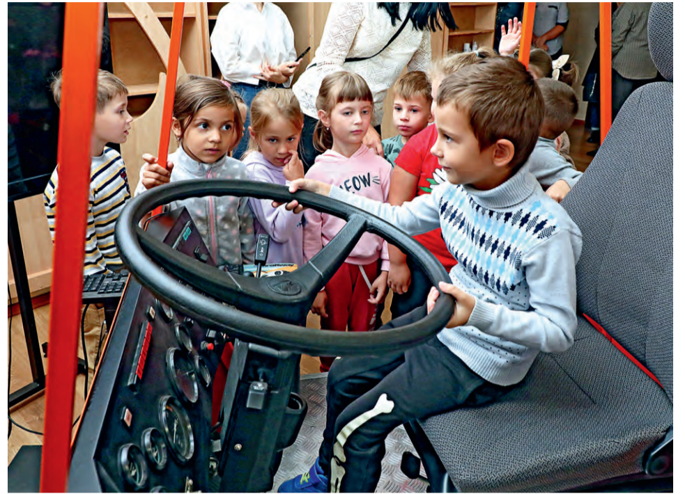
▲ Самому «порулить» огромной машиной — здорово!

Ольга Шалыгина, Евгения Шутихина