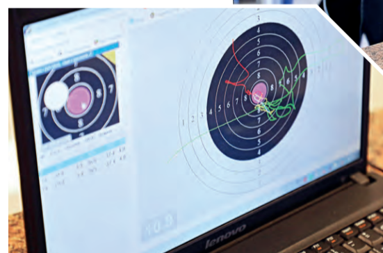
◀ Так выглядит желанная «десятка» на мониторе электронной системы «СКАТТ»