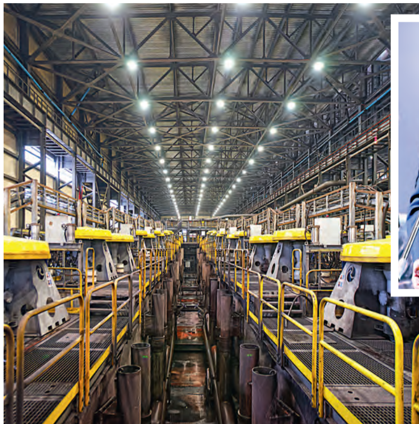
▲ Флотационное дообогащение позволяет получить концентрат самого высокого качества, содержащий 71 % железа

Лучшие инженерные умы компании засели за исследования. Им