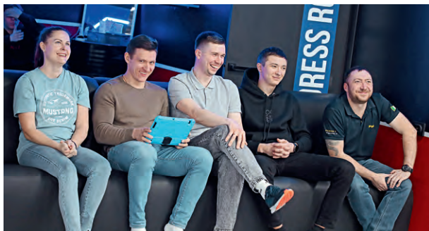
▲ Зрители со смехом наблюдали за забавными перемещениями коллег по залу