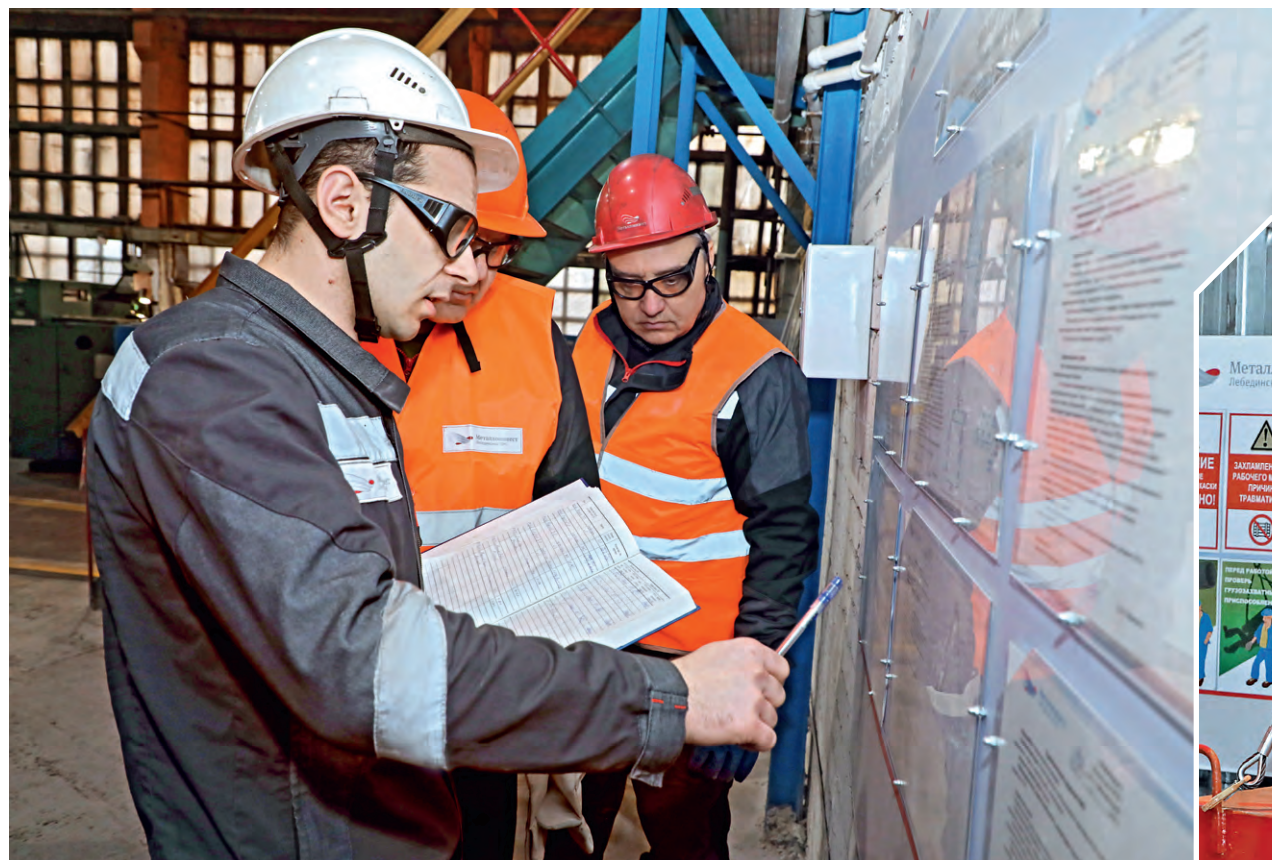
▲ Прежде чем приступить к практическому занятию, работники слушают теоретический курс и знакомятся с тонкостями задания

➤ 300 сотрудников ремонтных служб прошли практический курс на специализированных площадках.