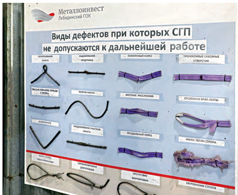
▲ Площадку в УПЗЧ оснастили стендами с образцами дефектов грузозахватных приспособлений

— Стропальщики работают не один десяток лет и выработали собственные сигналы, которые отличаются от оригинальных. Помогаем вспомнить каноны, то есть общепринятые правила управления действиями машинистов крана. Это не экзамен: занятия не предполагают оценок. Ошиба-