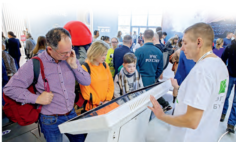
▲ Гости выставки с увлечением отвечали на вопросы викторины...

А тем, кто захотел увидеть Лебединский ГОК воочию, менеджеры промтуризма предлагали экскурсии на комбинат.