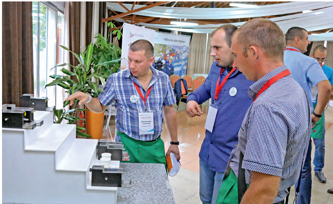
▲ Для сотрудников Металлоинвеста работа и обучение — понятия взаимосвязанные

Ещё в подростковом возрасте я был гитаристом рок-группы, часто выступал на сцене. Сегодня это помогает мне быть уверенным, когда я работаю с аудиторией, вовлекать участников в процесс обучения, даже когда некоторые не хотят вникать в тему или испытывают недоверие к материалу курса.