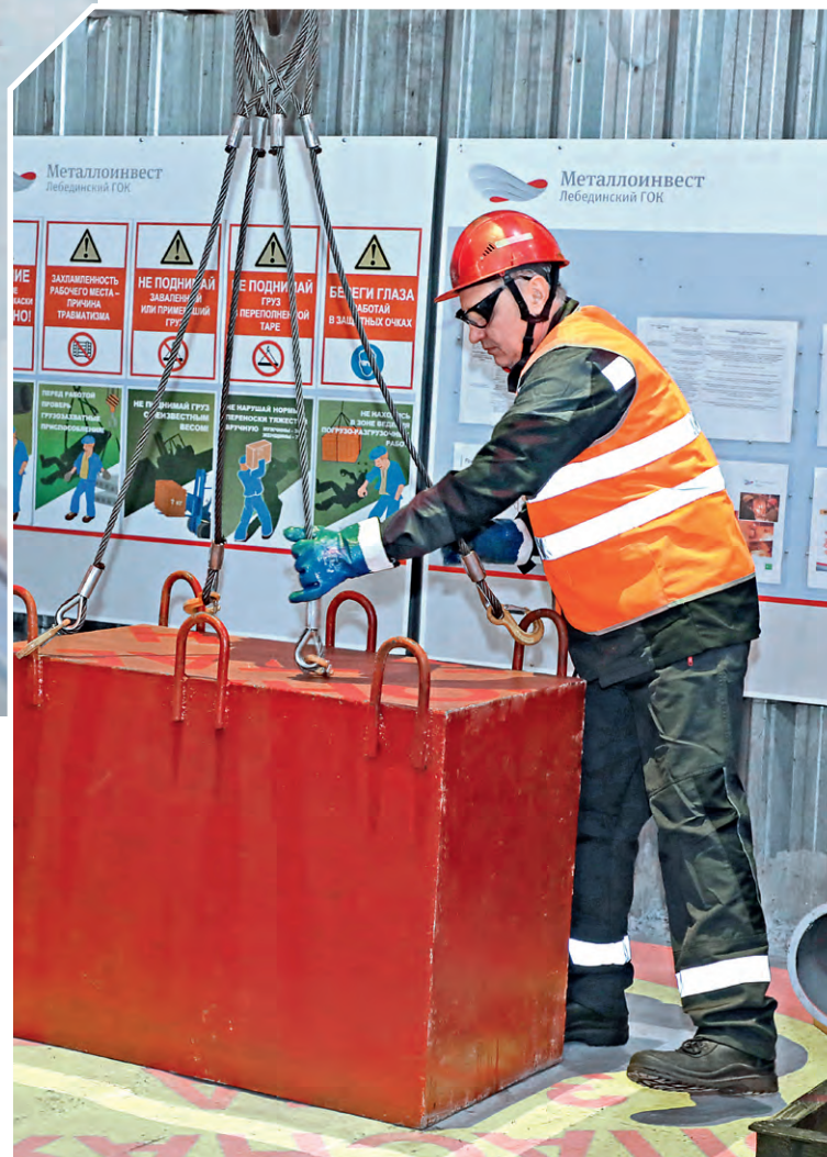
▲ На специализированных полигонах стропальщики и работники смежных профессий отрабатывают практические навыки стропальных и погрузочно-разгрузочных работ

➤ 300 сотрудников ремонтных служб прошли практический курс на специализированных площадках.