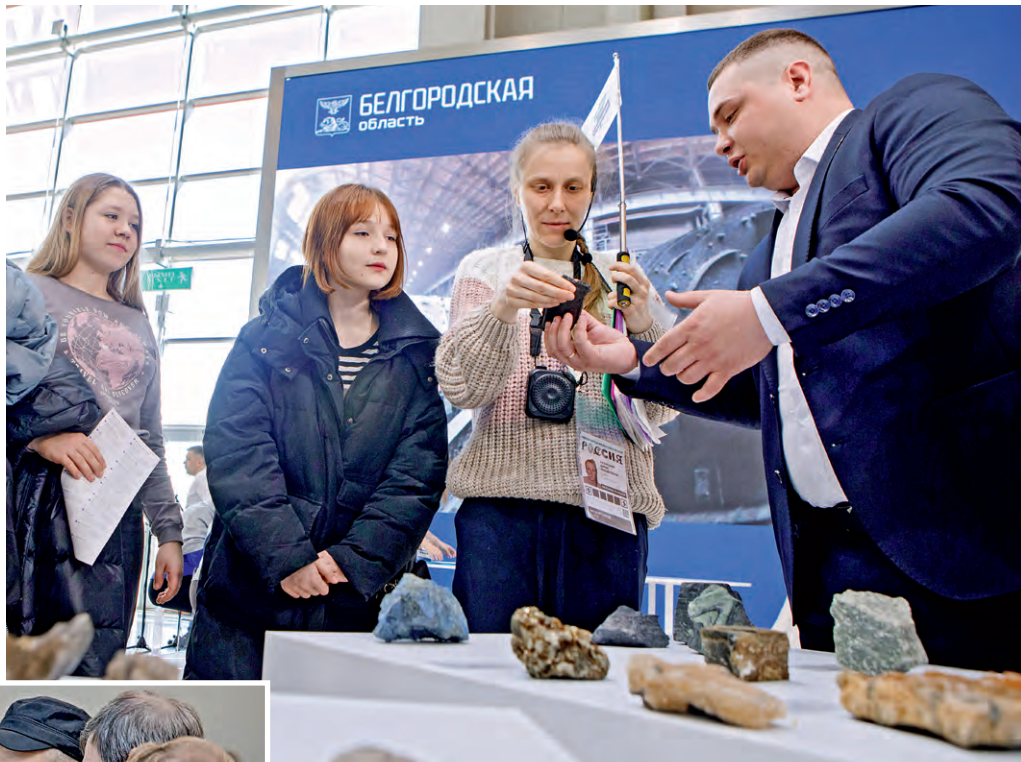
▲ Работники комбината показывали образцы горной породы и продукции

Юлия Шехворостова