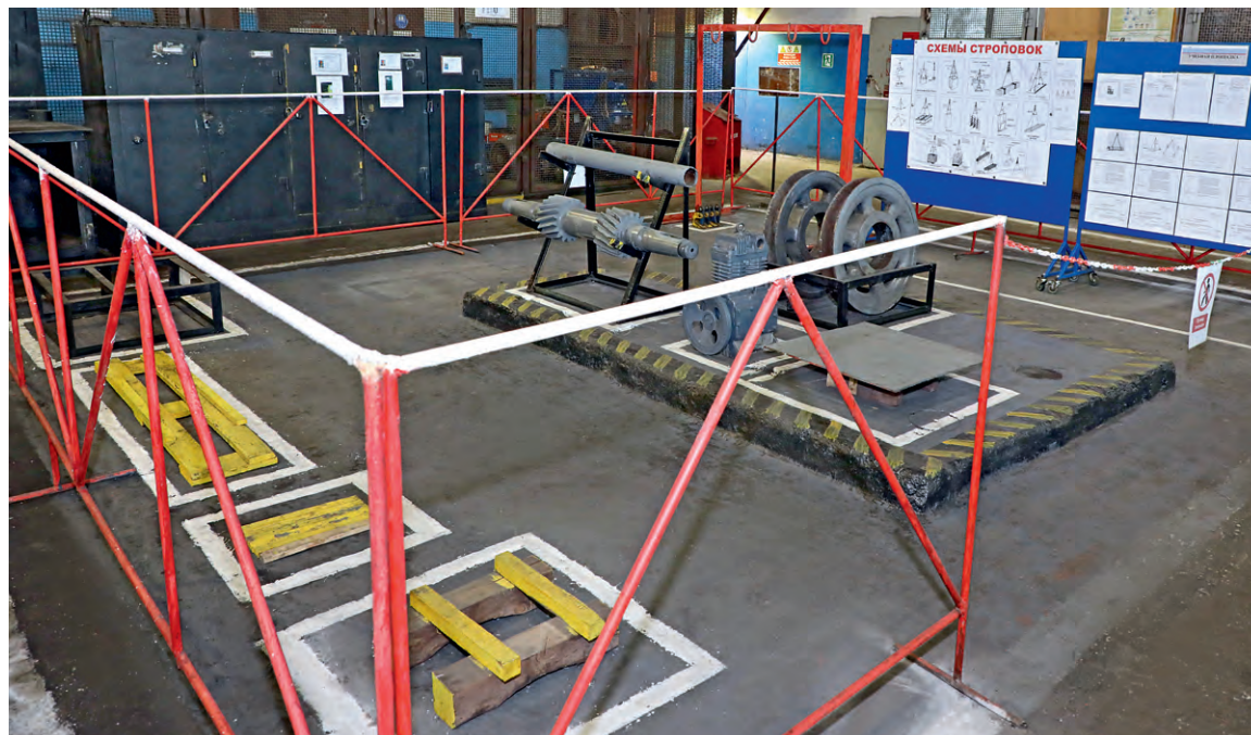
▲ На полигоне, который расположен на территории участка по ремонту горного оборудования, практические навыки отрабатывают сотрудники РМУ, БВУ и рудоуправления

ются — подсказываем, — поясняет Сергей Черкасов.