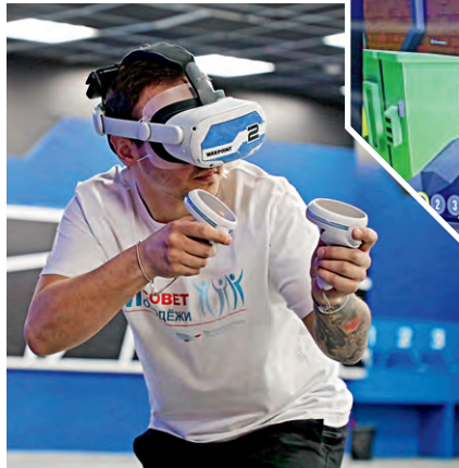
▲ Так видит виртуальную арену каждый участник