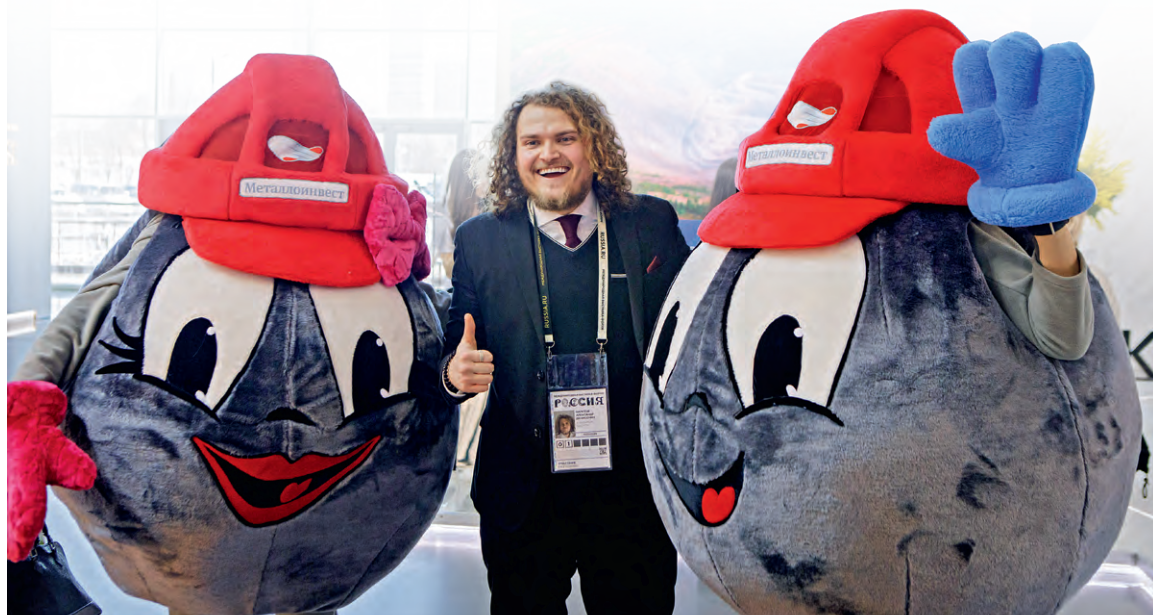
▲ ...и с удовольствием фотографировались с Окатышем и его подружкой