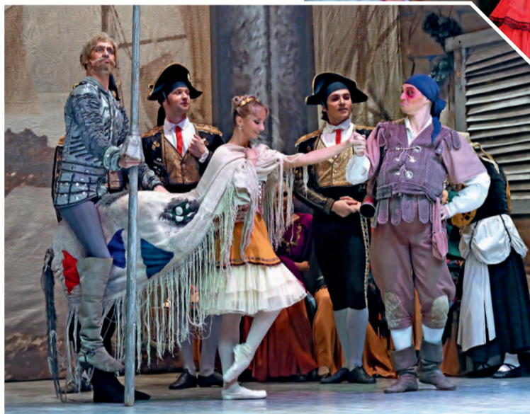
▲ Главные персонажи балета: Дон Кихот на Россинанте и верный оруженосец Санчо Панса