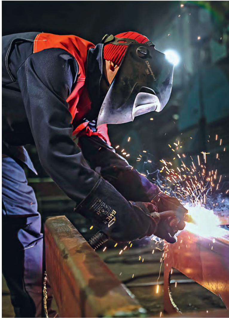
▲ Рынок труда испытывает острую нехватку ремонтного персонала, особенно сварщиков

По замыслу разработчиков, их ИТ-решение позволит избежать перекосов, когда не сильно востребованных в данный момент специалистов слишком много, а нужных прямо сейчас — не хватает. А задано будет учитывать и изменения в самих профессиях. Не исключе-