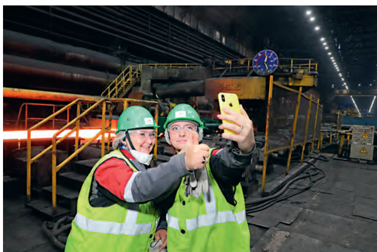
▲ Промышленный туризм позволяет разрушить многие ложные стереотипы о горном деле или металлургическом производстве