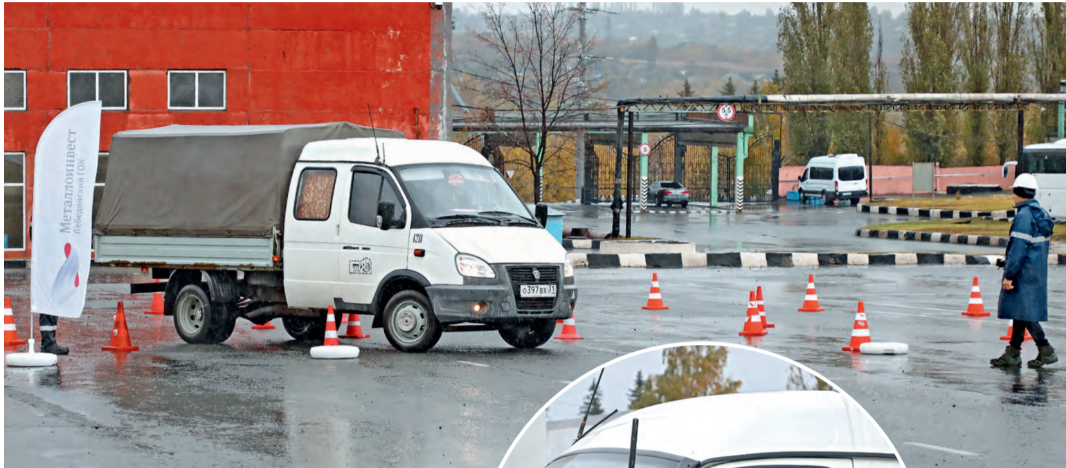
◀ Не сбить фишку — искусство

В двух подразделениях комбината прошли соревнования водителей