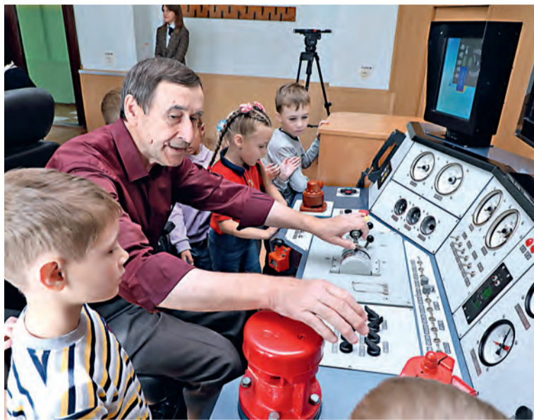
▲ Формировать интерес к профессии можно с раннего детства

— Молодёжи приходит мало. Они в основном выбирают сейчас сферу IT, а «махать кувалдой» хотят немногие, — говорит бизнес-партнёр по вопросам управления персоналом ОЭМК (дирек-