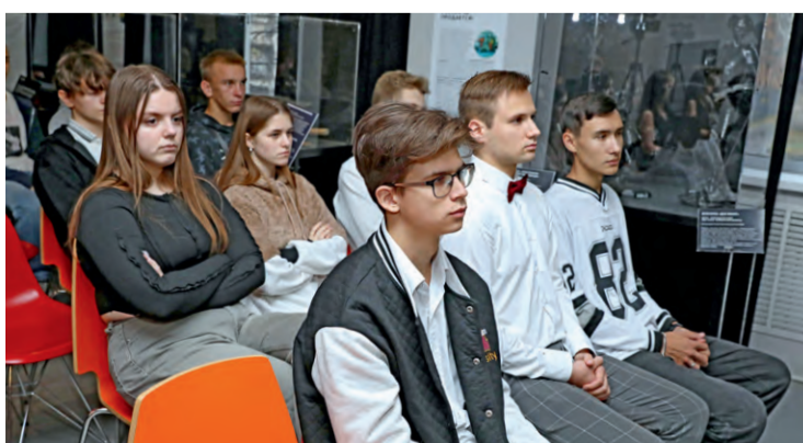
▲ Такие встречи помогают студентам увидеть новые горизонты выбранной специальности

Вопросам «зелёной» металлургии посвятили и обсуждение «Эволюция технологий: оставить след или наследить». О проектах снижения нагрузки на окружающую среду рассказали предста-