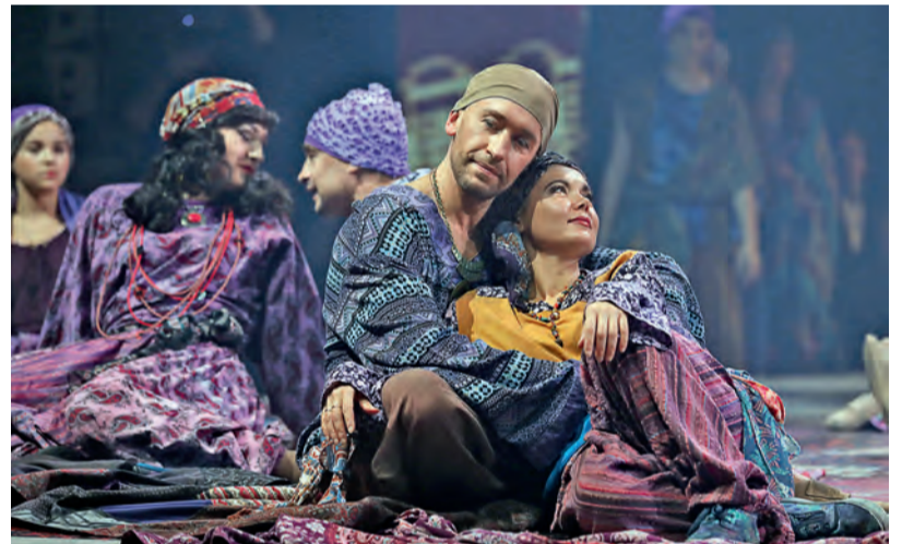
▲ Оперу «Алеко» уже больше ста лет исполняют на ведущих сценах мира