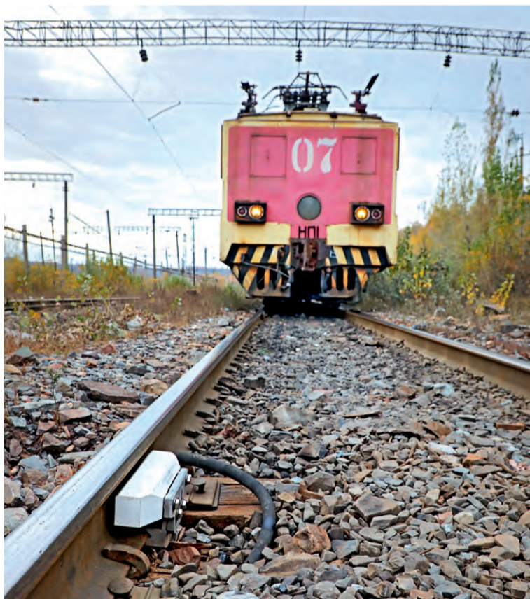
▲ На станции «Рудная» установили 54 счётчика осей — датчиков, которые определяют количество транспорта на территории станции

Теперь рабочее место диспетчера на «Рудной» автоматизировано — достаточно только указать начальную и конечную точки маршрута