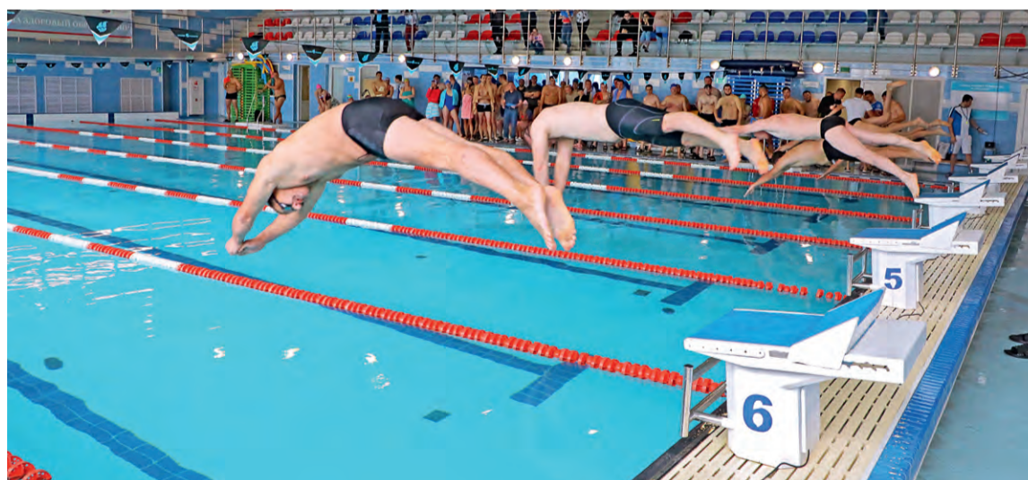
▲ В личном зачёте мужчинам предстояло преодолеть дистанцию в 50 метров