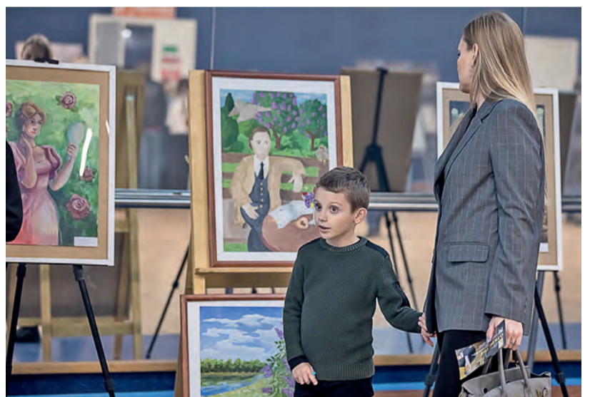
▲ На площадках форума одинаково интересно и детям, и взрослым

классов. А преподаватели школ искусств изучают новые методики классического образования.