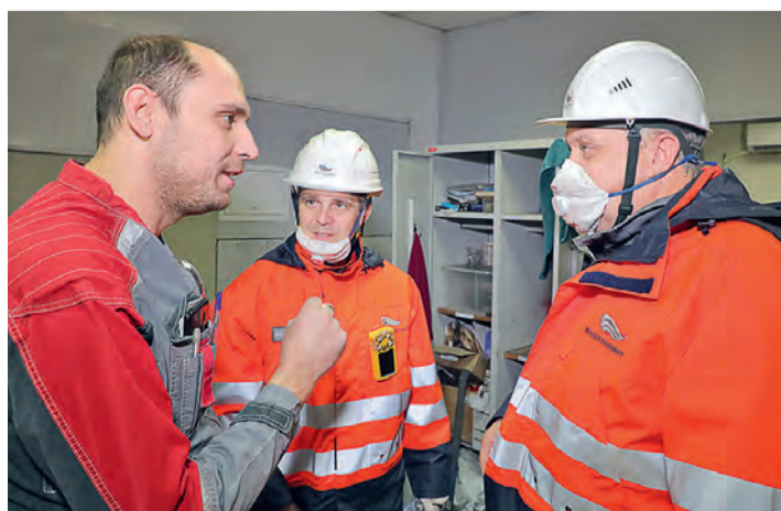
▲ С персоналом говорили не только о работе, но и бытовых условиях, поддержании порядка, обеспеченности СИЗ

Группа, которую возглавил управляющий директор ОЭМК