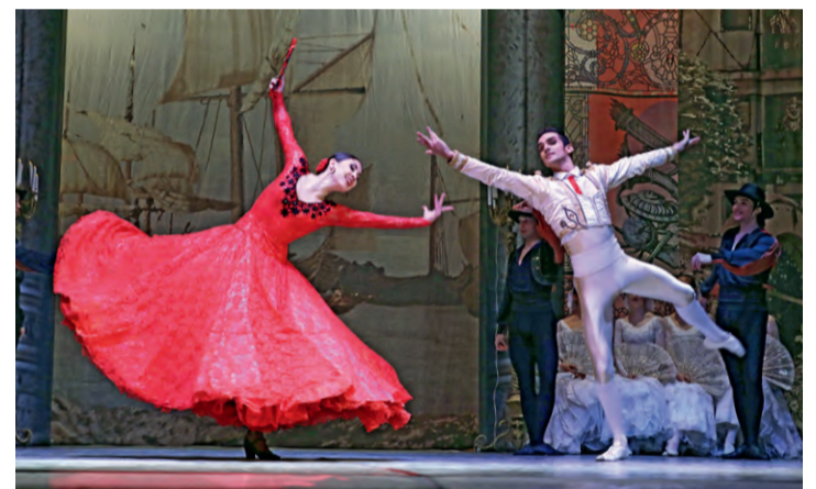
▲ Искромётный испанский танец