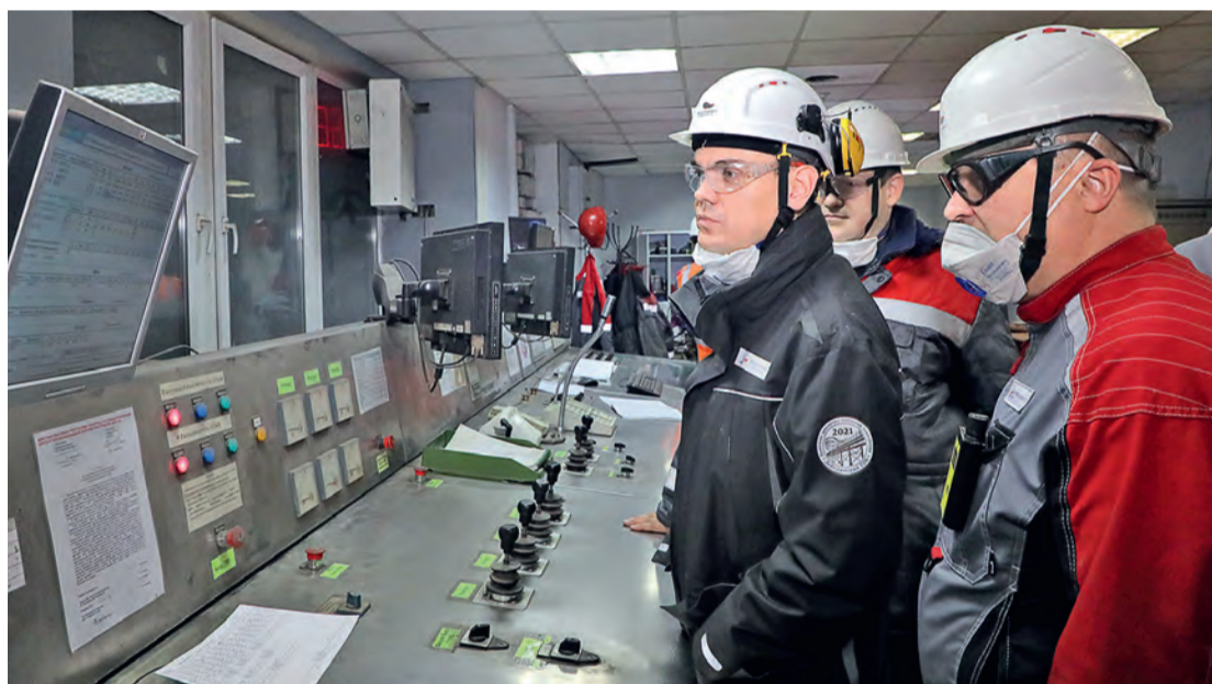
▲ Участники обхода ознакомились с управлением технологическим процессом в ЭСПЦ ОЭМК

Участники обратили внимание на светодиодную полосу, нанесённую на наклонную балку, рядом с которой проходит пешеходный маршрут. Такая подсветка выделяет самые опасные зоны, запылённые